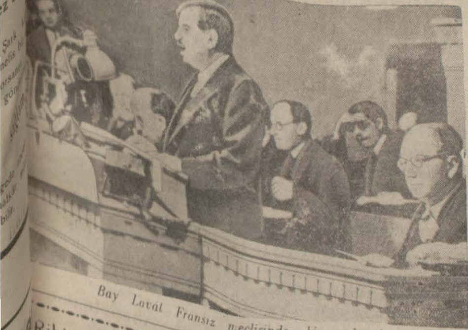
Bay Laval Fransız meclisinde bir nutkunda