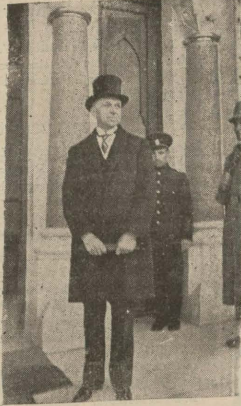
Dün itimadnamesini takdim eden bulg. elçisi B. Pavlof başbakanlıktan çıkarken

Bulgar elçisi Bay Pavlof dün Reiscumur Kamâl Atatürk tarafından kabul buyurulmuş ve muttat merasimle itimadnamesini takdim etmiştir.