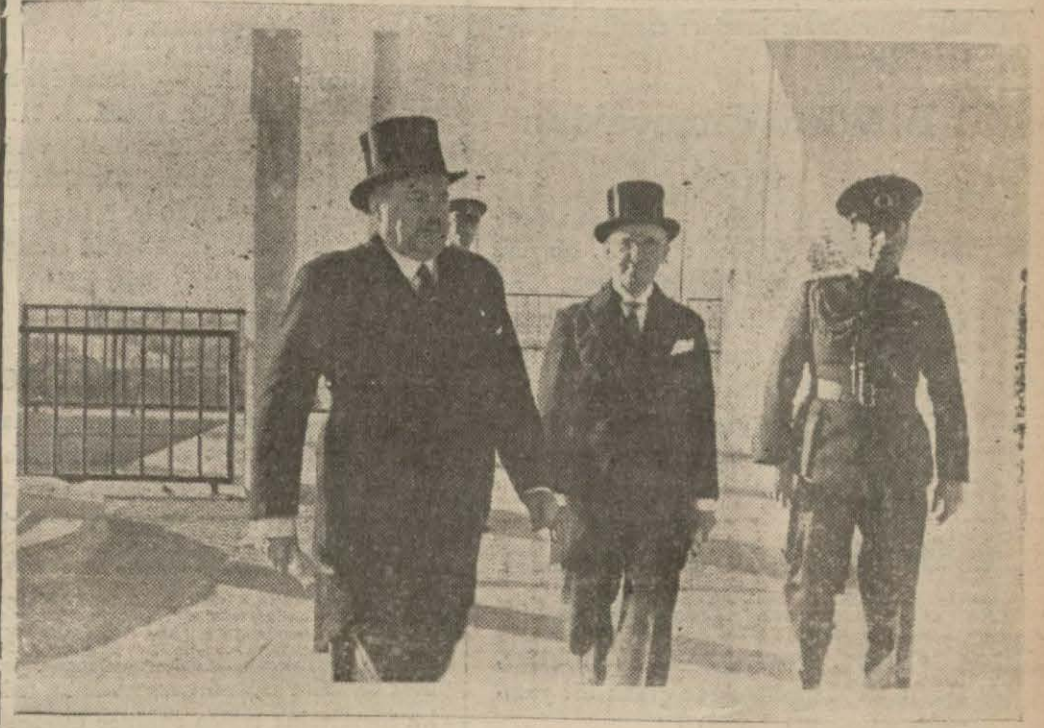
Fransanın Suriye ve Lübnan fevkalade komiseri dün çankaya gelirken