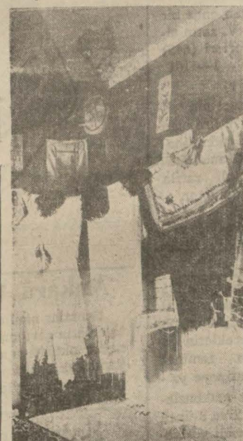
Sergiden bir köşe

Her köyde taklar kurularak şenlikler yapılmış ve köy gençleri sabahlara kadar gülmüş eğlenmiş ulusal oyunlarla hoş bir bayram geçirmiştir. Her sergide köyün muhtarı ve okutmanı ve na-