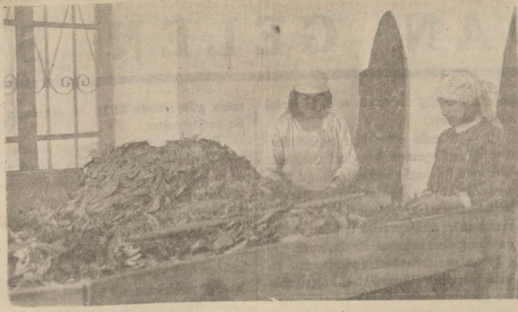
Tütün fabrikasında çalışan kadınlar

Bütün bu yıllar uzunluğunca, Ölümle Dirim arasındaki savaşı, iki savaşı iyice tanımak imkânını bularak müşahade ettim. Başlangıçta, Ölümü, hastahane koşullarında, iş başında gördüğüm zaman Onunla, Dirim arasında karşılaştırmamla, sadece bir pehlivan oyunu ve hattâ bir çocuk eğlencesi idi. Onu, Napoli'de günde, bin kişiyi gözlerimin önünde devirirken gördüm. Onun Mesina'da yüzbin erkek, kadın ve çocuğu, bir dakika içinde toprağa gömdüğünü gördüm. Daha sonraları Onu, Verdönde, elleri dirseklerine kadar kanlar içinde, dört yüz bin kişiyi, Flandr ve Som ovalarında bütün bir orduyu, kılıçtan geçirirken gördüm. Onun böyle, geniş ölçüde çalıştığını gördükten sonradır ki harb taktiğini anlamaya başladım. Bu göz kamaştırıcı, esrar ve tezdalla dolu bir tetkiktir. Bütün bunlar, başlangıçta, çıldırtıcı bir kaos, manasız karışıklıklar ve yanlışlarla dolu kör körüne bir kıtâl gibi görünür. Zaman olur ki, Dirim, eline yeni bir silâh alarak muzafferane ilerlerken biraz sonra galip ölüm karşısında geriler. İş bundan ibaret değildir. Savaş, ölümle dirim arasında değişmez bir muvazenenin kanuniyle, en ince noktaya kadar, tanzim edilmiştir. Bir salgın hastalık, bir zelzele veya bir harb