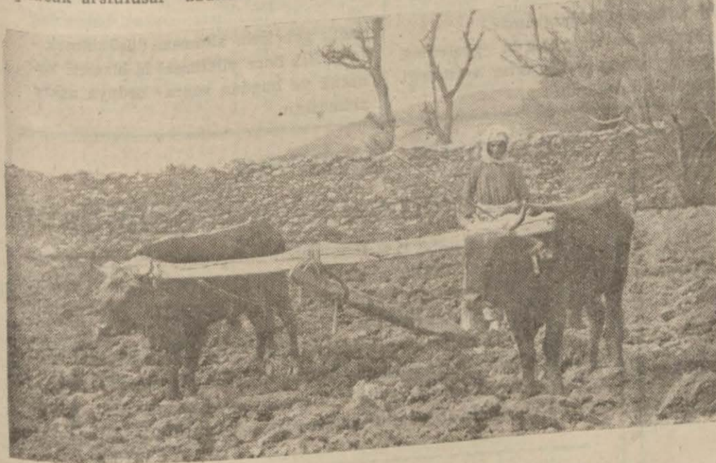
Muğla'da tütün işinde çalışan on bir bin kadından biri

Halkevi İstanbulda 18-4-935 de yapılacak arsulusal kadınlar kongresi