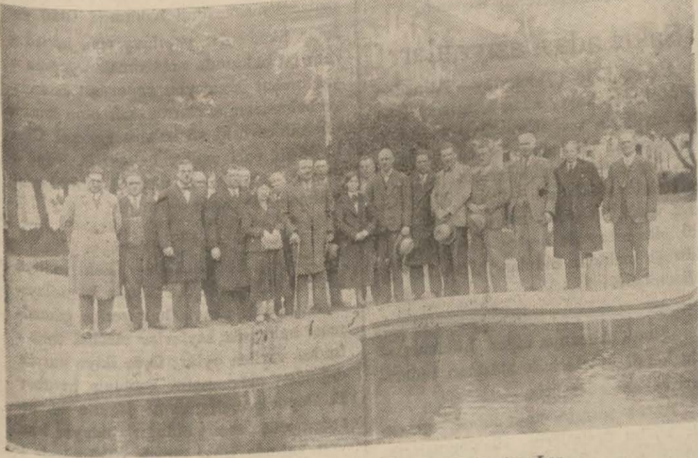
Muğla genel meclisi üyeleri vali ile beraber

türk kadın sergisi için Muğla kadımlığının geçirdi alanlardaki çalışmalarını gösterir önemli belgeler toplamış ve tesbit ederek bu kurumun başkanlığına yollamıştır. Halkevinin yaptığı ara-