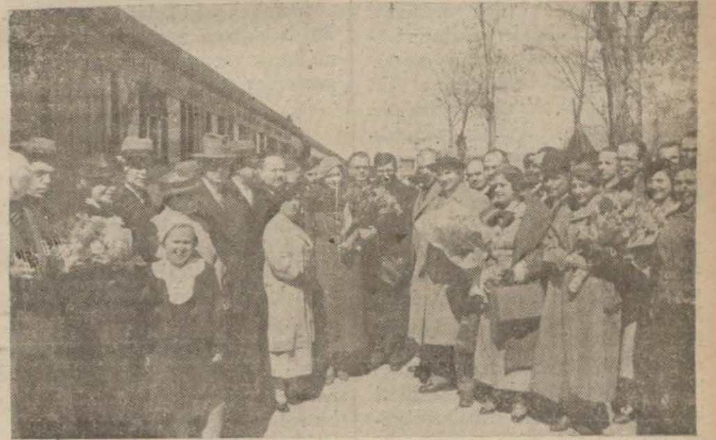
Misafirlerimiz Ankara durağında

Öğrendiğimize göre Sovyet rusyalı sayın misafirlerimiz türk müzikçileri için birçok opera notaları ile geçenlerde Moskova'da açılan tiyatro sergisinin 300 kadar resmini getirmişlerdir. Bu resimler münasib bir yerde ve bir (Sonu 3 üncü sayıfada)