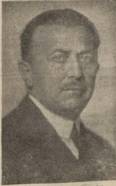
Beyanatta bulunan B. Şükrü Kaya

İçeri İşler Bakanı B. Şükrü Kaya (Muğla) — Van gölü bütçesiyle Ankara'da bulunamadığından, bugün bu gölün vaziyeti siyasiye ve iktisadiyesi hakkında bir cümlelik bir mukaddeme ile vaziyeti anlatmak istediğini söylemiş ve: "Van gölü geçmiş devirlerin en mamur köşelerinden bir sahayı yekdiğirine bağlayan bir iç denizdi. Türklüğün ilk devirlerinde Anadolu'da büyük büyük devletlerin kurduğu merkezlerin iç denizi idi, diyerek Van gölünün siyasal, ekonomik ve tarihsel değerini, Şeyh Said azması ve onu kovalayan günlerde önemini belli ettiğini, Van gölü işletilir-