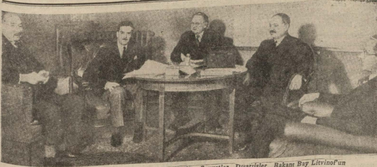
Bay Eden Moskova'da iken alınmış bir fotoğraf; Sovyetler Dışişleri Bakanı Bay Litvinof'un evinde verilen ziyafetten sonra

Ökonomi Bakanlığı elektrik, havagazı ve su satıcılarıyla ölçüaletlerinin muayene ve ayarları için bir talimatname hazırlamıştır. Bakanlık talimatnamede muayene ve ayarın nasıl yapılacağını halkın müracaat şekillerini ve kontrol işlerini ayrı ayrı göstermektedir.