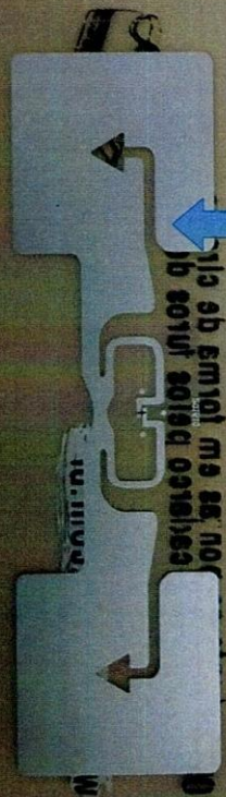
Chip do edital 2019