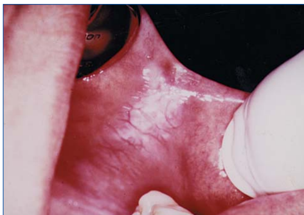
Figura 1. Lesión leucoplásica retrocomisural. Aspecto posqueteadado. Paciente mujer fumadora.

La leucoplasia grado II, en cambio, presenta relieve, queratosis o placa, por engrosamiento de la capa cór-