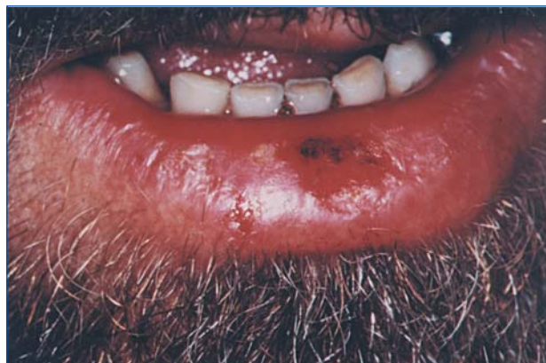
Figura 3. Queilitis crónica. Se observa una zona erosiva central de larga evolución con exposición prolongada a los rayos UV.

En los próximos párrafos explicaremos brevemente los distintos tipos de queilitis mencionadas.