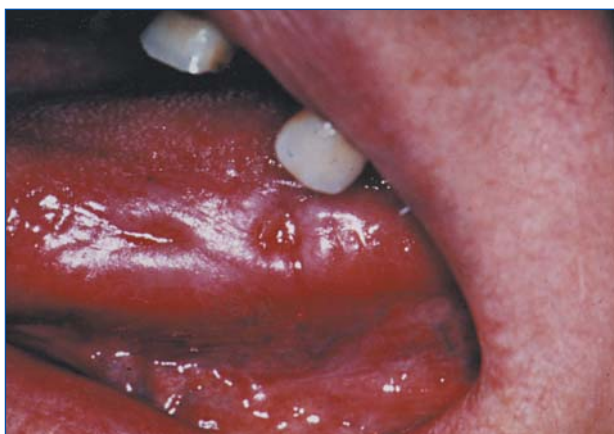
Figura 4. Úlcera traumática crónica. Lesiones en borde lingual con pérdida de sustancia en relación con piezas dentarias que traumatizan. Son bien delimitadas y con bordes edematosos de sintomatología dolorosa.

Teniendo en cuenta que la abrasión podría actuar como promotora en el proceso de carcinogénesis y que la inmensa mayoría de carcinomas epidermoides de la lengua se observan localizados en su tercio medio y posterior, sitios coincidentes con las ulceraciones, se hace necesario deter-