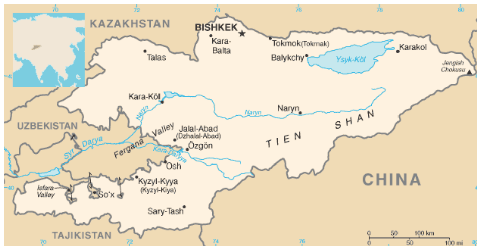
Figure 1: Kyrgyzstan, and bordering countries

The territory of Kyrgyzstan is located within two large mountain systems which to a large extent create the borders between countries (Figure 1). The larger Eastern part lies within the Tien Shan Mountains running on North-Eastern axis and separates Kyrgyzstan and China. In the East the main ranges of the Tien Shan converge in the Meridional mountain range, thus creating a powerful mountain junction. The highest peak is Peak Pobeda whose summit is 7439 m. To the South-West the Pamir-Alay separate Kyrgyzstan from Tajikistan and Uzbekistan. In the North and Southwest are foothills and piedmont slopes including the Chui Valley, a suburb of the larger Fergana Valley, which also separates the country from Uzbekistan.