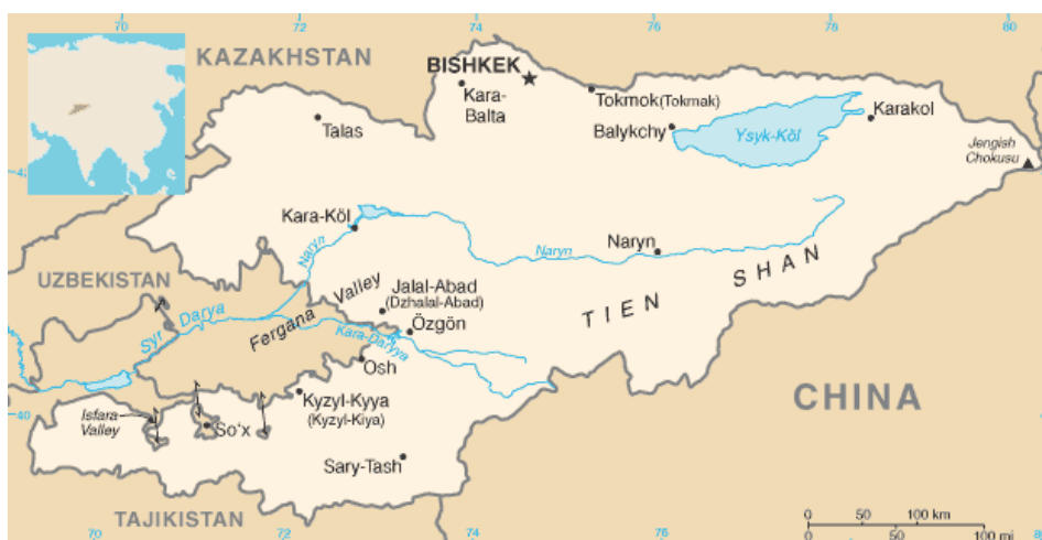
Рис. 1. Карта Кыргызстана

Территория Кыргызской Республики составляет 19994 тыс. га (5,6% - леса, 3,8% - вода, 54,0% - сельскохозяйственные угодья, 36,6% - прочие земли). Почти 90% территории занимают горы с высотами более 1500 м над уровнем моря. Средняя высота над уровнем моря составляет 2750 м, максимальная – 7439 м, минимальная – 401 м. На высотах от 1000 до 2000 м расположено 58% населенных пунктов, в которых проживает 35%, а на высотах свыше 2000 м – 5% от общей численности населения (Национальный доклад КР FOWECA, 2005; Комплексная оценка природных ресурсов Кыргызстана, 2008-2009).