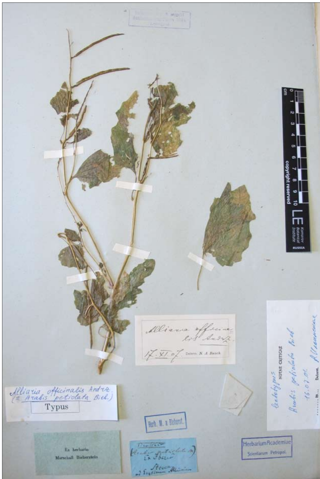
Рис. 3. Фото типа Arabis petiolata Bieb.