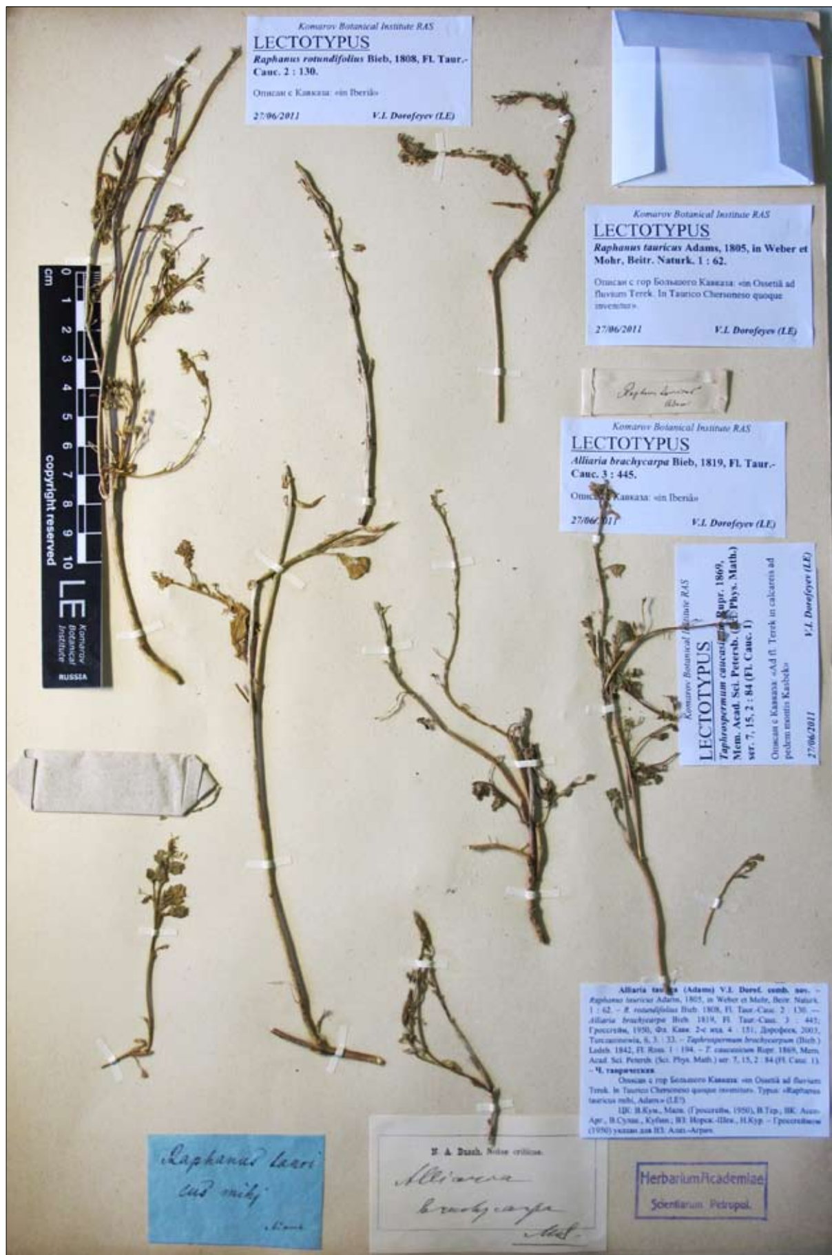
Рис. 1. Фото лектотипа Raphanus tauricus Adams.