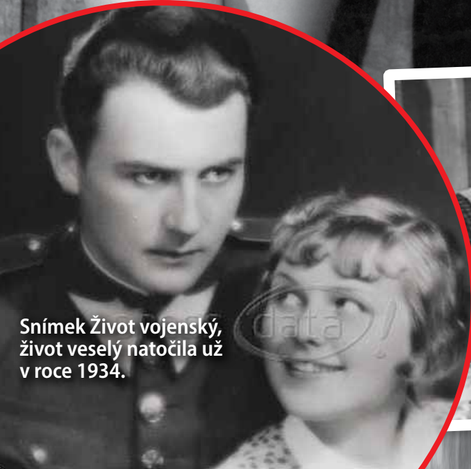
Snímek Život vojenský, život veselý natočila už v roce 1934.