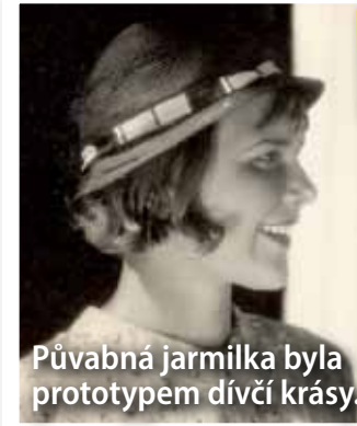
Půvabná jarmilka byla prototypem dívčí krásy.