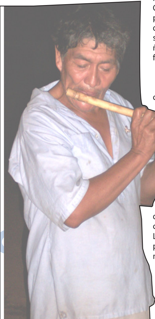
Moseten tocando su flauta

Los mosetenes, durante muchas generaciones cubrieron sus cuerpos con esta vestimenta, hasta que alguien invento el tejido de hilo del algodón para vestirse.