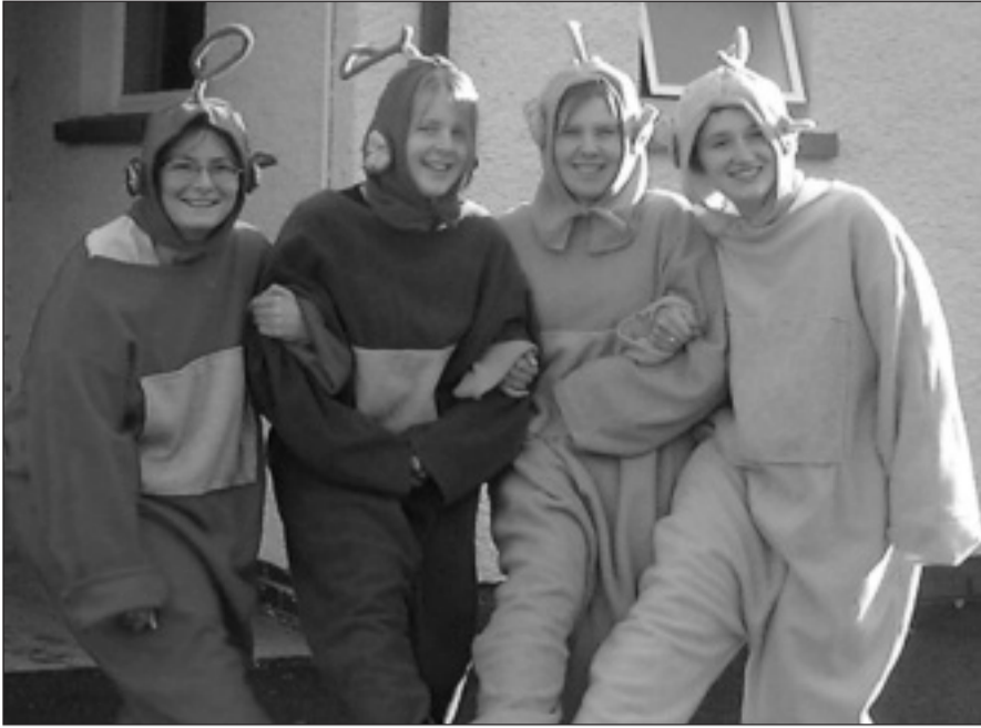
Teletubbies Tal-y-bont ar ddiwrnod Plant mewn angen

Er ein bod ni'n brysur iawn yn paratoi ar gyfer y Nadolig, bu mis Tachwedd yn ddigon prysur gyda nifer o ymweliadau wedi eu trefnu yn yr ysgol a sawl gwibdaith hefyd. Dyma flas o'r gweithgareddau:-