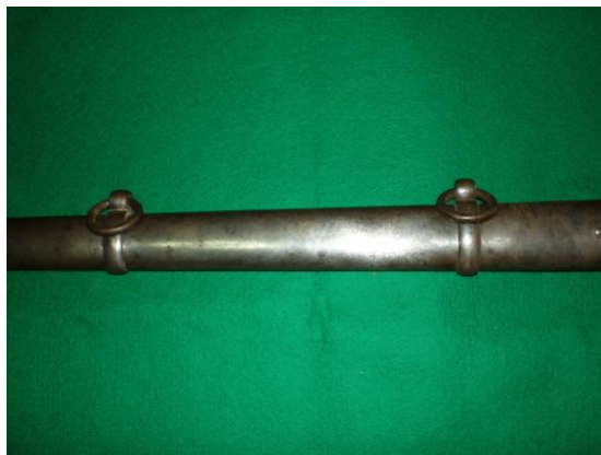
Anillas de la vaina