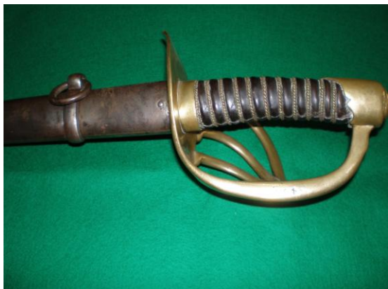
Vaina y empuñadura