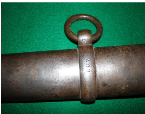
Número de la vaina