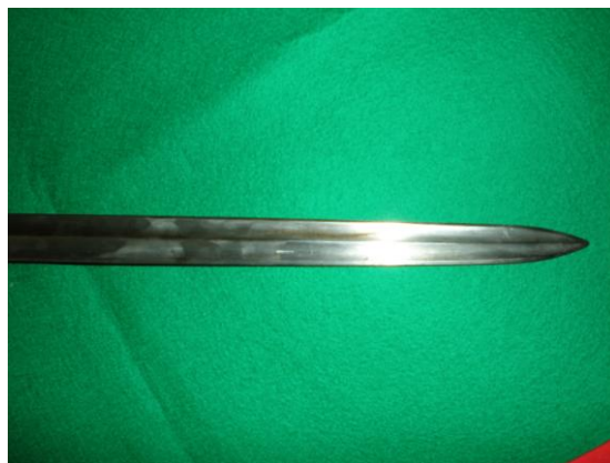
Punta de lanza