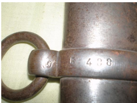
Detalle de la vaina – abrazaderas y punzones-