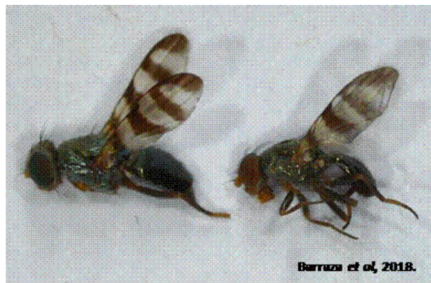
Figura 3. Euxesta stigmatias colectada durante la investigación.