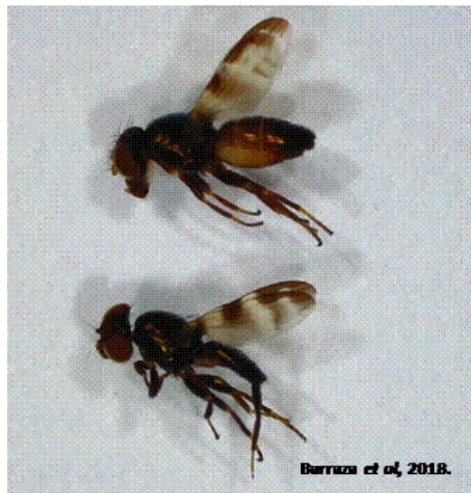
Figura 2. Euxesta annonae colectada durante la investigación