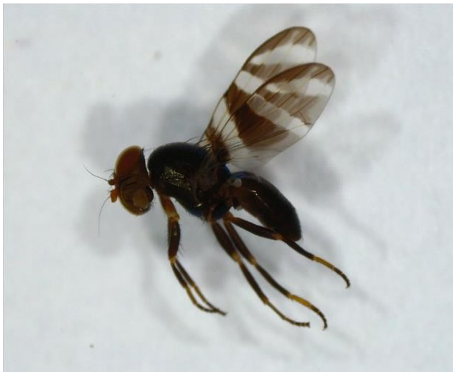
Figura 1. Euxesta mazorca colectada durante la investigación

Especies de Euxesta spp encontradas por provincia y localidad