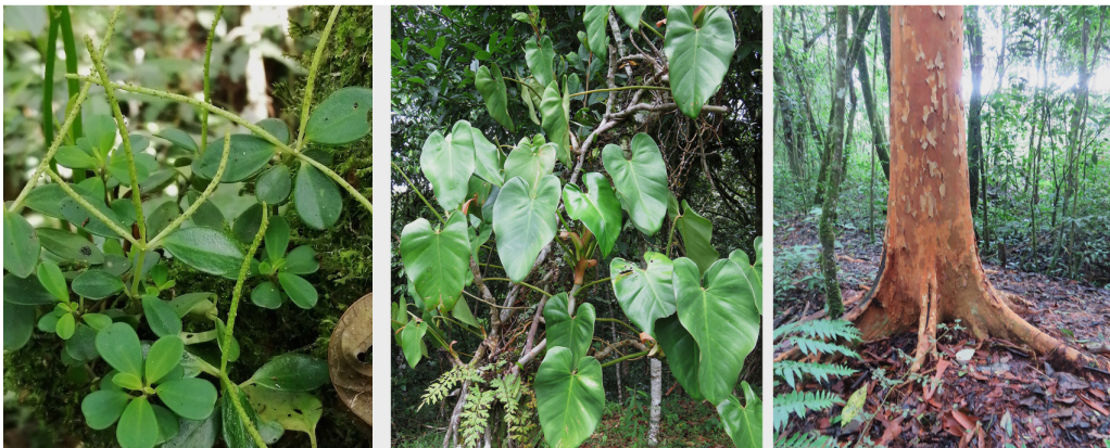
Figura 3. Especies características de algunos de los hábitos de crecimiento presentes en el “Sendero Mariposas Alas de Cristal” de la parcelación Señora María Rosa, Cajibío-Cauca (Colombia). A. Hierba epífita: Peperomia ewanii , B. Hierba trepadora: Philodendron multispadiceum , C. Árbol: Myrcianthes hallii .

lugar, persisten plenamente adaptados, individuos de café ( Coffea arabica ) limón ( Citrus x limon ), naranja agria ( Citrus x aurantifolia ) y eucalipto ( Eucalyptus grandis ). La actividad de aves frugívoras ha dado lugar a la aparición de ejemplares jóvenes de palma payanesa ( Archontophoenix cunninghamiana ) en varios lugares del sendero. Igualmente, es necesario resaltar la presencia de Fraxinus udhei (urapán), una especie foránea nativa de México, considerada invasora de bosques perturbados, causante de pérdida de diversidad biológica y de servicios ecosistémicos, dado su potencial de afectar los ciclos de nutrientes (fósforo y carbono, especialmente) y la dinámica de descomposición de la materia orgánica, sumado a su rápido crecimiento y alta capacidad de regeneración (Saavedra, 2014).