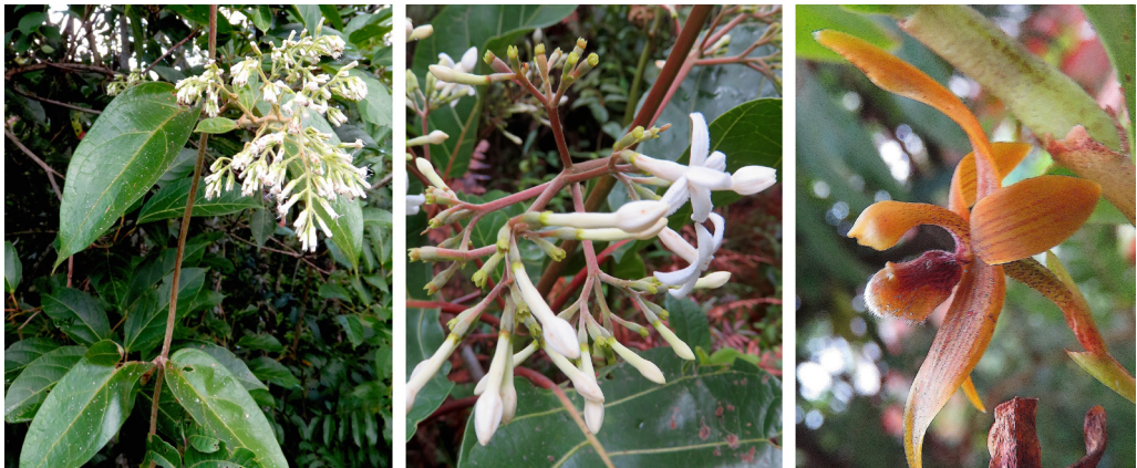
Figura 2. Especies de algunas de las familias con mayor riqueza en el “Sendero Mariposas Alas de Cristal” de la parcelación Señora María Rosa, Cajibío-Cauca. A. Asteraceae: Mikania banisteriae , B. Rubiaceae: Ladenbergia oblongifolia , C. Orchidaceae: Cyrtiorchis frontinoensis .

Se encontraron 100 familias de plantas vasculares representadas por 246 géneros y 346 especies, 18 introducidas y 328 nativas. Los licófitos y monilófitos comprenden 14 familias, 23 géneros y 34 especies; las monocotiledóneas están representadas por 14 familias, 48 géneros y 63 especies, cuatro de ellas introducidas, y finalmente las dicotiledóneas (en sentido amplio) con 72 familias, 175 géneros y 249 especies, 14 de ellas introducidas.