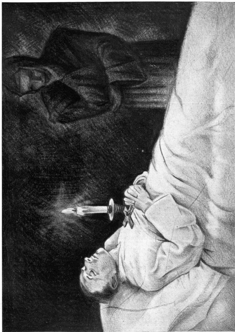
„Halállal őalsz meg.” (Gen. 2, 17.)