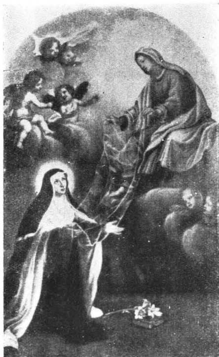
Szűz Mária fehér palástot terít Magdolnára.