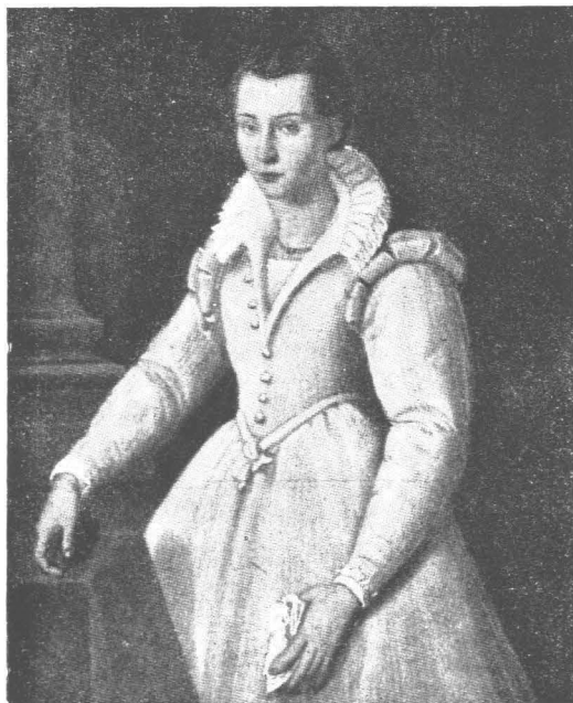
Szent Magdolna 16 éves korában.