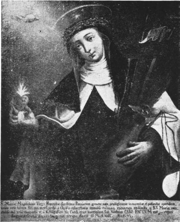
MAGDOLNA A SZENTLÉLEK FÉNYSUGARAIBAN. Kezében Jézus kínzóeszközeinek kötege.