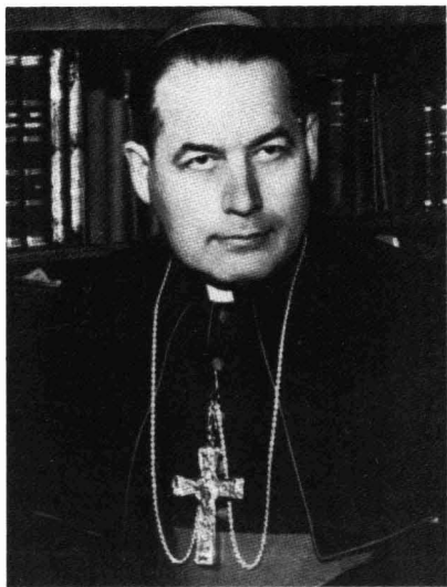
1964 (LERNER FOTÓ)