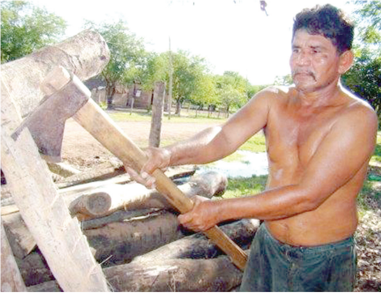
Indígena cayubaba construye su casa.

por qué no decirlo también en el interior del país.