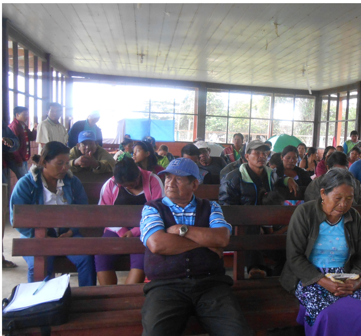
Asamblea del pueblo Cavineño, comunidad Galilea.

En las comunidades Cavineñas se vive con diferentes familias, hay comunidades que son mixtos entre Cavineño y Tacana que tienen su propia cultura pero se adaptan y se comprenden con la cultura Cavineña. Comparten sin discriminación en cualquier actividad sea en fiestas o otras actividades sociales.