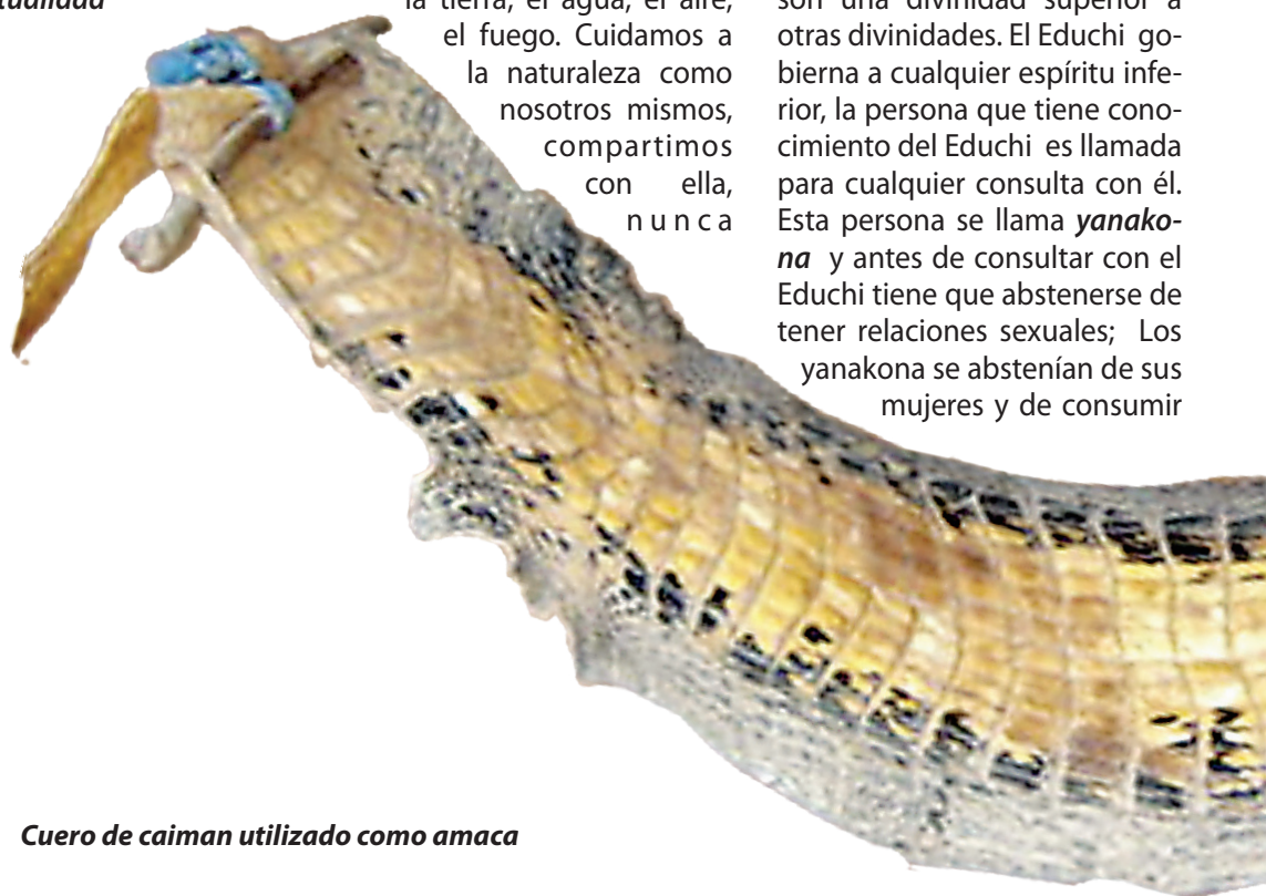
Cuero de caiman utilizado como amaca

Tenemos creencias fundamentalmente desde nuestros ancestros en los Educhis que son una divinidad superior a otras divinidades. El Educhi gobierna a cualquier espíritu inferior, la persona que tiene conocimiento del Educhi es llamada para cualquier consulta con él. Esta persona se llama yanakona y antes de consultar con el Educhi tiene que abstenerse de tener relaciones sexuales; Los yanakona se abstendrían de sus mujeres y de consumir