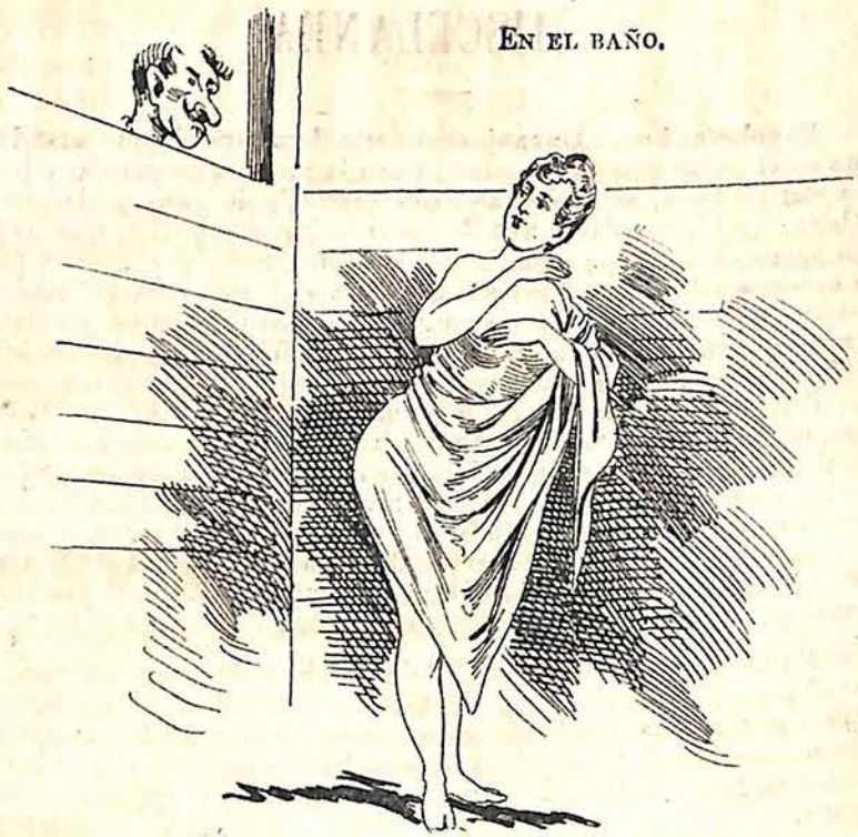
EN EL BAÑO.

—Cuando se marchó Vicente le pedía yo con las lágrimas en los ojos que me escribiera seguido, y ahora me asusto que venga el cartero cuando está aquí Manalito.