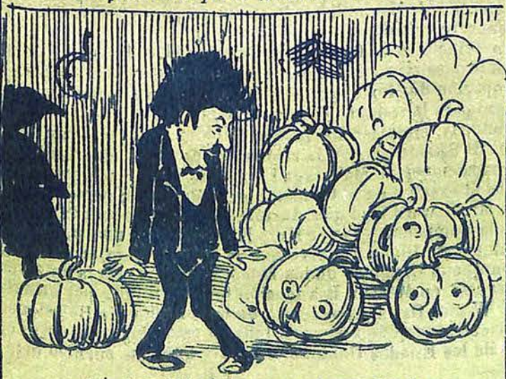
4 - depositándolo en un lugar donde ve con espanto multitud de calaveras,