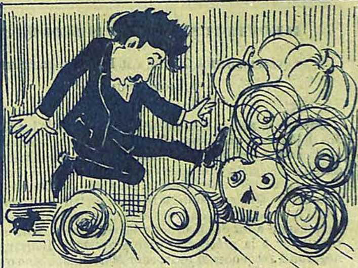
5 - las cuales, al tropezar con él, ruedan por el pavimento, produciendo á don Felipe un pánico terrible.