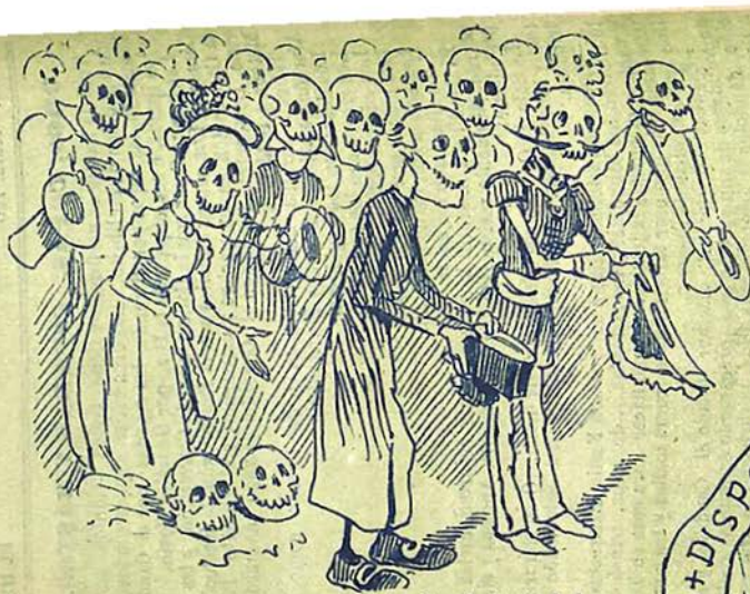
1 — Los 55.699.999 muertos en las calles de la ciudad, desde que la Empresa de los Ferrocarriles es Empresa.