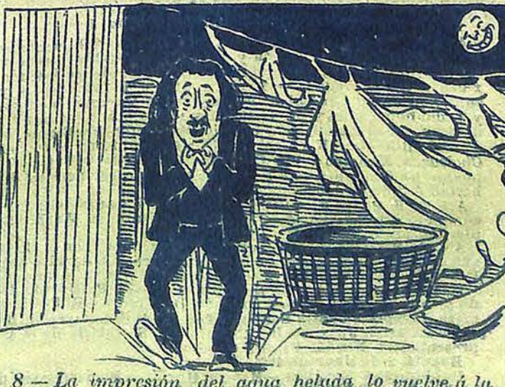
8 - La impresión del agua helada lo vuelve á la realidad, haciéndole reconocer con tristeza que se haya detenido en la casa del Alcalde.