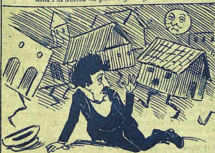
2 - Caído en mitad de la calle contempla con admiración cómo las casas bailan en derredor suyo.