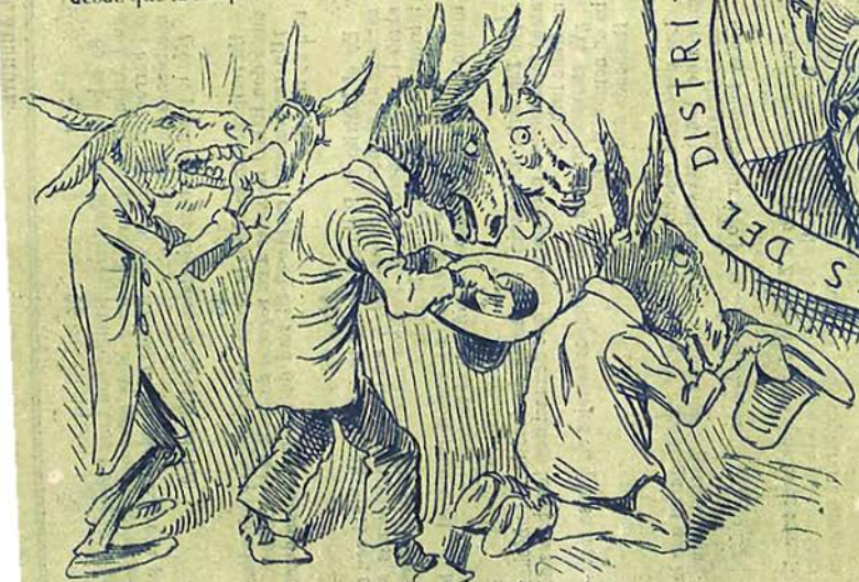
3 — Las 25 mulas que durante 50 años han prestado sus servicios, manteniéndose con medio cuartillo de la botarga naves de alfalfa helada.