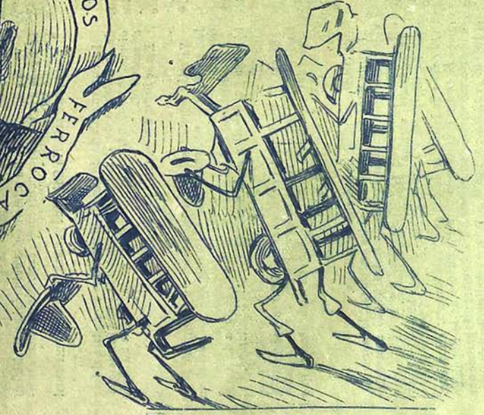
4 — Los carretones viejos que hace 20 años vivían en retiro del...