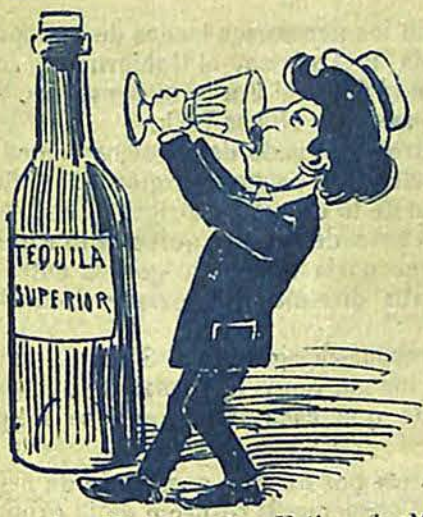
1 - El joven don Felipe de Montenegro de vacaciones en su pueblo natal, toma una PAPALINA de padre y muy señor mío.