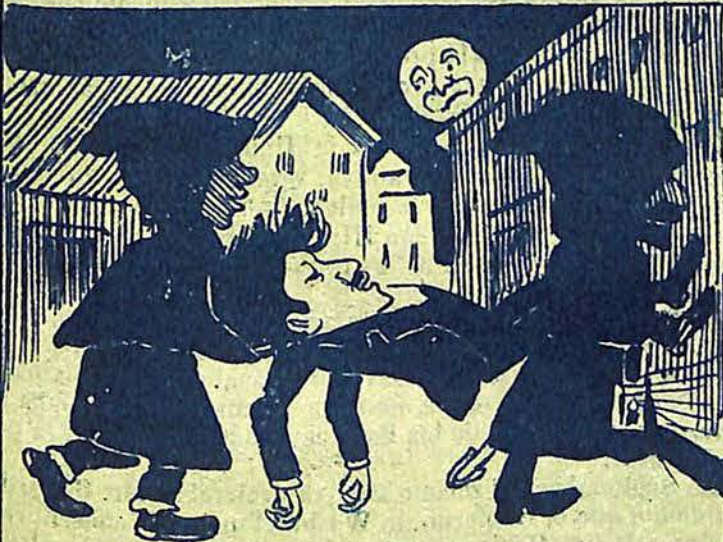
3 - Ve que salen, sin que sepa de dónde, dos encapuchados que lo levantan en brazos,