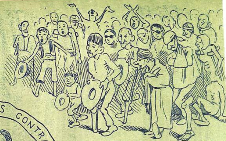
2 — Los 555.999.999 valdados por atropellos de los vagones.