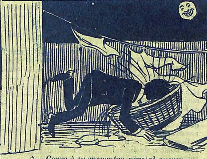
7 - Corre á su encuentro, pero al querer estrecharla entre los suyos . . . . .