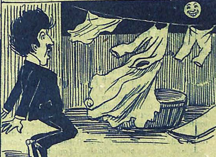
6 - Al salir horrorizado de aquel sitio, una figura blanca y vaporosa le tiende los brazos.