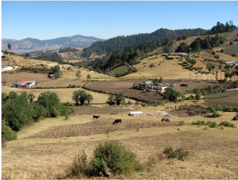
Εικ. 1.5: Αγροτικό τοπίο

Εντούτοις, η τεχνολογία έχει προχωρήσει στο βαθμό ότι οι προσταγές είναι τώρα απολύτως διαφορετικές. Κανένας εμπορικός αγρότης δεν θα συλλογιζόταν σήμερα να κατασκευάσει έναν πέτρινο τοίχο στη θέση ενός φράκτη. Αντί αυτού ο αγρότης που επιλέγει οικονομικά αποδοτική γεωργική πρακτική διαπιστώνει ότι πρέπει να θυσιαστούν πολλά παραδοσιακά χαρακτηριστικά γνωρίσματα τοπίων. Κατά συνέπεια τα πεζούλια πετρών ή γης μπορούν να περιέλθουν σε ερείπωση, που οδηγεί στη διάβρωση και ακόμα και σε απώλεια της δυνατότητας καλλιέργειας. Οι πέτρινοι τοίχοι είναι ακριβοί για να αποκατασταθούν και η γεωργική τους λειτουργία εκτοπίζεται από τον ηλεκτρικό φράκτη. Το τοπίο διαβίωσης, όπως τα κλαδεμένα και ξυλεμένα δέντρα, τα μικρά και ανώμαλα χωράφια, οι αγροτικές δασώδεις περιοχές και διαχωριστικοί φράχτες, ένα διαφορετικό μωσαϊκό των χρήσεων εδάφους, και παραδοσιακά σχέδια περιστροφής, συμπεριλαμβάνοντας την αγρανάπαυση, απειλούνται επίσης από τις εμπορικές πραγματικότητες που αντιμετωπίζει η γεωργία.