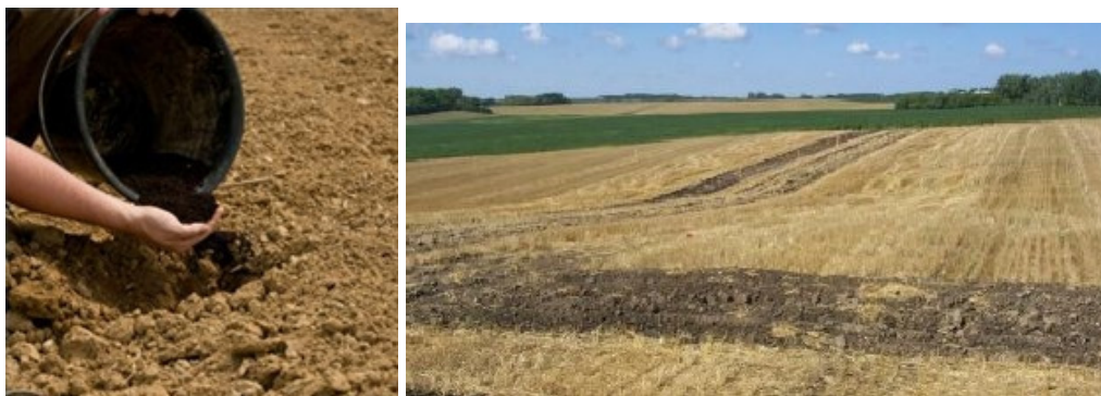
Εικ. 1.7: Έδαφος και αειφορική γεωργία

Η εντατικοποίηση της γεωργίας με στόχο την αύξηση της παραγωγικότητας οδηγεί τους καλλιεργητές στην υπερβάλλουσα χρήση των μέσων παραγωγής, όπως γεωργικά μηχανήματα, άρδευση, χρήση αγροχημικών κ.α. Βασικά προβλήματα υποβάθμισης τους εδάφους είναι η συμπίεση και η καταστροφή της δομής του, η μείωση της γονιμότητας, η αύξηση της αλατότητας και η οξίνιση, η ρύπανση με φυτοφάρμακα και η διάβρωση.