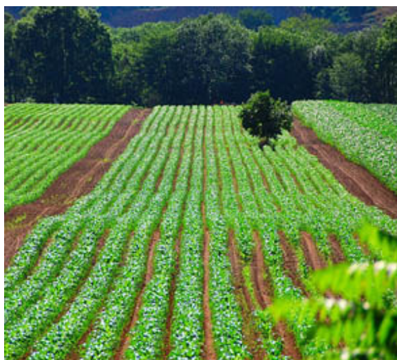
Εικ. 1.4: Γεωργική καλλιέργεια

διατροφικά είδη αποτελούν καθημερινή πραγματικότητα. Η ρύπανση των επιφανειακών νερών μπορεί να έχει δυσμενείς επιπτώσεις σε όλα τα επίπεδα ενός οικοσυστήματος. Μπορεί να προκαλέσει προβλήματα στην υγεία των οργανισμών που βρίσκονται χαμηλά στην τροφική αλυσίδα και, συνεπώς, στη διαθεσιμότητα τροφής στα μεσαία και υψηλότερα στρώματα της τροφικής αλυσίδας. Μπορεί επίσης, να υποβαθμίσει τους υγροτόπους και να περιορίσει τη δυνατότητά τους να υποστηρίξουν τα τοπικά οικοσυστήματα και να ελέγξουν την ποιότητα του νερού της απορροής. Το ρυπασμένο επιφανειακό νερό μπορεί επίσης να έχει επιπτώσεις στην υγεία των ζώων, των ανθρώπων ή των υδρόβιων οργανισμών.