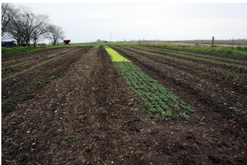
Εικ. 1.6: Αγροτικό τοπίο

Επιλογή περιοχής, είδους και ποικιλίας - Προληπτικές στρατηγικές, που υιοθετούνται νωρίς, μπορούν να μειώσουν τις εισροές και να βοηθήσουν στην καθιέρωση ενός συστήματος αειφορικής παραγωγής. Οπού καθίσταται δυνατό, θα έπρεπε να επιλέγονται καλλιέργειες ανθεκτικές σε εχθρούς και ασθένειες οι οποίες είναι ανεκτικές στο υπάρχον έδαφος ή στις συνθήκες της περιοχής. Όταν υπάρχει η δυνατότητα επιλογής της περιοχής, παράγοντες όπως ο τύπος και το βάθος του εδάφους, οι προηγούμενες καλλιέργειες, και η θέση (π.χ. κλίμα, τοπογραφία) πρέπει να λαμβάνονται υπόψη πριν την καλλιέργεια.