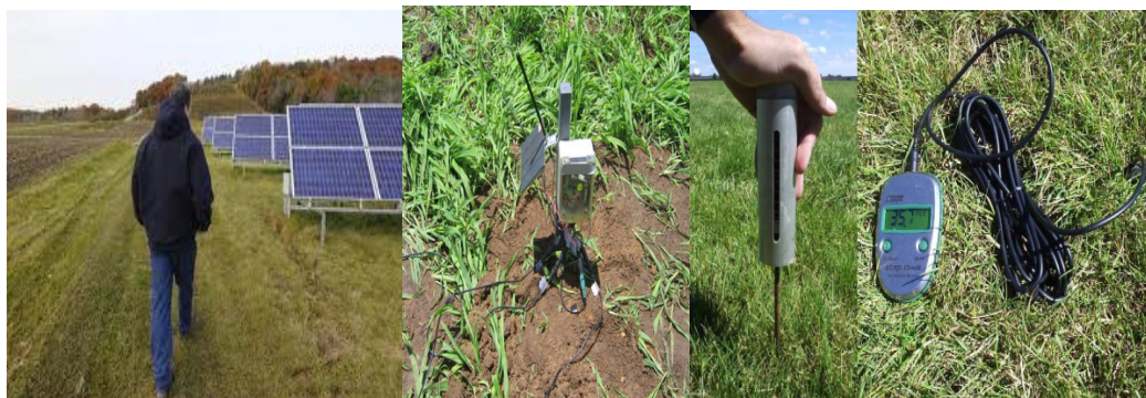
Εικ. 2.1: Ασύρματα δίκτυα αισθητήρων

Όπως ακριβώς η αειφορική γεωργία χρειάζεται γνώσεις πολλών επιστημονικών κλάδων για να υλοποιηθεί, έτσι και η γεωργία ακριβείας προκύπτει ως σύγκλιση διάφορων τεχνολογιών με εφαρμογή σε αρκετές διαχειριστικές πρακτικές. Κάθε τομέας της τεχνολογίας που παρέχει πληροφορίες μικροηλεκτρονική, αισθητήρες, υπολογιστές, τηλεπικοινωνίες είναι μία εξελικτική διαδικασία συνεχούς βελτίωσης.