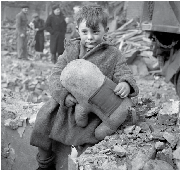
Ffynhonnell D: Plentyn a gafodd ei wneud yn ddigartref ar ôl y bomio. Coventry, 1940.

O ddiwrnod cyntaf un y rhyfel, roedd y llywodraeth wedi cynllunio ar gyfer y bomio difrifol a oedd i'w ddisgwyl. Sefydlwyd unedau Amddiffyn Sifiliaid fel y wardeniaid ARP, y Gwasanaeth Tân Ategol, y canolfannau Cymorth Cyntaf a'r Gwasanaeth Ambiwlans Ategol. Roedd sifiliaid wedi cael cyfarwyddiadau ynglŷn â sut i'w hamddiffyn eu hunain trwy ddefnyddio llochesau cyrch awyr. Y llochesau mwyaf enwog oedd y lloches Anderson, a oedd wedi'i gwneud o ddalenni o fetel wedi'u gosod yn y ddaear a'u gorchuddio â phridd, a'r lloches Morrison, sef blwch mawr dur i'w osod yn y cartref, o dan y grisiau fel arfer. Roedd llochesau cymunedol hefyd