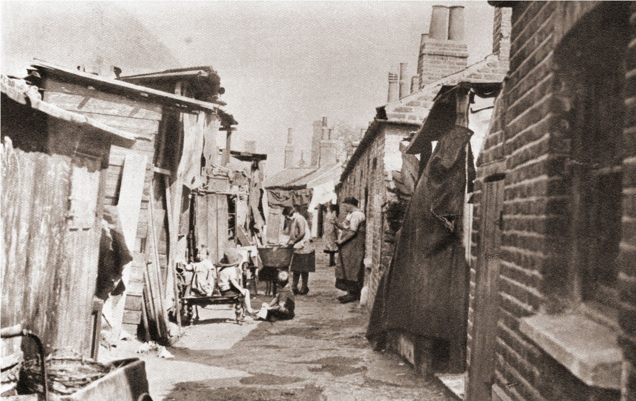
Ffynhonell Ch: Tai slym ym Mhrydain yn y 1930au.

swyddi a grëwyd ganddo, wedi'i leoli yn ne-ddwyrain Lloegr a chanolbarth Lloegr ar y cyfan.