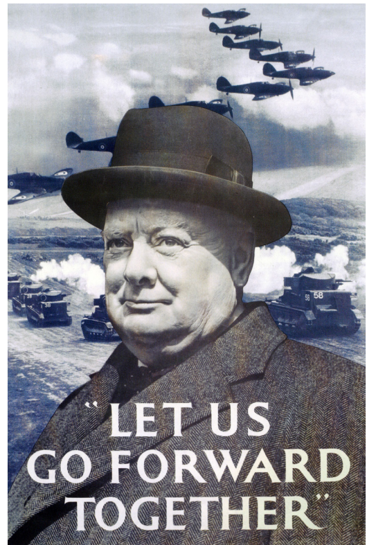
Ffynhonell F: Churchill, arweinydd rhyfel heb ei ail.

Dechreuodd 'Ymgyrch at Fuddugoliaeth' Churchill ym mrwydr El Alamein ym mis Hydref 1942. Roedd dewis Churchill o gadfridog, sef Montgomery, i arwain Byddin Prydain yng Ngogledd Affrica yn llwyddiannus. Trechwyd yr Almaenwyr yn llwyr yn El Alamein ac eto yn Tunisia a Sicilia. Anogwyd cadfridogion y cynghreiriaid gan Churchill i oresgyn yr Eidal ym mis Gorffennaf 1943 a Ffrainc (D-Day) ym mis Mehefin 1944. Fe wnaeth ei waith caled sicrhau bod arweinwyr rhyfel y cynghreiriaid, sef Roosevelt yn UDA a Stalin yn UGSR, yn rhoi eu gwahaniaethau o'r neilltu er mwyn trechu Hitler a'r Almaen.