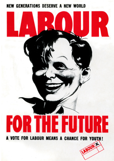
Ffynhonell G: Poster ymgyrchu'r Blaid Lafur.

Ar ôl dod i rym, dechreuodd y llywodraeth Lafur ddelio â 'Chewri Drwg' Beveridge. Canolbwyntiodd ar ddarparu sicrwydd incwm, gwell iechyd, addysg, tai a chyflogaeth lawn. Roedd un o weinidogion pwysicaf y llywodraeth, Aneurin Bevan, yn awyddus i bwysleisio ymrwymiad y llywodraeth Lafur i sefydlu system o lwfansau teuluol ac i sefydlu gwasanaeth iechyd gwladol am ddim. Ei weledigaeth ef oedd gwlad a fyddai'n gofalu am y bobl 'o'r crud i'r bedd'. Wrth gyrraedd y nod hwn, canolbwyntiodd y llywodraeth ar sicrwydd incwm. Yn 1946 roedd Attlee yn falch iawn o gyflwyno diwygiadau cymdeithasol cyntaf y Blaid Lafur. Gan annerch Senedd lawn, cyhoeddodd, 'Mae'r Bil hwn yn seiliedig ar Adroddiad Beveridge.' Dyma'r Ddeddf Yswiriant Gwladol. Roedd y ddeddf yn rhoi budd-daliadau i fenywod beichiog a phobl ddi-waith,