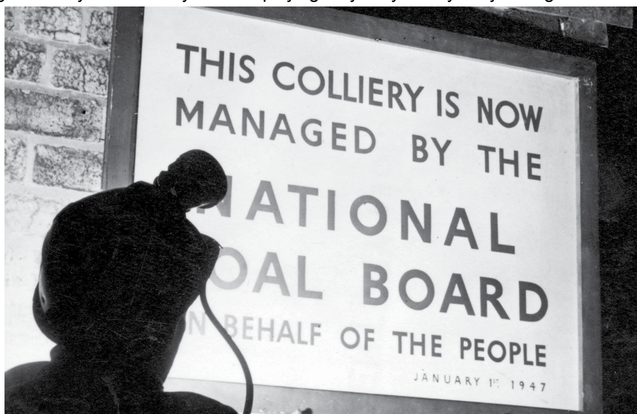
Ffynhonell J: Y diwydiant glo mewn dwylo cyhoeddus . . . 'ar ran y bobl'.

Mae'n bosibl gweld y problemau a oedd yn wynebu'r llywodraeth wrth iddi geisio gwladoli cynifer o ddiwydiannau pwysig trwy edrych ar y diwydiant glo. Yn 1947