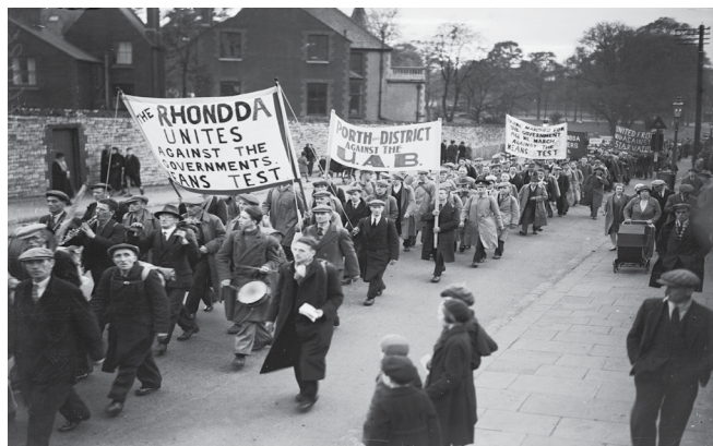
Ffynhonell B: Gweithwyr di-waith yn gorymdeithio trwy Fryste yn 1931.

Rhoddwyd cynnig ar gynifer o atebion, heb lwyddiant. Mae De Cymru yn ein diflasu. Mae fel babi'n crio yn nwylo mam anwybodus. Mae un o adrannau'r llywodraeth yn ei bwrw, ac un arall yn ei chusanu. Pam nad aiff i gysgu fel Swydd Dorset? 5