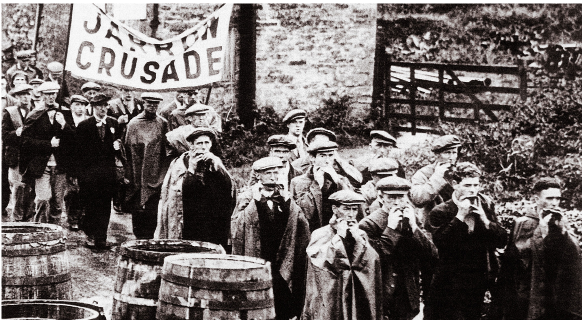
Ffynhonell C: Gorymdeithwyr Jarrow ar y ffordd i Lundain.

Ym mis Hydref 1932, gorymdeithiodd 2,500 o weithwyr o bob cwr i Lundain. Chwaraeodd undebwyr llafur rôl enfawr wrth drefnu'r orymdaith a threfnu bwyd a llety ar gyfer y gorymdeithwyr. Cafodd deiseb ei chyflwyno gerbron y Senedd yn mynnu dileu'r prawf modd ac yn protestio am y toriad o 10% i fudd-daliadau. Efallai mai'r orymdaith brotest enwocaf oedd Crwsâd Jarrow 1936, ond roedd gorymdeithiau o dde Cymru hefyd. Roedd y rhan fwyaf yn mynnu pethau tebyg – roedden nhw am weld y llywodraeth yn gweithredu trwy greu swyddi, ac am sicrhau gwell budd-daliadau ar gyfer y di-waith.