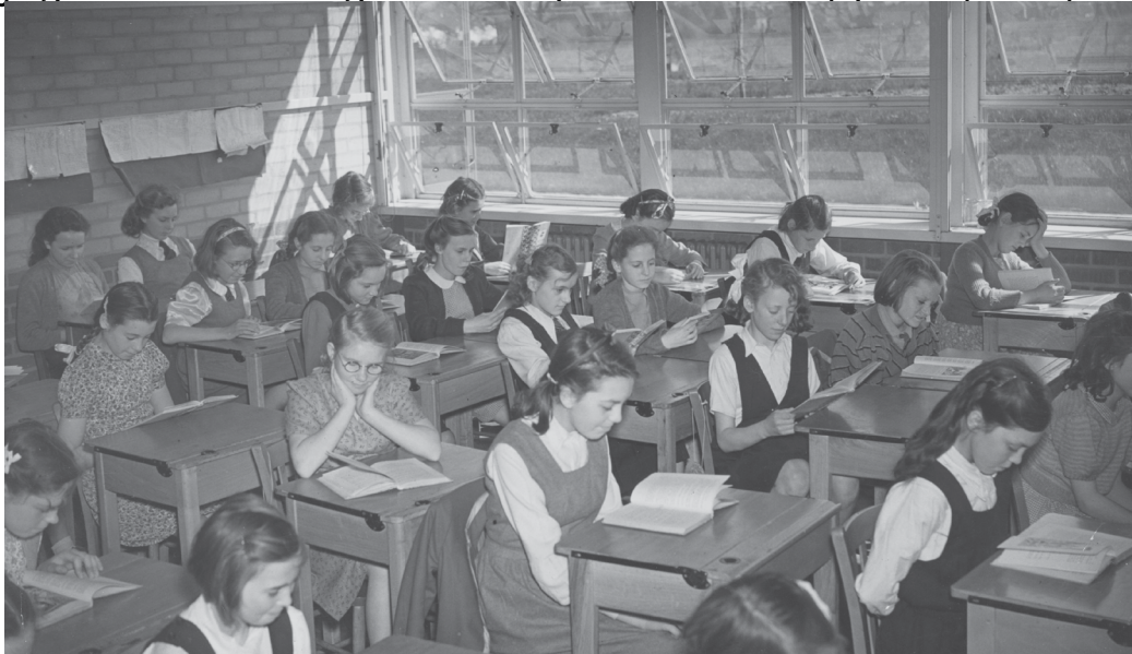
Ffynhonell I: Roedd merched Ysgol Eilradd Fodern Bourne, Ruislip, swydd Middlesex, ymhlith y disgyblion cyntaf i elwa ar y ddeddf addysg newydd.

y llywodraeth yn benderfynol o ofalu am anghenion aelodau tlotaf y gymdeithas, roedd yn cyfyngu ar adeiladu a gwerthu tai preifat. Roedd y polisi yn llwyddiannus