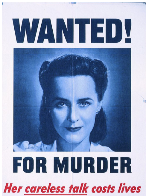
Ffynhonnell E: Poster propaganda. Flickr Creative Commons http://bit.ly/2u8P5uu

Roedd y llywodraeth yn defnyddio'r cyfryngau a phropaganda i ddylanwadu ar feddylfryd y cyhoedd ym Mhrydain, ond roedd yn defnyddio ymgyrchoedd ac apeliadau i wneud i'r bobl deimlo eu bod wir yn gwneud rhywbeth ar gyfer ymdrech y rhyfel. Y dyn a oedd yn bennaf gyfrifol am wthio'r syniad o ymgyrchoedd ac apeliadau i gefnogi ymdrech y rhyfel oedd yr Arglwydd Beaverbrook, sef perchennog papur newydd a dyn busnes Prydeinig o Ganada. Yn 1940, roedd wedi cael ei alw i'r llywodraeth gan Churchill fel Gweinidog Cynhyrchu Awyrennau. Un o'i ymgyrchoedd mwyaf llwyddiannus oedd y Gronfa Spitfire, a wnaeth gipio dychymyg y bobl gyda phosteri propaganda fel yr un a ddangosir.