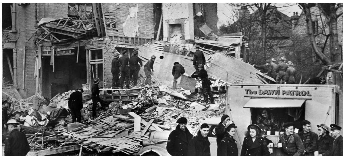
Ffynhonnell Ff: Canlyniad ymgyrch fomio'r Almaen. Roedd rhaid ailadeiladu neu atgyweirio'r tai hyn ar ôl y rhyfel..

Cynyddodd y galw am gartrefi fforddiadwy yn sylweddol yn y cyfnod rhwng 1945 ac 1947 gan fod milwyr yn dychwelyd adref. Yn 1945 roedd dros bum miliwn o ddynion a menywod ym Myddin Prydain, yn y Llynges Frenhinol a'r Llu Awyr Brenhinol. Roedd y rhan fwyaf wedi cael eu consgriptio i wasanaethu am gyfnod y rhyfel yn unig, ac roedden nhw bellach am ddychwelyd adref. Dechreuwyd dadfyddino o fewn chwe wythnos i ddiwedd y rhyfel. Ernest Bevin, y Gweinidog Llafur a Gwasanaeth Cenedlaethol, a ddewiswyd i fod yn gyfrifol am y cynllun dadfyddino. Byddai mwyafrif y milwyr, yn ddynion a menywod, yn cael eu rhyddhau o'r lluoedd arfog yn ôl 'eu rhif oedran a gwasanaeth' (a gyfrifwyd yn ôl eu hoedran a sawl mis yr oedden nhw wedi gwasanaethu mewn gwisg filwrol). I gynorthwyo'r broses o ailadeiladu Prydain ar ôl y rhyfel, gwnaeth Bevin restr o 'ddynion allweddol' yr oedd eu sgiliau galwedigaethol hanfodol yn eu galluogi i gael eu rhyddhau cyn eu tro. Gan fod sefyllfa economaidd y wlad yn wan, teimlwyd y byddai lleihau maint y lluoedd arfog yn arbed arian i'r llywodraeth. Gan fod