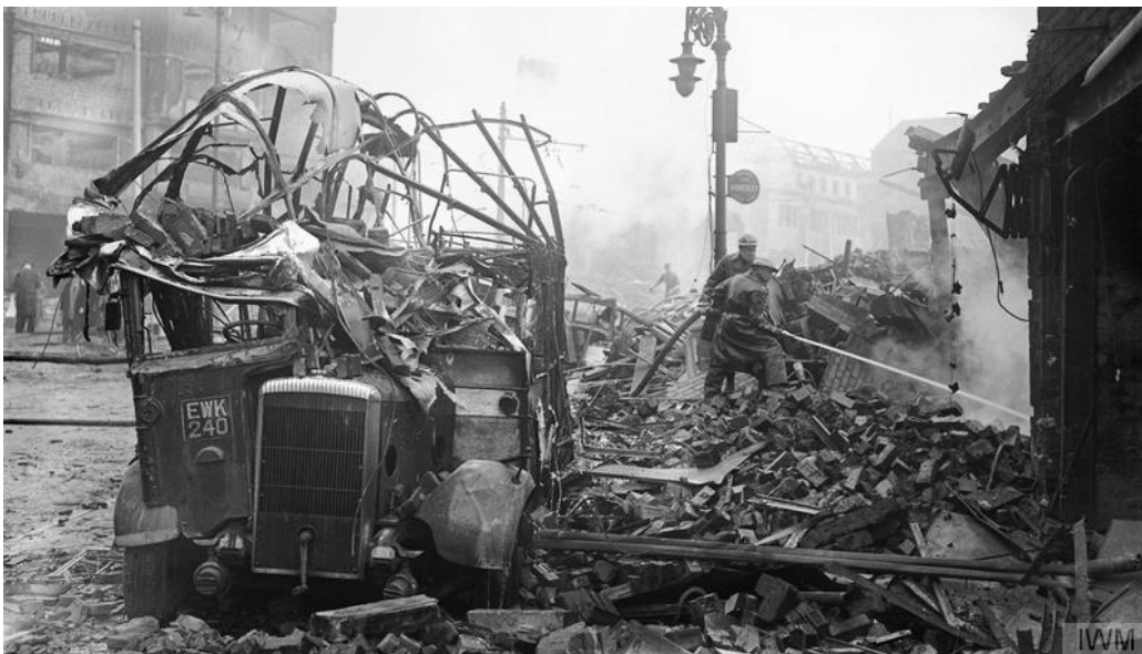
Ffynhonnell Dd: Pobl yn cerdded i'r gwaith heibio i bentyrrau o rwbel sy'n mudlogi ar ôl cyrch bomio. Coventry, 1940.

I ddechrau, roedd y bomio nos parhaus ar ddinasoedd Prydain, a'r anafiadau difrifol a'r marwolaethau a achosir gan hyn, yn effeithio ar ysbryd y bobl. Yn Lloegr, un o'r dinasoedd a fomiwyd waethaf oedd Coventry. Daeth cyrch enwog 14 Tachwedd 1940 â'r ddinas i stop. Gollyngodd 500 o awyrennau bomio'r Almaen 500 tunnell o ffrwydradau a bron 900 o fomiau tân ar y ddinas mewn deg awr o fomio di-baid. Daily Mirror, 9 Medi 1940, t.1.