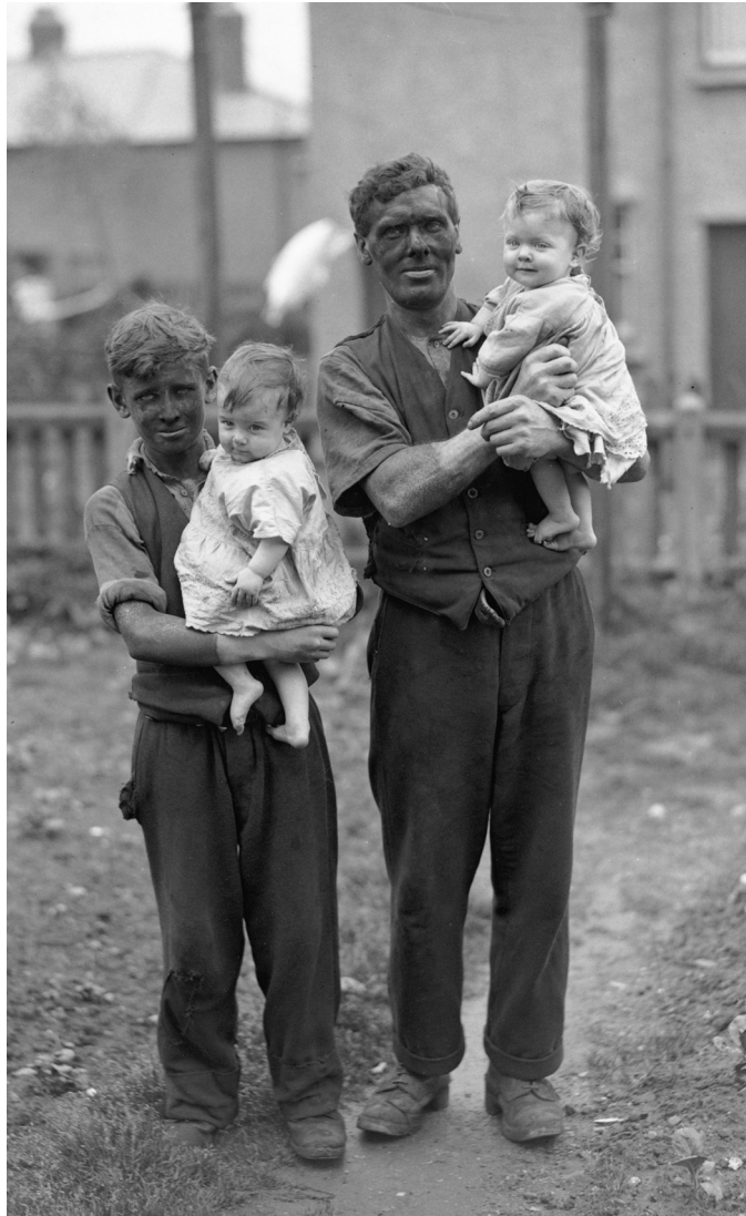
Ffynhonnell A: Glöwr a'i deulu, cwm Rhondda, 1931, cyn i ddiweithdra ar raddfa fawr ddod i'r cwm.

Un o brif effeithiau'r cwmp byd-eang mewn masnach a chynhyrchiant diwydiannol oedd y cynnydd aruthrol mewn diweithdra. Erbyn 1933 roedd dros 30 miliwn o bobl ledled y byd yn ddi-waith, tua 3 miliwn ym Mhrydain, tua 13 miliwn yn America a 6 miliwn yn yr Almaen. Yr ardaloedd a ddioddefodd waethaf oedd y rhai a oedd yn dal i ddibynnu ar yr hen ddiwydiannau trwm. Y ddwy ardal ym Mhrydain a deimlodd yr effaith waethaf, felly, oedd de Cymru a gogledd-ddwyrain Lloegr. Erbyn 1938 roedd y gyfradd ddiweithdra ym mhob un o'r pedwar diwydiant trwm sylfaenol, sef glo, cotwm, adeiladu llongau a dur ddwywaith cyfraddau diweithdra swyddi eraill. Yn yr ardaloedd hyn, ac yn y diwydiannau hyn, daeth diweithdra yn ffordd o fyw.