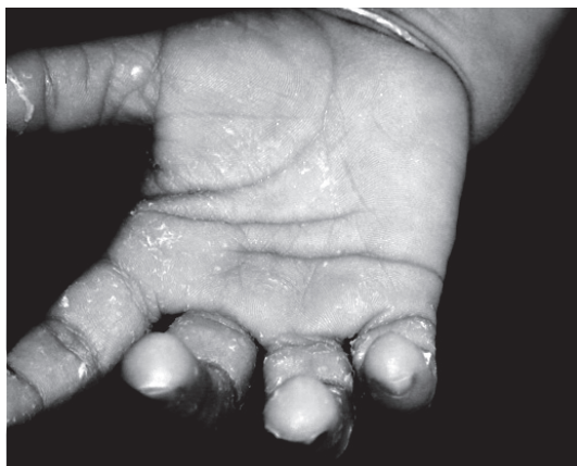
Hg: cuadro de Acrodinia.