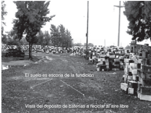
Depósito de baterías al aire libre en una fundición de plomo.