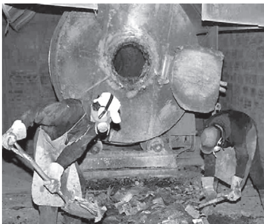
Dos trabajadores cargando un crisol con placas de baterías.