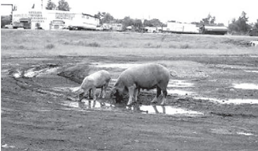
Animales comiendo y tomando agua en sitios contaminados con plomo.