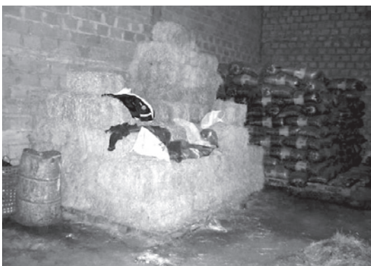
Comida para animales dentro de la fundición de plomo.