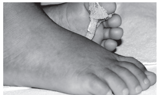
Hg: cuadro de Acrodinia.