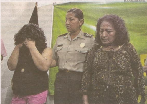
► A PRISIÓN. Detenidas serán procesadas por el delito de trata de personas.

► Captarían a mujeres gestantes de bajos recursos para ofrecerles dinero por sus criaturas.