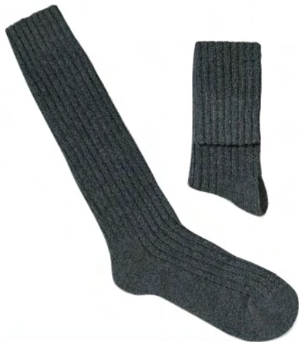
613.001 CHAUSSETTES la paire de chaussettes coton bouclette