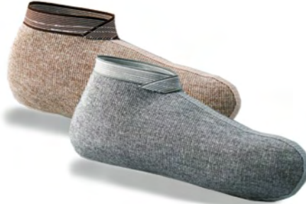
611.001 CHAUSSONS 399 la paire 611.002 CHAUSSONS 313 la paire