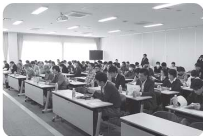
セミナー風景：参加者は熱心に講師のお話を聞き、一生懸命メモを取っていました。