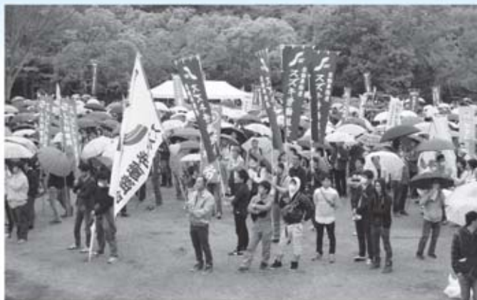
連合静岡浜松地協メーデー 会場の浜松城公園では小雨がバラつく中、多くの働く仲間が集結いたしました