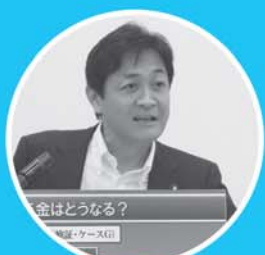
国民民主党玉木代表

Q.老後2,000万円必要だとニュースで聞きました。少子高齢化が進む中で、将来に不安があります。年金制度はどう変わっていきますか？