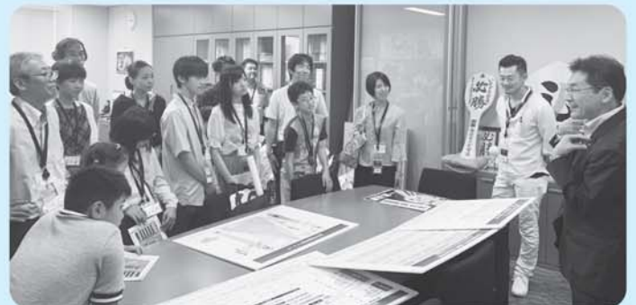
いそぎ事務所訪問