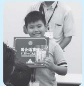
親子国会見学風景