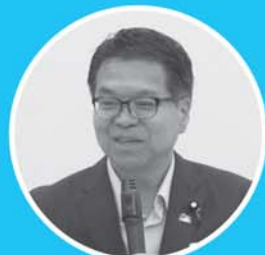
はまぐち誠参議院議員

A.私は三重県松阪市出身で若い時は良く釣りに行っていました。今は残念ながらほとんど行けていません。