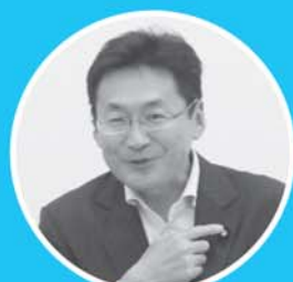
いそざき哲史参議院議員

A.本会議場には、必ず上着の着用と、議員バッジがないと総理大臣でも入ることが出来ません。議員会館は顔パスで入れます。