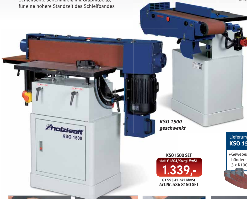
KSO 1500 geschwenkt

bestehend aus: 4x K80 Gewebesleifband 3x K100 Gewebesleifband 3x K120 Gewebesleifband