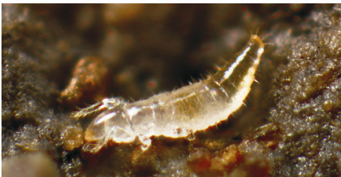
Lámina I: Dos ejemplos de Protura, © Andy Murray, procedente de www.Flickr.com (con licencia Creative Commons).

Las patas presentan los siguientes artejos: coxa , trocánter , fémur , tibia , tarsos uniaarticulados y una uña final o pretarso . La quetotaxia de los tarsos es importante y suelen usarse letras griegas para cada una de caras del mismo (dorsal, ventral, exterior e interior).