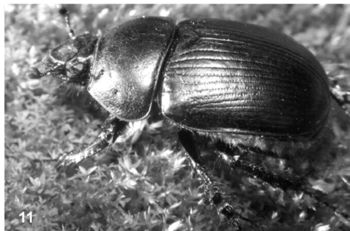
Fig. 8. Habitus de Bolboceras armiger (Scopoli, 1772), representante de Bolboceratinae (fotografía del autor, debida a la cortesía del Dr. Pablo Bahillo de la Puebla; ejemplar depositado en las Colecciones de Entomología del Museo Nacional de Ciencias Naturales, de Madrid). Fig. 9. Habitus de Typhaeus typhoeus (Linnaeus, 1758), representante de Geotrupinae Chromogeotrupini (fotografía del autor). Fig. 10. Habitus de Geotrupes mutator Marsham, 1802, representante de Geotrupinae Geotrupini (fotografía cortesía del Dr. Pablo Bahillo de la Puebla, incluida en la publicación: Bahillo De La Puebla et al. , 2003). Fig. 11. Habitus de Geotrupes puncticollis Malinowsky, 1811, representante de Geotrupinae Geotrupini (fotografía cortesía del Dr. Pablo Bahillo de la Puebla, incluida en la publicación: Bahillo De La Puebla et al. , 2003). Fig. 12. Habitus de Jekelius catalonicus (López-Colón, 1991) ( holotypus ), representante de Geotrupinae Geotrupini (fotografía cortesía de la Dra. Isabel Izquierdo y la Dra. Carolina Martín, Conservadoras de las Colecciones de Entomología del Museo Nacional de Ciencias Naturales, de Madrid). Fig. 13. Habitus de Lethrus (Lethrus) apterus (Laxmann, 1770), representante de Lethrinae (fotografía del autor).