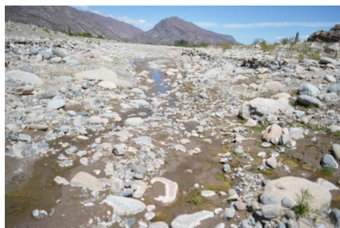
Figura 5. Ambiente de Trichomycterus alterus , río Bolsón, Barranca Larga, Departamento Belén, Catamarca, Argentina.