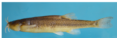
Figura 4. Trichomycterus alterus , FACEN 119, 43.5 mm LE, capturado en río Fiambalá, Departamento Tinogasta, Catamarca, Argentina.

Material examinado: FACEN 126, 7 ejemplares, 22.6-37.7 mm LE, río Bolsón, Barranca Larga, Departamento Belén, Catamarca, 26°57'30.71"