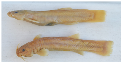
Figura 1. Trichomycterus rivulatus , FACEN 102, 42.6-56.7 mm LE, capturado en río Santa Catalina, Departamento Santa Catalina, Provincia de Jujuy, Argentina.