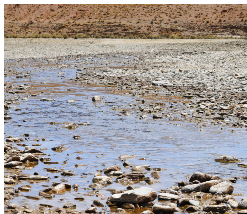
Figura 3. Ambiente de Trichomycterus rivulatus , río Santa Catalina, cerca del límite con Bolivia, Departamento Santa Catalina, Jujuy, Argentina.

Figure 2. Sample sites of Trichomycterus : T. rivulatus : new record for Argentina (black circle); T. roigi : new localities (red circles) and confirmed localities (light blue circles); T. alterus : new localities (yellow circles) and confirmed localities (orange circles).