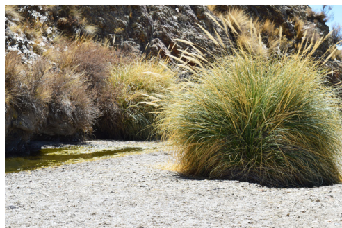
Figura 7. Ambiente de Trichomycterus rogi , río Cieneguilla, Departamento Santa Catalina, Jujuy, Argentina.