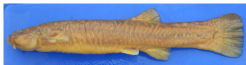
Figura 6. Trichomycterus roigi , FACEN 112, 41.5 mm LE, capturado en río Volcán Granada, Departamento Susque, Jujuy, Argentina.

Material examinado: FACEN 112, 8 ejemplares, 40.5-94.5 mm LE, arroyo cerca del Volcán Granada, Departamento Rinconada, Jujuy, 22°35' 34.93" S, 66°35' 18.58" O, 4.610 m s.n.m., 18 Dic 2009, L. Fernandez y F. Lobo; FACEN 113, 1 ejemplar (tejido), 32.5 mm LE, Arroyo cerca del Volcán Tuzgle, Departamento Susques, Jujuy, 24°5' 6.73" S 66°25' 44.31" O, 4.304 m s.n.m., 25 Oct 2016, H. Fernandez y N. Vargas; FACEN