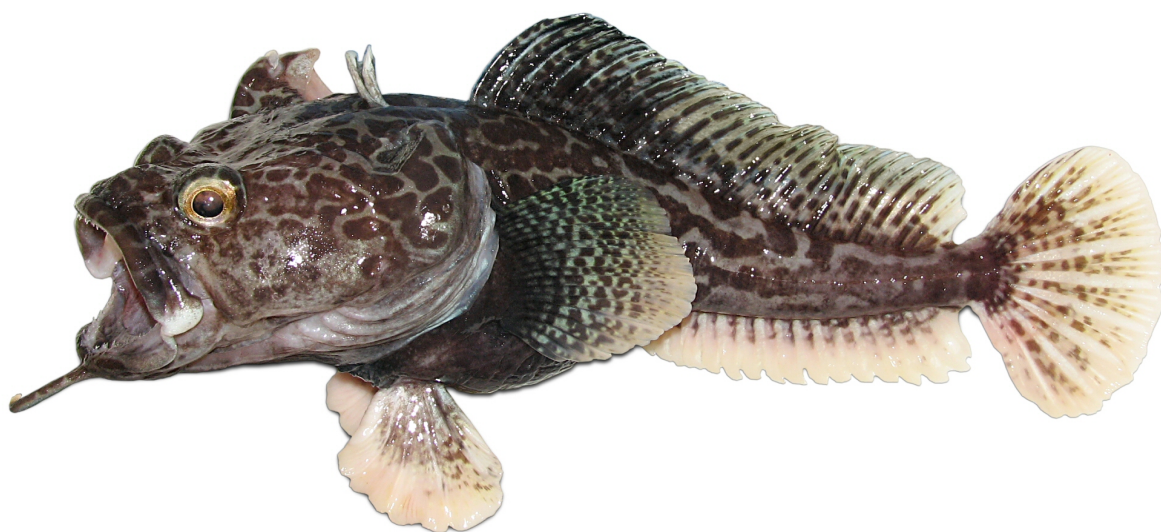
Рис. 9. P. tronio , голотип (МПХНУ Р295), самец, 290 мм TL, 234 мм SL, море Росса Fig. 9. P. tronio , holotype (MNKhNU R295), male, 290 mm TL, 234 mm SL, Ross Sea

4с. Подбородочный усик (13% SL) тонкий, двуцветный, с кремовым (у фиксированных рыб) терминальным расширением и светлым стеблем, покрытым в базальной половине темными пятнами; терминальное расширение закругленное на конце, очень короткое (около 16% длины усика), слабо выраженное, едва шире прилегающей части стебля, образованное короткими пальцевидными отростками; общая окраска тела светлая; верх головы покрыт четкими, преимущественно округлыми темными пятнами; затылок и спина перед первым спинным плавником без пятен; второй спинной плавник у самцов пестрый, очень низкий (около 14% SL), без передней лопасти. Глубоководный вид,