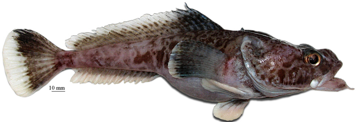
Рис. 5. P. barsukovi , самка, 270 мм TL, 222 мм SL, море Росса Fig. 5. P. barsukovi , female, 270 mm TL, 222 mm SL, Ross Sea

2a. Нижняя поверхность головы, грудь, живот и основания грудных плавников покрыты относительно крупными, контрастными тёмными пятнами; подбородочный усик (9,8–12,9 % SL) толстый и двуцветный, с крупными, контрастными темными пятнами на светлом стебле, часто довольно густо покрытом папиллами, и светлым, длинным (50–66 % длины усика), кустистым терминальным расширением, образованным длинными, тонкими, заостренными на вершине, неветвящимися и ветвящимися отрезками; вершина нижней челюсти заострена или более или менее закругленная, заметно выдается вперед; при закрытом рте обнажены все ряды зубов на симфизе и часто передний края языка; второй спинной плавник у взрослых самцов пестрый и умеренно высокий (до 22% SL), с небольшой передней лопастью. Прибрежный вид, известный с глубин 247–460 м в морях Уэдделла и Космонавтов; достигает общей длины 260 мм (214 мм SL) (рис. 6) . . . . . . . . . . пятнистобрюхая бородатка P. ventrimaculata Eakin, 1987