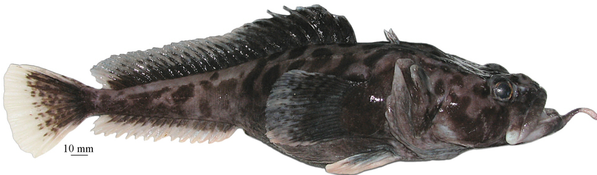
Рис. 7. P. brevibarbata , самка (МПХНУ P298), 325 мм TL, 262 мм SL, море Росса Fig. 7. P. brevibarbata , female (MNKХНУ R298), 325 mm TL, 262 mm SL, Ross Sea

..... хмелеусая бородатка P. neyelovi Shandikov et Eakin, 2013