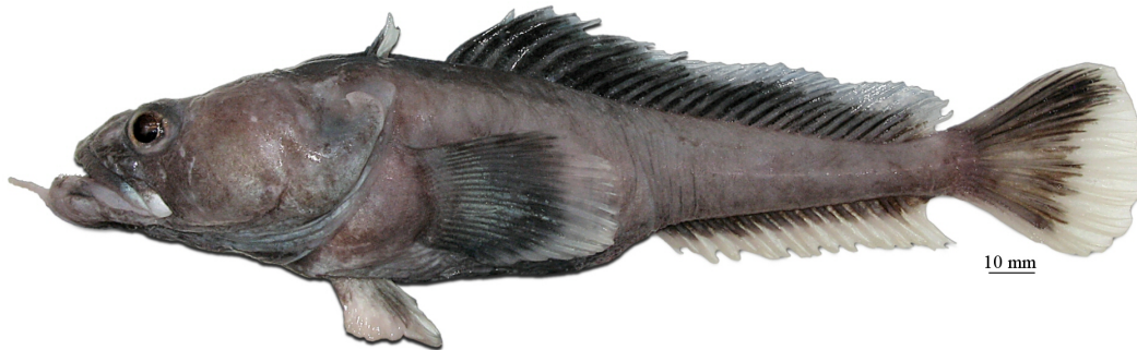
Рис. 1. P. immaculata , самка, 250 мм TL, 202 мм SL, море Росса Fig. 1. P. immaculata , female, 250 mm TL, 202 mm SL, Ross Sea

2a. Подбородочный усик, если имеется, очень короткий (2–9 % SL), белого цвета, притупленный на кончике; общая окраска тела у живых рыб однотонно-сероватая или слегка коричневатая с розоватым оттенком; плавники отчетливо двуцветные: темные или черноватые у основания и светлые или белые у внешнего края; верхний профиль головы выпуклый; голова у посттемпоральных гребней относительно высокая (не менее 20% SL); в срединной боковой линии 12–29 (обычно 16–29) пор; второй спинной плавник у взрослых самцов с высокой (23–27 % SL) черной передней лопастью. Глубоководный вид, известный с глубин 800–2542 м от Южных Оркнейских островов и из моря Росса; достигает общей длины 268 мм (209 мм SL) (рис. 1) ..... ..... непятнистая бородатка P. immaculata Eakin, 1981