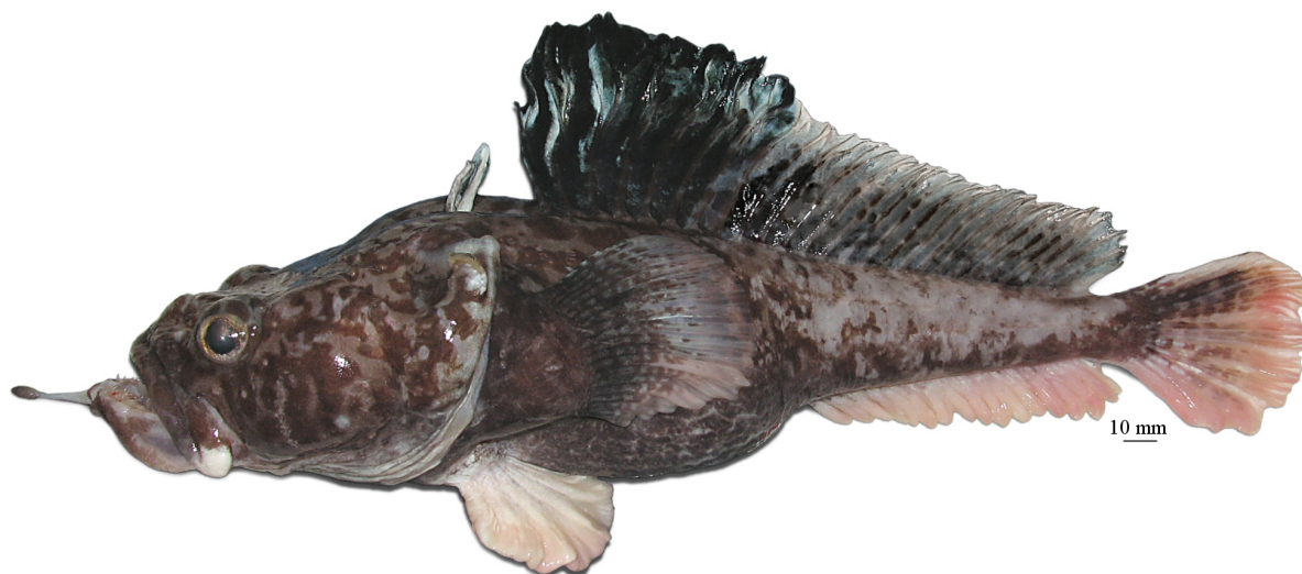
Рис. 8. P. neyelovi , голотип (МПХНУ Р299), самец, 355 мм TL, 295 мм SL, море Росса Fig. 8. P. neyelovi , holotype (MNKhNU R299), male, 355 mm TL, 295 mm SL, Ross Sea

налегающими друг на друга чешуевидными придатками с фестончатыми верхними краями; общая окраска тела светлая; верх головы, затылок и спина перед первым спинным плавником покрыты четкими, главным образом округлыми темными пятнами. Прибрежный вид, известный лишь по голотипу (молодому самцу, 147 мм SL), пойманному на глубине 651–742 м у Земли Королевы Мод (Индоокеанский сектор) . . . . чешуйчатая бородачка P. squamibarbata Eakin et Balushkin, 2000