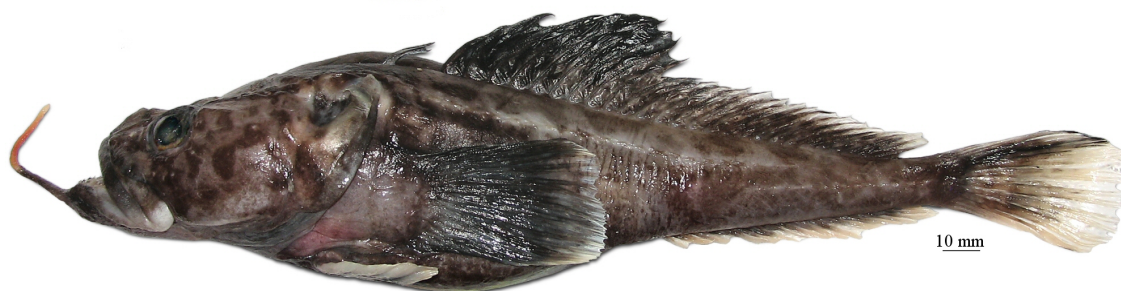
Рис. 11. P. sp. D , самец, 276 мм TL, 224 мм SL, море Амундсена Fig. 11. P. sp. D , male, 276 mm TL, 224 mm SL, Amundsen Sea

6. Подбородочный усик (20–27 % SL) со стеблем, имеющим нечеткую темную пятнистость, и оранжевым (у живых рыб) терминальным расширением, образованным простыми или иногда слабо ветвящимися, очень короткими пальцевидными отростками; темные пятна на голове, затылке и спине перед первым спинным плавником немногочисленные, средние по размеру, более или менее округлые или нечеткие; вершина нижней челюсти угловидно-заостренная и заметно выдается вперед; при закрытом рте зубы на симфизе обнажены. Прибрежный вид, известный по четырем экземплярам (самке: 203 мм TL, 164 мм SL и трем ювенильным особям: 63 мм, 92 мм и 106 мм SL), пойманном на глубине 423–666 м в море Уэдделла . . . . . оранжевоусая бородатка P. orangei Eakin et Balushkin, 1998