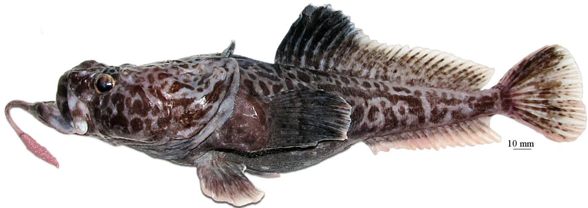
Рис. 13. P. sp. F , самец, 324 мм TL, 257 мм SL, море Росса Fig. 13. P. sp. F , male, 324 mm TL, 257 mm SL, Ross Sea