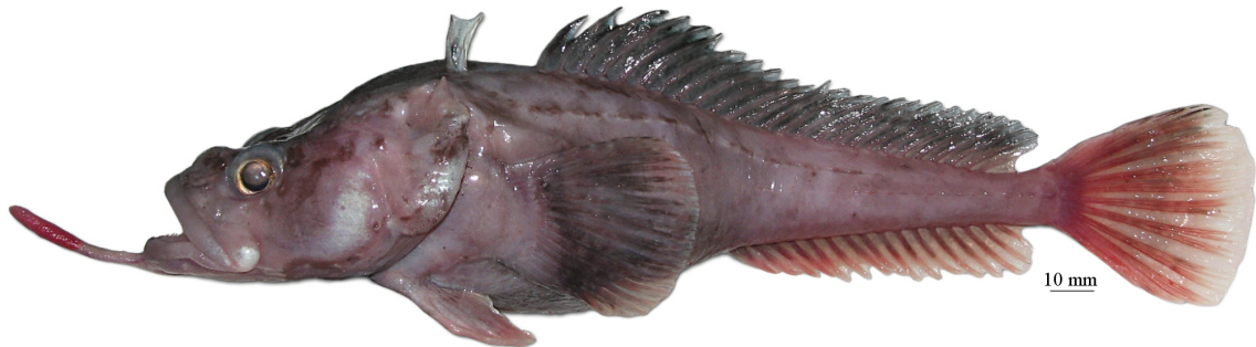
Рис. 2. P. sp. A , самка, 252 мм TL, 200 мм SL, море Амундсена Fig. 2. P. sp. A , female, 252 mm TL, 200 mm SL, Amundsen Sea

общая окраска тела у живых рыб розовая, вокруг пор сейсмодатчиков головы едва видны нечеткие более темные участки. Глубоководный вид, известный по единственной взрослой самке общей длиной 252 мм (200 мм SL), пойманной на глубине около 1000 м в море Амундсена (рис. 2) . . . . . P. sp. A