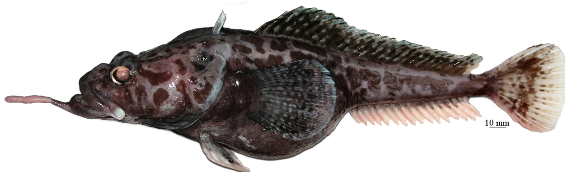
Рис. 12. P. sp. E , самка, 286 мм TL, 224 мм SL, море Амундсена Fig. 12. P. sp. E , female, 286 mm TL, 224 mm SL, Amundsen Sea