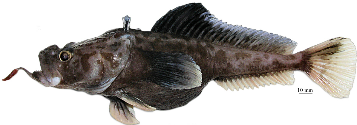
Рис. 10. P. sp. C , самец, 260 мм TL, 208 мм SL, море Росса Fig. 10. P. sp. C , male, 260 mm TL, 208 mm SL, Ross Sea

известный лишь по голотипу (самцу: 234 мм TL, 197 мм SL), пойманному на глубине 1947 м в море Беллинсгаузена . . . . . лысая бородатка P. bellingshausenensis Eakin, Eastman et Matallanas, 2008 4d. Подбородочный усик более или менее утолщенный, контрастно двуцветный, с ярко-красным (выцветающим до светлого у фиксированных рыб) терминальным расширением и темным стеблем; терминальное расширение умеренной длины (менее 50% длины усика), заметно более широкое, чем прилегающая часть стебля; общая окраска тела светло-коричневая; верх головы, затылок и спина перед первым спинным плавником покрыты четкими, преимущественно округлыми темными пятнами; второй спинной плавник у взрослых самцов черный в передней части, умеренно высокий (до 22% SL), с небольшой передней лопастью. Глубоководный вид, известный по двум экземплярам общей длиной до 300 мм (250 мм SL), пойманным на глубине 1090–1470 м в море Росса (рис. 10) . . . . . P. sp. C