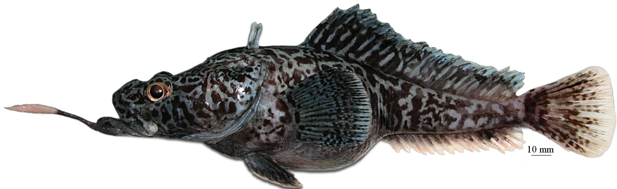
Рис. 14. P. sp. G , самец, 250 мм TL, 203 мм SL, море Амундсена Fig. 14. P. sp. G , male, 250 mm TL, 203 mm SL, Amundsen Sea