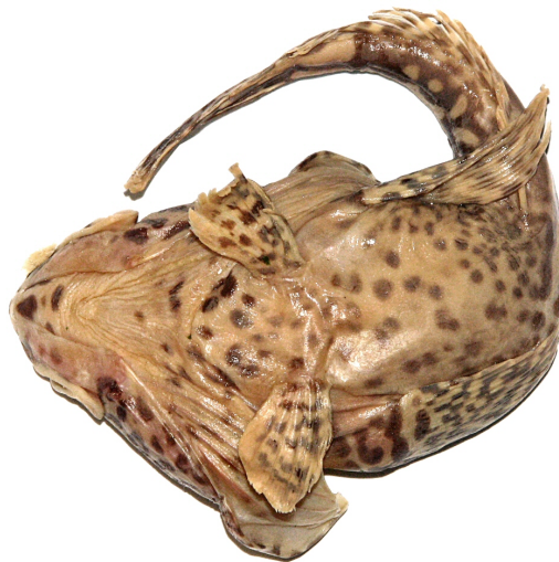
Рис. 6. P. ventrimaculata (формалин), вид снизу, 195 мм TL, 141 мм SL, Море Космонавтов Fig. 6. P. ventrimaculata (formalin), ventral view, 195 mm TL, 141 mm SL, Cosmonauts Sea

2b. Нижняя поверхность головы, грудь, живот и основания грудных плавников окрашены однотонно, без контрастных тёмных пятен; подбородочный усик (8–12 % SL) тонкий и часто двуцветный, с едва выраженным в ширину терминальным расширением или без него; вершина нижней челюсти более или менее закругленная, умеренно или слабо выдается вперед; при закрытом рте могут быть обнажены передние ряды зубов на симфизе и нижнечелюстная дыхательная перепонка . . . . . 3