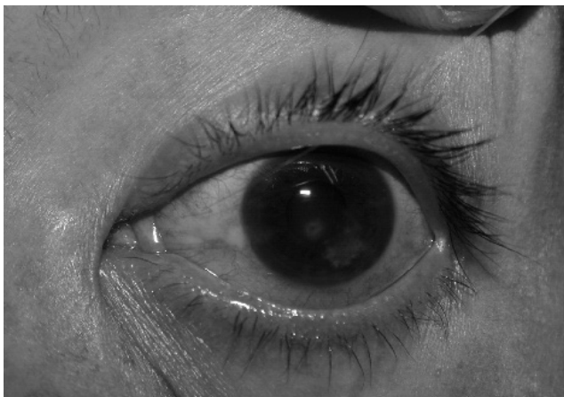
Fig. 1. Queratitis ulcerativa de bordes plumosos y lesiones satélites, inyección conjuntival leve, 3 días de evolución.

Eventualmente, pueden presentarse múltiples infiltrados satélites, ubicados en el extremo profundo del estroma, acompañada de una placa endotelial y de hipopión. La invasión de las hifas a la cámara anterior puede producirse a través de la membrana de Descemet incluso estando intacta (13) (Fig 2 y 3).