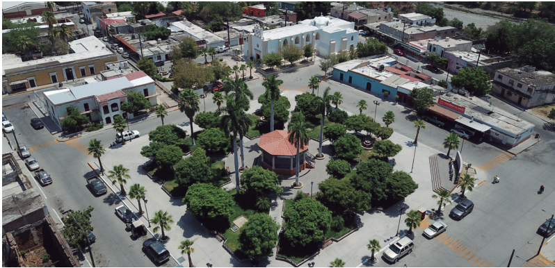
Imagen aérea de la plaza de armas en el centro histórico de la ciudad de Choix en Sinaloa.

Don Eustaquio Buelna, quien sostiene que Tzoes se deriva de tzoil que significa cera, o recolectores de brea, aunque en la lengua indígena