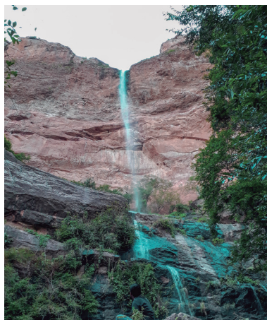
La cascada en las cercanías de la Presa Huites, practica de senderismo que se observa solo en tiempos de lluvias.

Choix es tierra de auténticos indígenas de los mayos, en cuyas prácticas, son portadores de una hermosa tradición que queda manifiesta en Semana Santa, donde pueblos como Baymena, Huites, Baca y San Javier, realizan sus danzas y rituales al unísono, destacan-