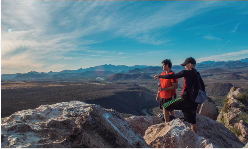
Senderismo, entre riscos y montañas de la Presa Huites

tantes de este lugar suelen visitar caminando, por las banquetas de un hermoso bulevar el que además cuenta con excelente iluminación, por lo que la práctica de la caminata puede hacerse a toda hora.