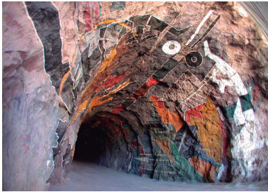
La cueva de huites, mas de 5 mil metros cuadrados de pintura en un tunel de 240 metros de longitud, 9 metros de ancho y 9 metros de altura.

Esa presa cuenta con dos túneles, en uno de ellos se encuentra la pintura sobre roca que lo hace ser el mural más grande del mundo, es conocida como las pinturas de “La Cueva de Huites”.