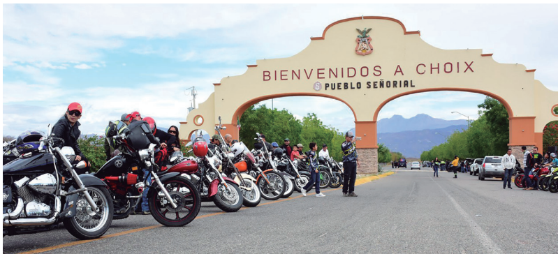
Recorrido anual por Choix del Club de Motos Harley.

A orillas de la presa, en el palmar “Lake Huites”, lugar de encanto, magia y encuentro del arte y la cultura donde la comunidad cultural