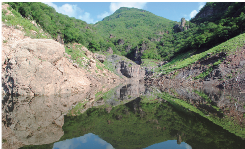
Vista del vaso de la presa Huites donde se practica la pesca deportiva.

terapéuticas de las aguas sulfurosas, más interesante resulta la visita a estos lugares.