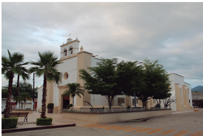
Iglesia de San Ignacio de Loyola en el centro histórico de la ciudad.

Al frente de la iglesia jesuita dedicada al fundador de la compañía de