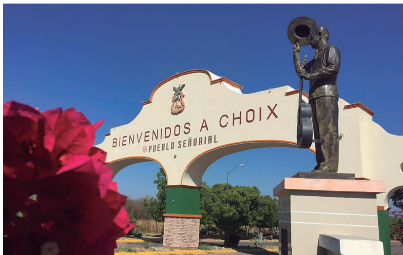
Arco de bienvenida a la ciudad de Choix, Sinaloa y monumento a José Ángel Espinoza "Ferrusquilla", compositor de echame a mí la culpa y la ley del monte ; nacido en Choix, Sinaloa.

A la llegada de la ciudad, te da la bienvenida un mudo testigo de nuestra historia reciente, el hermoso Arco de entrada, con luces de mil colores que lo hace lucir hermoso durante las noches.