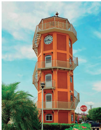
Vista de la torre mirador, museo de José Ángel Espinoza "Ferrusquilla", hijo predilecto de Choix

Un edificio de 17 metros de altura con cinco pisos inspirada en la torre de Pisa, Italia, con vestíbulo en la parte superior, en esta torre encuentras el Museo Mirador, donde en una de sus salas observarás la