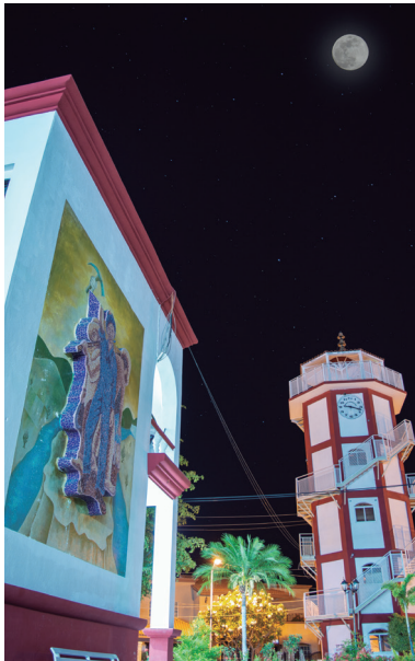
Mural en mosaico en el Palacio Municipal que nos habla de las actividades económicas del municipio.

Su palacio municipal se terminó de construir en 1993, dejando atrás el viejo palacio de adobe o casa municipal del siglo XVII, en él se encuentra el mural en mosaico veneciano llamado Los Generales que hace honor a los personajes de esta tierra del tiempo de la Revolución. Otras hermosas obras también dedicadas a los sectores productivos de la región se encuentran plasmados en un mural cuyos acabados combinan un sobre relieve y mosaico veneciano en la alta pared que da al frente del palacio municipal.