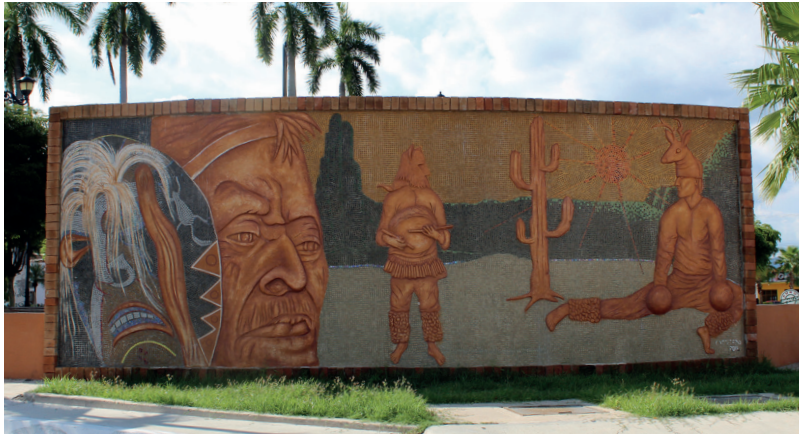
Un mural que habla de nuestras tradiciones indígenas origen de esta tierra.

La plaza del pueblo fue recientemente reconstruida y modernizada con nuevos jardines, modernos sistemas de iluminación y un quiosco que la hacen lucir verdaderamente hermosa.