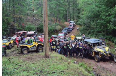
Un aspecto de la flora en la sierra alta de Choix.

En cuanto a la fauna, una importante diversidad de especies como el venado, el puma, el jabalí, lagar-