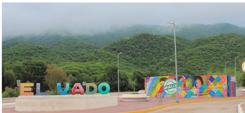
Vista a la llegada al parque lineal de "El Vado"

El Vado, es una colonia que en la medida del paso del tiempo se aproxima más a la ciudad, en ella se ha inaugurado en abril de 2019, un hermoso parque lineal en el que podrás disfrutar de su recorrido en bicicleta, lugar a donde los habi-