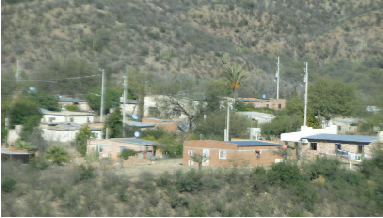
Hacia lo lejos se observa el caserío de Tuape, 202

Este Real de minas tenía algunas en explotación situado en una meseta alta en lugar estratégico en estos sitios. Los apaches, janos y otras tribus merodeaban destruían y robaban las siembras; y en este lugar donde siempre hay agua en arroyos y nacimientos, indispensable para el proceso de los metales, situados en todos esos cerros, encontramos muchos terreros, túneles, y las pilas que usaban en esos menesteres para lavar los metales.