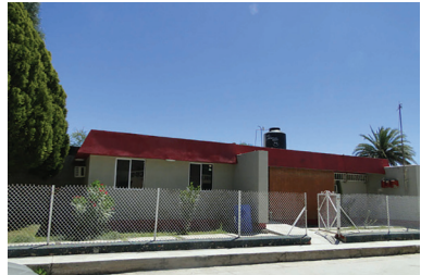
Centro de Salud Opodepe, 2013

Existen plazas, comercios escuelas y telesecundarias pequeñas en cada una de las poblaciones, algunas con un lugar amplio donde se reúnen y hacen fiestas.