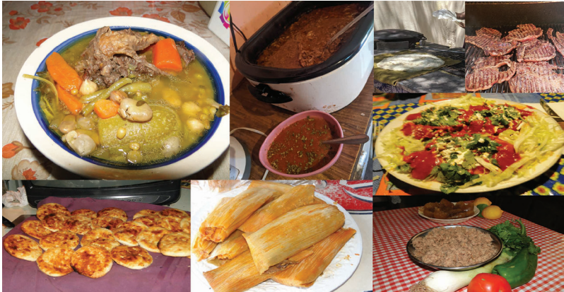
Variedad de platillos regionales, 2020

Dulces: conserva de limón, dulce de membrillo, dulce de higo, de durazno, ponteduro, jamoncillo, capirotada, calabaza con panocha entre otros.