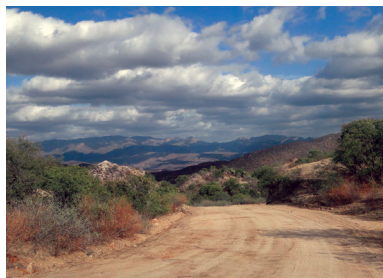
Camino de terracería hacia el pueblo de Opodepe, 2020)

Los lugares más admirados están en los terrenos de los ranchos por sus paisajes, por todo el río llegamos a un cañón como de 300 m. llamado Los Tanques formado por peñas tan altas que casi no se ve el sol; por debajo corre el agua formando pequeños manantiales; puede pasar un auto y fue usado como camino por donde acarreamos metal de una mina de plata llamada “Siria Elena”, que hace pocos años dejó de trabajarse, está al final del cañón se encuentra en Tuape. (foto 5, Cañón “Los Tanques” en Tuape. Comisaría, 2010).