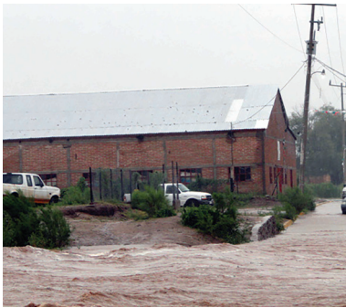
Arrollo "El Zanjón" de la comunidad de Querobabi, 2014

Los cantiles algunos forman túneles naturales en largos espacios; por dentro arroyuelos que corren