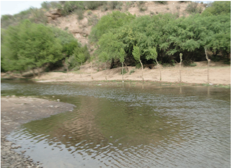
Rio San Miguel antes Nacozura en Opata, 2019

El territorio de Opodepe es generalmente plano, corresponde a la zona de las llanuras y en los límites con San Felipe de Jesús y Banámichi se encuentran las Sierras de Los Hornitos, del Carrizo y el Murucutachi con algunos ranchos, con sus paisajes diversos.