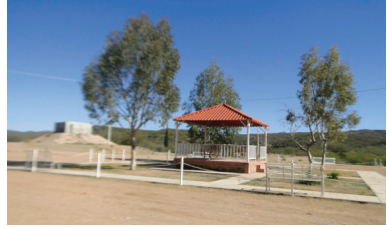
Plaza de Tuape, 2020

Aquí vivieron algunos personajes mineros que ocupaban cargos como Laureano Rascón de Prado, llegó con Pedro de Perea. Rodrigo de Aldana, Sargento mayor y minero de España, siendo uno de los más importantes; fue quien descubrió las minas de este Real, dictó medidas de orden en contra de los indios rebeldes, falleció en Tuape. De esto sólo queda la historia, una casa antigua de adobe, y la Iglesia.