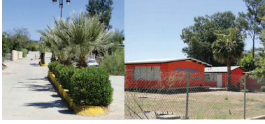
Molino harinero "Suárez" de 1948 de Opodepe, 2017

Al Sur salida a Rayón pueblo vecino a 26 km. se encuentra el Jardín de Niños alguna casa moderna muchos árboles frutales, se da la pera, membrillo, durazno, higos, aguacate, mango, uvalama, granadas guayabas nuez, se distinguen los cítricos; por lo regular las personas de estas comunidades que se jubilan hacen sus casas y vienen a pasar vacaciones; por eso veremos algunas muy arregladas pero las habitan un tiempo se van los dueños, y quedan solas, así que si te gusta este pueblito puedes rentar alguna de estas casas.