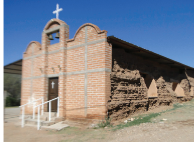
Iglesia de San Miguel de Tuape hoy Santa Rosalía, Jesuita de 1687, 2020

cristalinos agregando belleza al paisaje natural. Por un lado los angostos caminos las tupidas filas de sahuaros, por el otro plantas de pitahayas; más al norte redondeles de frondosos árboles llamados alisos, álamos y los cúmaros protegen la sierra.