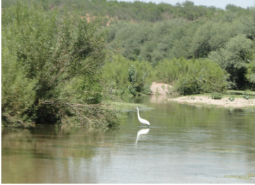
Paisaje del río San Miguel, 2020

ñas, entre bosques, barrancas, y piedras de color cobrizo de figuras caprichosas, atraen la vista del español extranjero; que explora, estudia conoce, y explota.