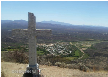
Vista del Valle de Opodepe desde el Cerro de la Cruz.

Desde la cima que es amplia y plana se divisa el caserío de Opodepe, arriba hay una cruz de cemen-