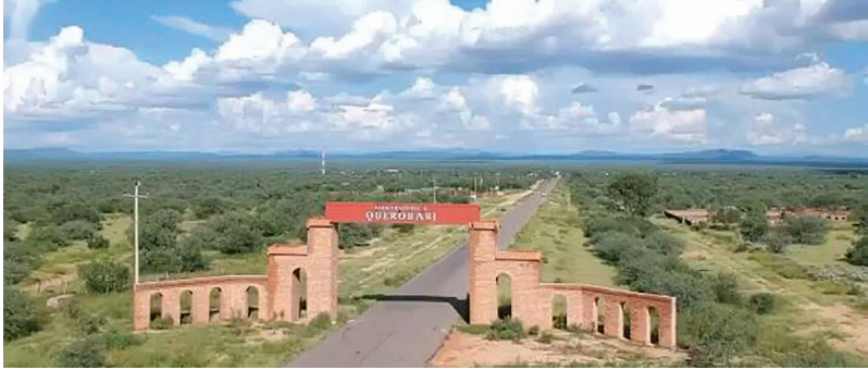
Entrada a la población de Querobabi. Entrada Norte, 2018(2020)

El clima del municipio de Opo-depe es semi-cálido con una temperatura media máxima mensual de 29°C en junio y julio y una media mínima mensual de 13.3°C en los meses de diciembre y enero. La época de lluvias se presenta en verano en los meses de julio y agosto, ocasionalmente heladas en los meses de noviembre y diciembre que baja a 5°C.