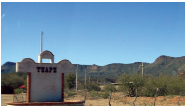
Entrada de Tuape, fundado en 1637, 2020