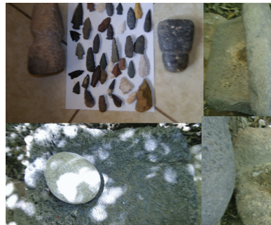
Objetos usados por los Opatas: Pedernales para flechas, metate, piedras para machacar y hachas de piedra, 2020

Hablaban la lengua tegüima o eudebe llamada también ópata, armoniosa y rica en vocablos derivada del náhuatl. La lengua desapareció porque ellos aprendían con facilidad el español, de tal modo que dejaron de hablarla hoy en el municipio nadie habla ópata, usamos a