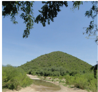
Entrada a Opodepe viniendo de Querobabi por el río San Miguel, 2020