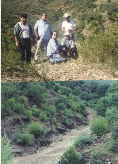
Grupo de colaboradores y camino de Real de Minas, 2010

los encontramos entre los habitantes del pueblo.