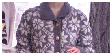
Sello del Ayuntamiento de Tuape como municipio hasta 1930, 2018

En 1918 los nombramientos a Presidentes Municipales eran de dos años. Durante la última y actual reforma constitucional de 1942, se autorizó a tres años hasta estos tiempos.