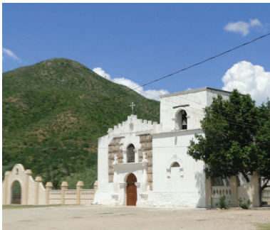
Iglesia "Nuestra Señora de la Asunción de Opodepe 1689, 2013

Quien ordenó se construyera el templo en el año 1689, en cuyo frontispicio se conservan todavía unos 30 cuadros de jeroglíficos que representan el padre nuestro en ópata, en lo alto dibujado el cor-