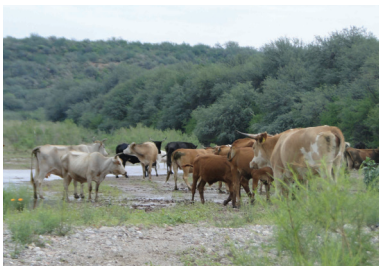
Ganado de Ranchos aledaños en Opodepe, 2017

Podemos conocer tortugas de tierra que salen en verano, no deben de matarse porque están en peligro de extinción, o los jabalíes con sus crías que buscan el agua, conejos y liebres son muy comunes en estos parajes, palomas pitahayas que anuncian el fruto, codornices en parvadas o correcaminos que se atraviesan, les llamamos chureas y el aullido de los coyotes complementan el paisaje