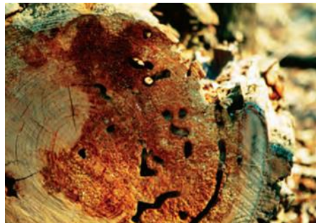
Figura 3: Galerías de hormigas carpinteras establecidas en madera debilitada.

Atacan maderas duras y coníferas. Las hormigas carpinteras son muy adaptables y capaces de establecer nidos en diversos entornos. Ocurren con mayor frecuencia en áreas boscosas y prefieren anidar en un ambiente húmedo. (Texas A&M University, 2020) (Figura 3).