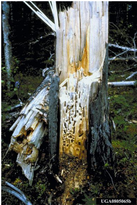
Figura 5: Galerías en la base de pino ponderosa causado por hormigas carpinteras (USDA 2013)

Las excavaciones en madera pueden ser tan extensas que se pierde la integridad estructural del árbol, predisponiendo al árbol a la rotura por efecto del viento (USDA, 2013) (Figura 5).