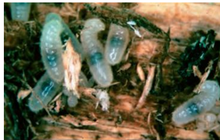
Figura 6: Larvas de Camponotus .

Estos pueden ser confundidos con la actividad de las termitas (Figura 6), pero las termitas no suelen ocurrir en elevaciones más altas que los bosques de piñón-enebro en los bosques de la región de las Montañas Rocosas, además de que las pastillas fecales de termitas son distintamente diferentes de las de Camponotus spp (USDA, 2013).