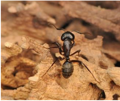
Figura 1: Adulto de Camponotus sp.