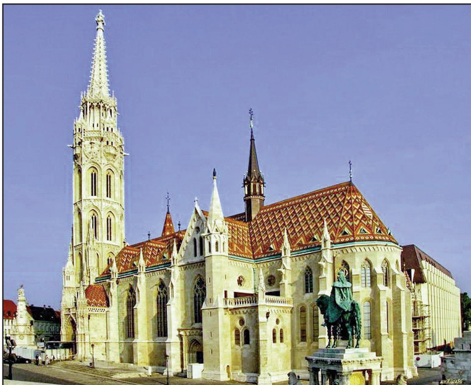
A budapesti Nagyboldogasszony plébániatemplom