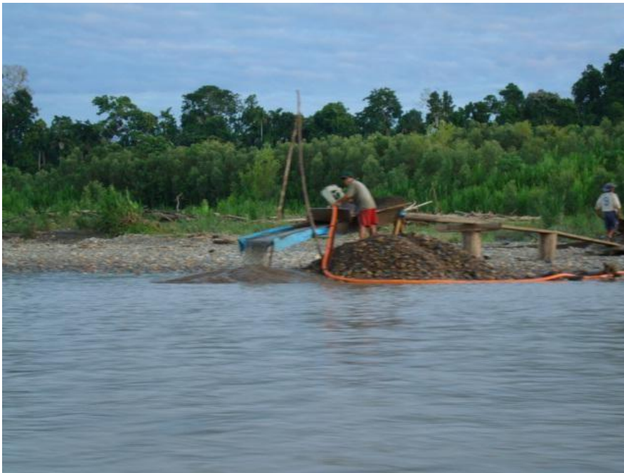
Foto 4. Extracción de oro aluvial en Madre de Dios.