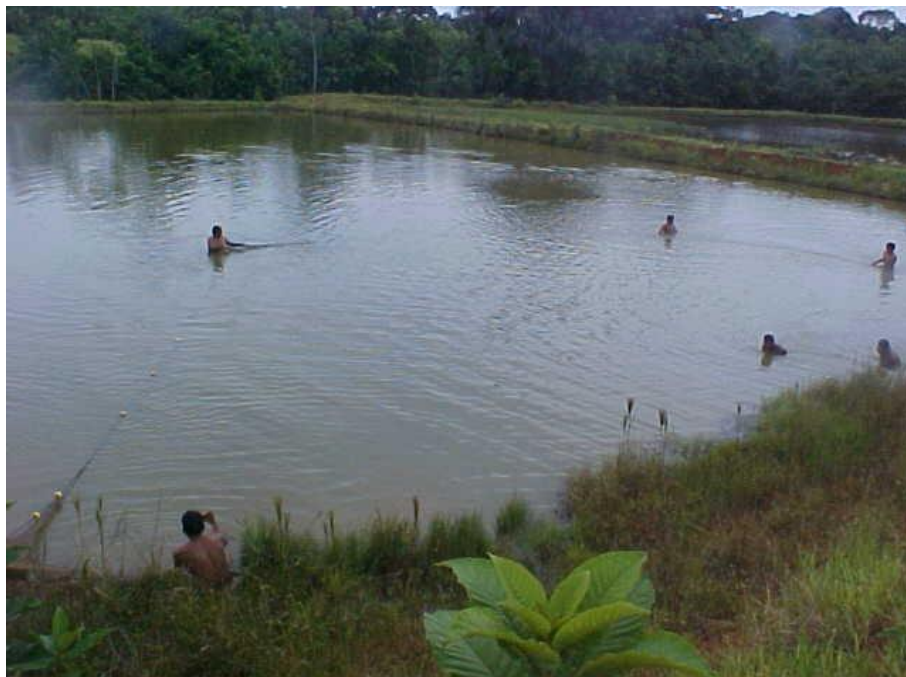
Foto 5. Cosecha de "gamitana" en estanque de cultivo