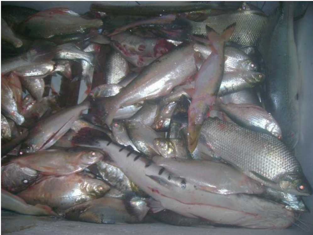
Foto 2. Peces presentes en el departamento de Madre de Dios