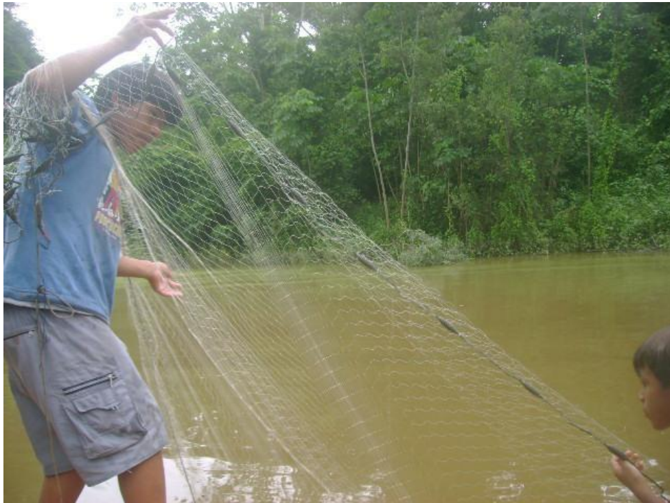
Foto 3. Faena de pesca en el Lago Valencia

La mayor actividad de la pesquería comercial para consumo humano directo se realiza en la cuenca del río Madre de Dios y es practicada, principalmente, por pescadores profesionales provenientes de la ciudad de Puerto Maldonado.