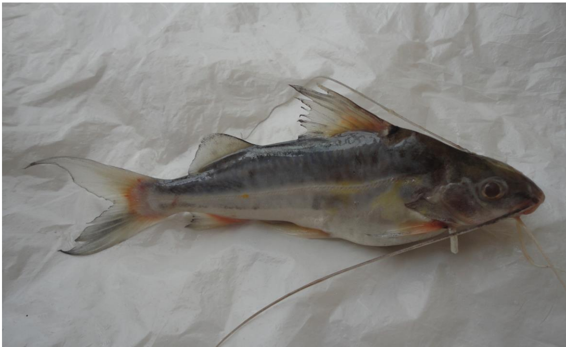
1.7: “bagre cunchi” Pimelodus blochii , río Apurímac