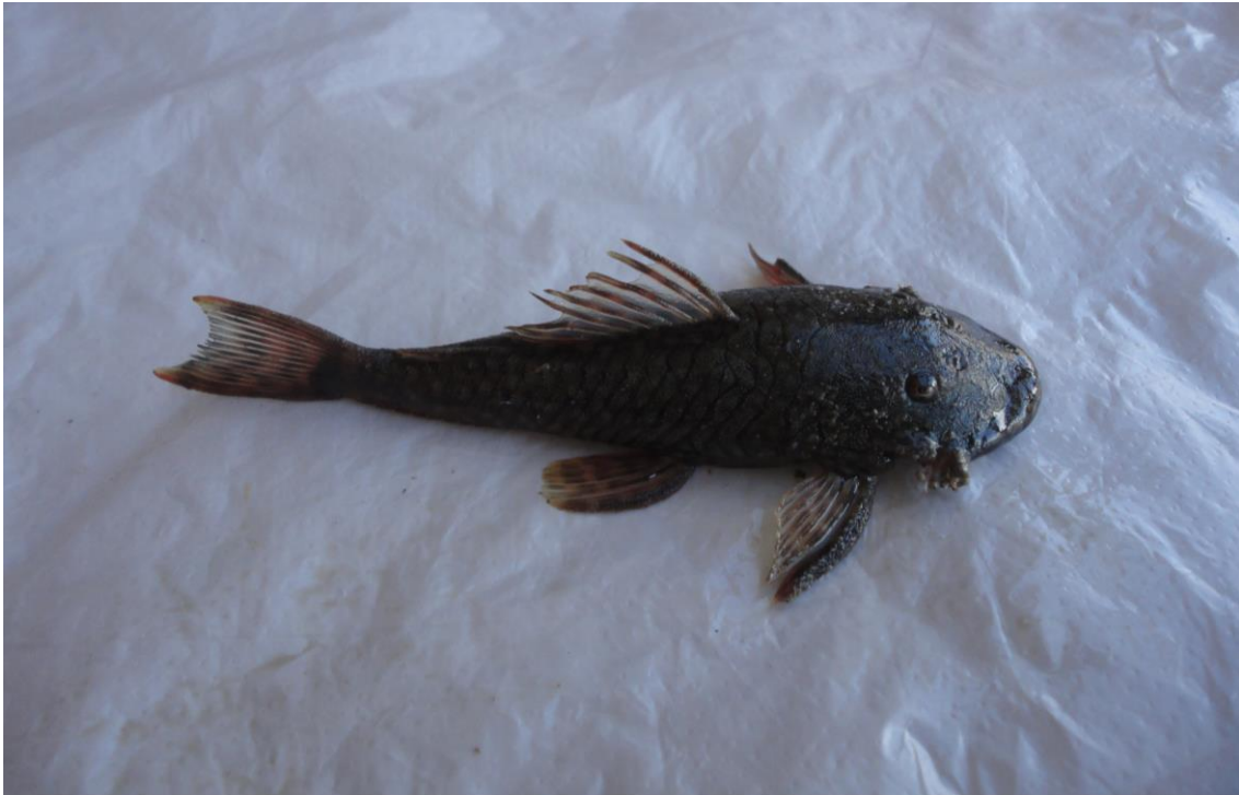
1.5: “carachama” Chaetostoma lineopunctatum , río Apurímac