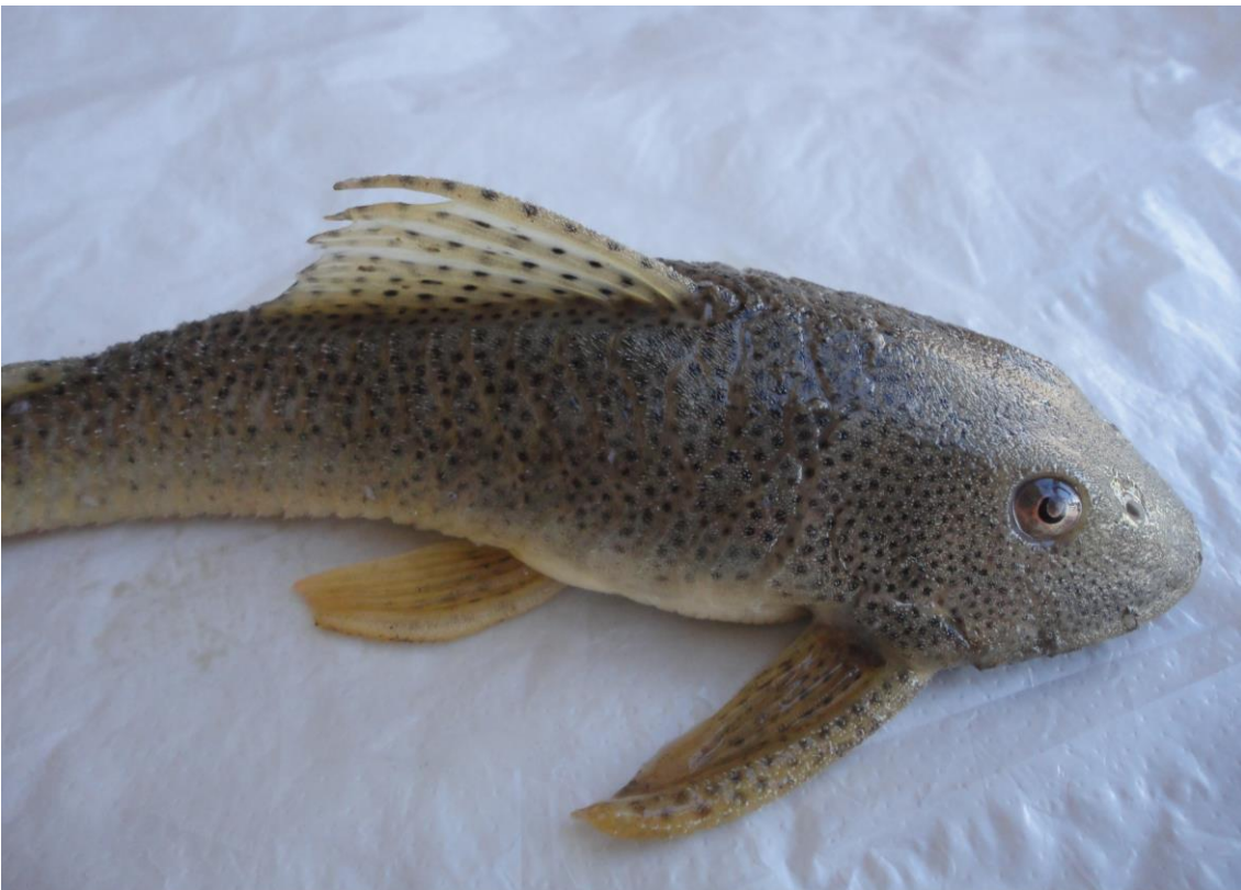
1.4: “carachama” Aphanotorulus unicolor , río Apurímac