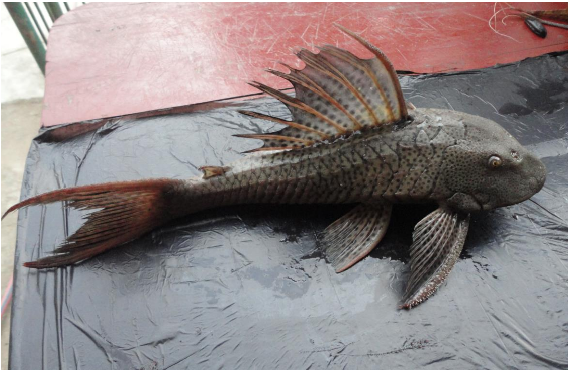
1.3: “carachama” Hypostomus oculus , río Apurímac