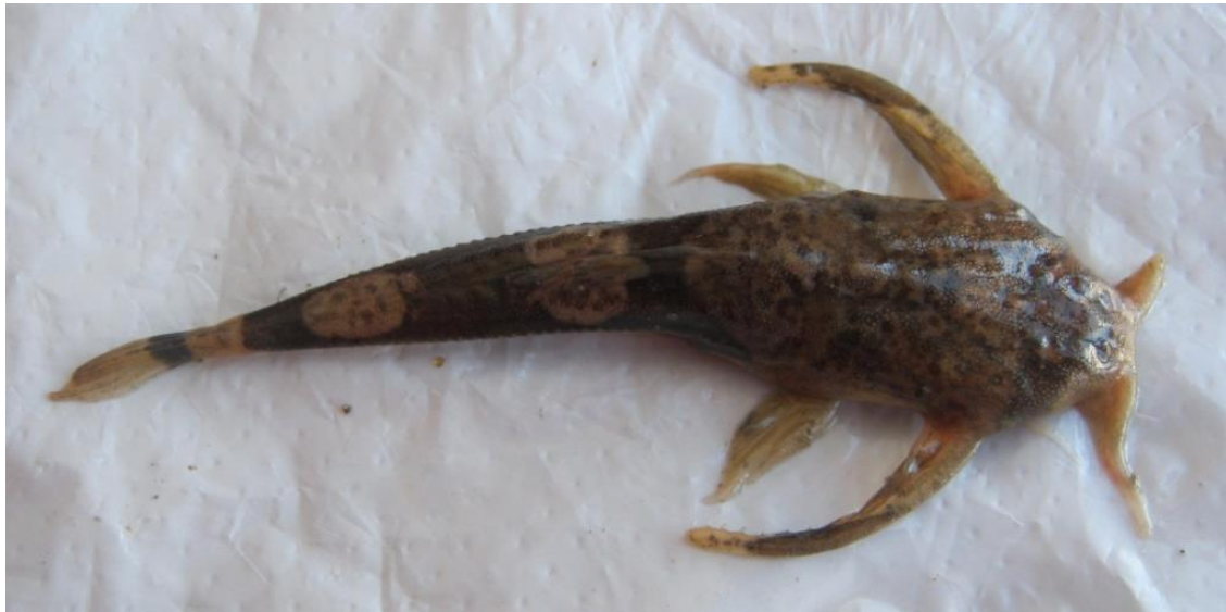
1.1: “bagre” Ernstichthys megistus , río Apurímac