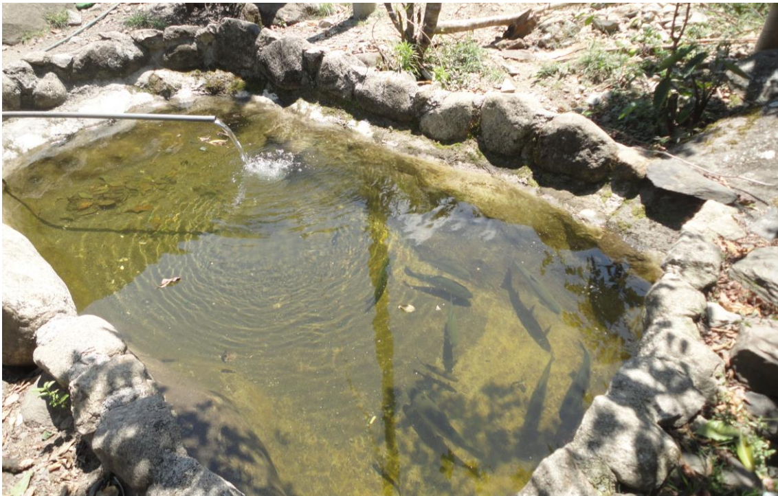
Foto 13: Pequeño estanque construido con piedras para el cultivo de trucha, Vilcabamba - Pucyura