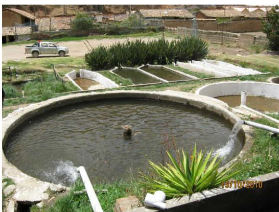
Foto 14. Estanque circular para el cultivo trucha