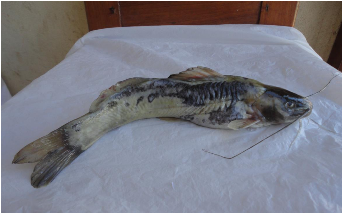
1.9: “bagre” Rhamdia quelen , río Apurímac