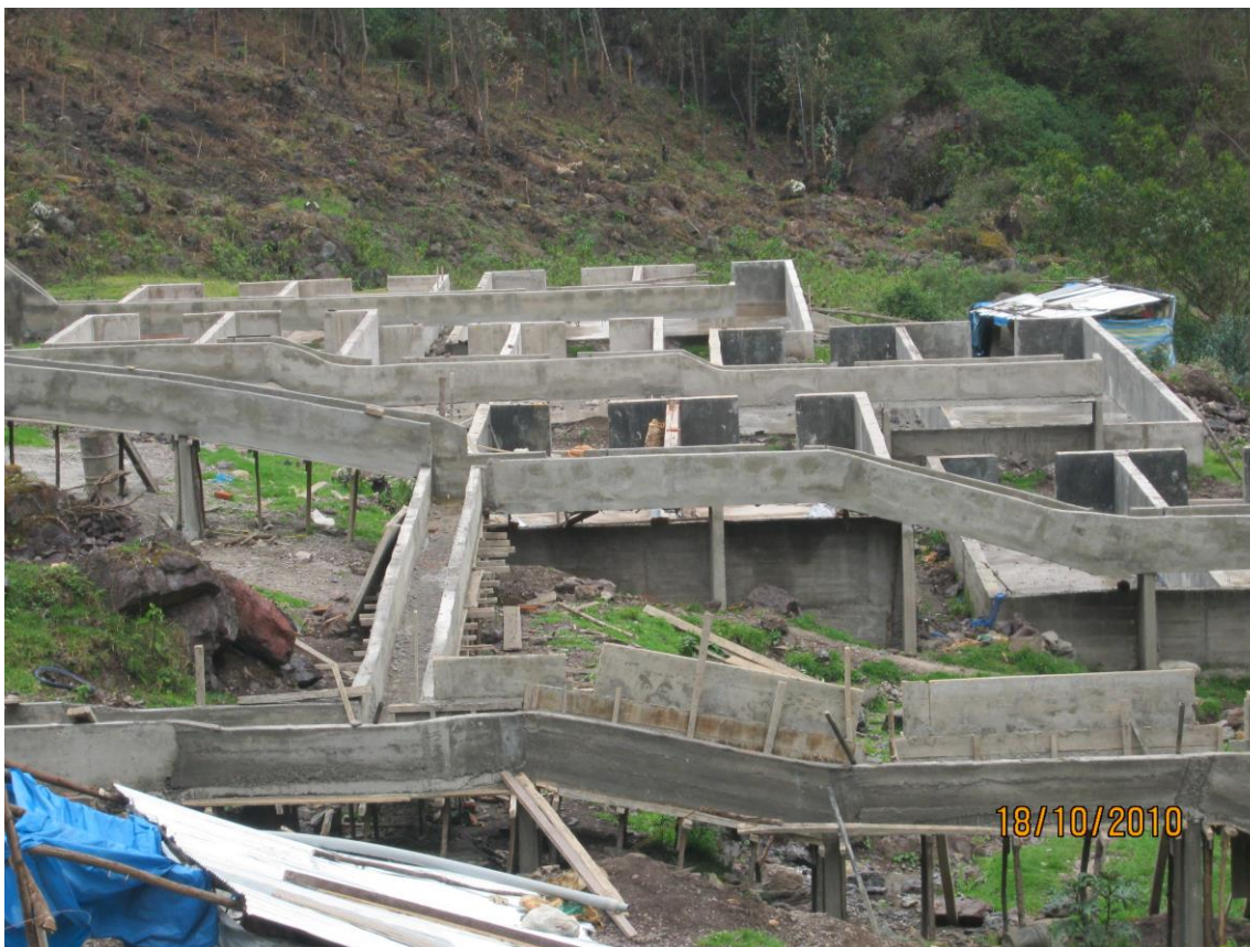
Foto 11: Infraestructura en construcción para la crianza de truchas-San Marcos de Rocchac