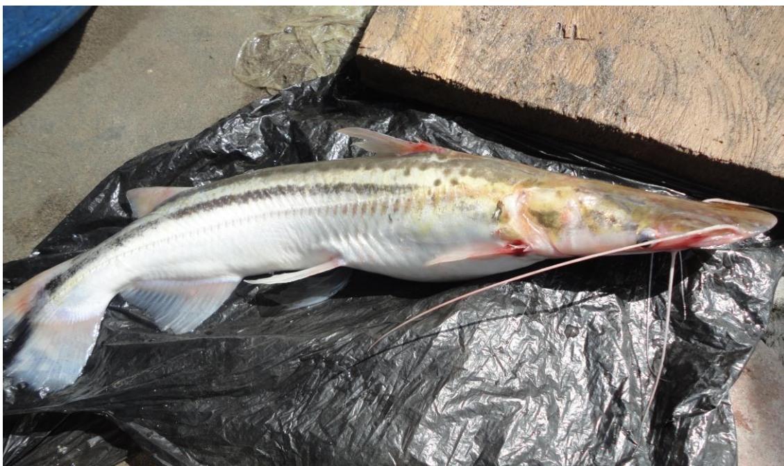
1.8: “shiripira” Sorubim lima , río Apurímac