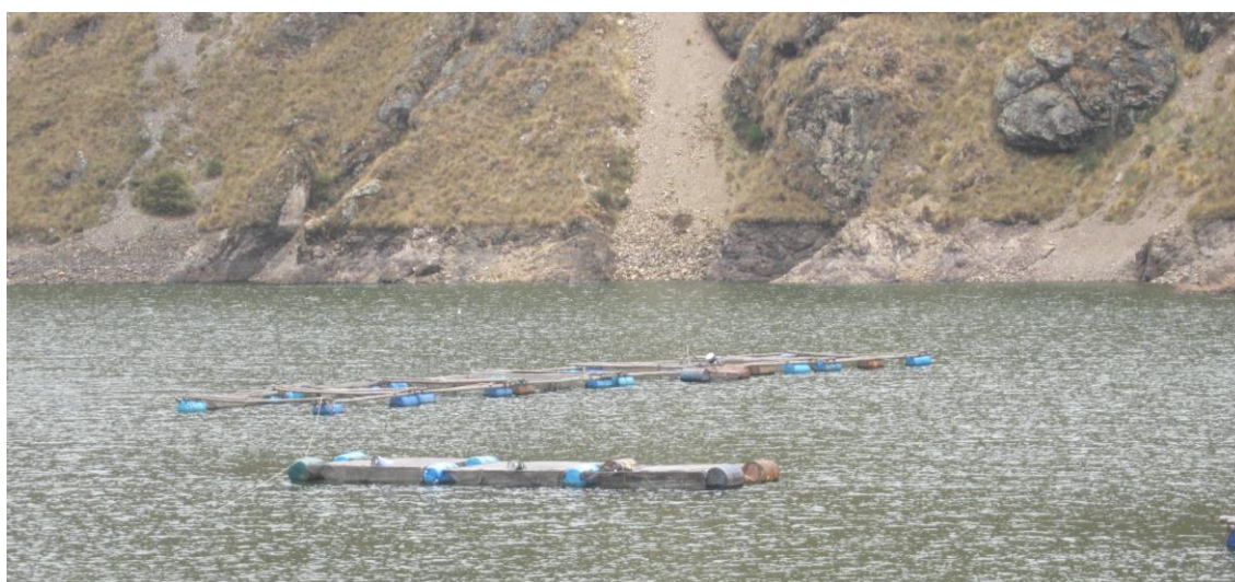
Foto 10: Crianza de truchas en jaulas flotantes, laguna “cuchapata”-San Marcos de Rocchac