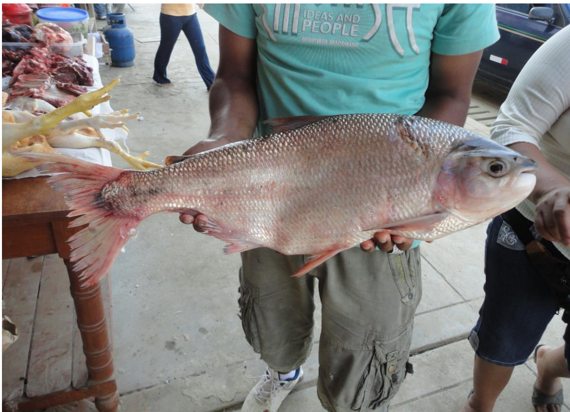
Foto 6: “Sábalo cola roja” Brycon cephalus , Puerto Cocos-río Apurímac

La familia Characidae presenta generalmente especies de porte pequeño entre 5 y 20 cm, siendo los más frecuentes y de poca demanda en el mercado los “choges” Astyanax bimaculatus , Astyanax abramis , Hemibrycon polyodon , Holoshestes sp. y Knodus sp. En este grupo también se encuentra el “sábalo cola roja” Brycon cephalus de apreciable tamaño (50 cm) y peso (5 kg) y gran demanda en el mercado.