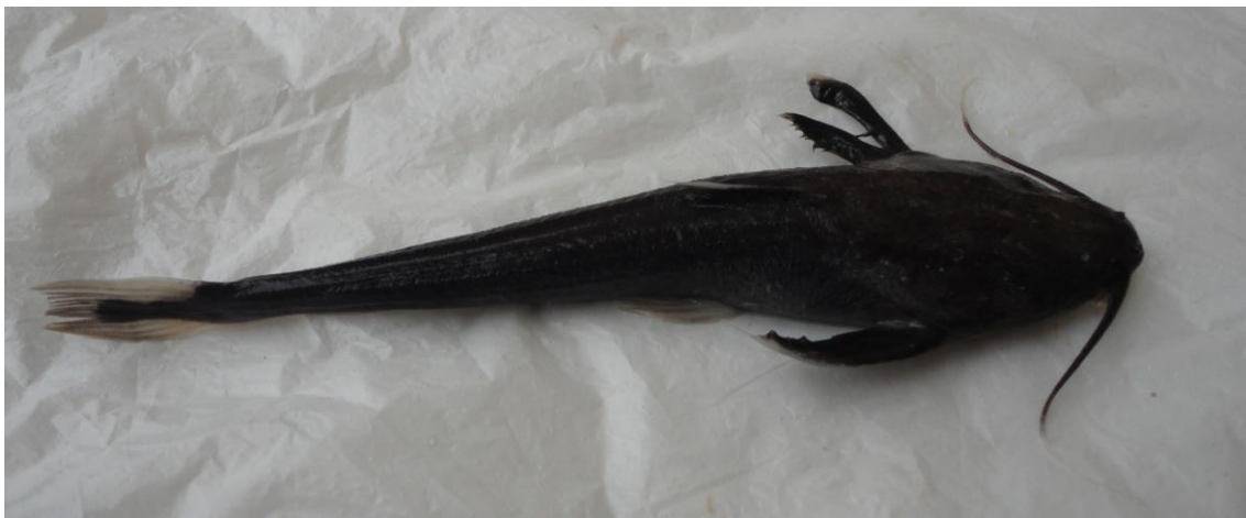
1.2: “bagre negro” Xyliphius melanopterus , río Apurímac