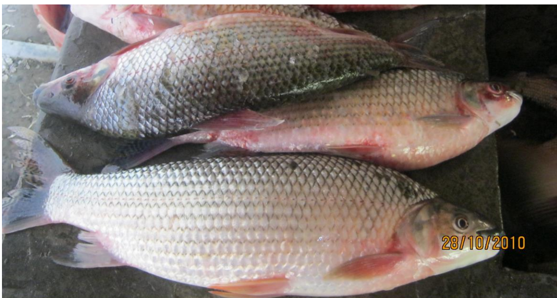
Foto 7: “chupadora o boqui” Prochilodus nigricans -San Antonio, río Apurímac

Muchas de las especies capturadas presentan gónadas maduras, señal de época reproductiva, entre ellas podemos mencionar a “boqui”, “bagre”, “bagre cunchi”, “dentón”, entre otros. Los ejemplares maduros de “boqui” Prochilodus nigricans miden entre 35 a 42 cm y pesan entre 1,5 a 2,0 kg; y del “bagre” Pimelodus ornatus miden entre 44 a 47 cm con peso que oscila entre 1,0 a 1,5 kg.