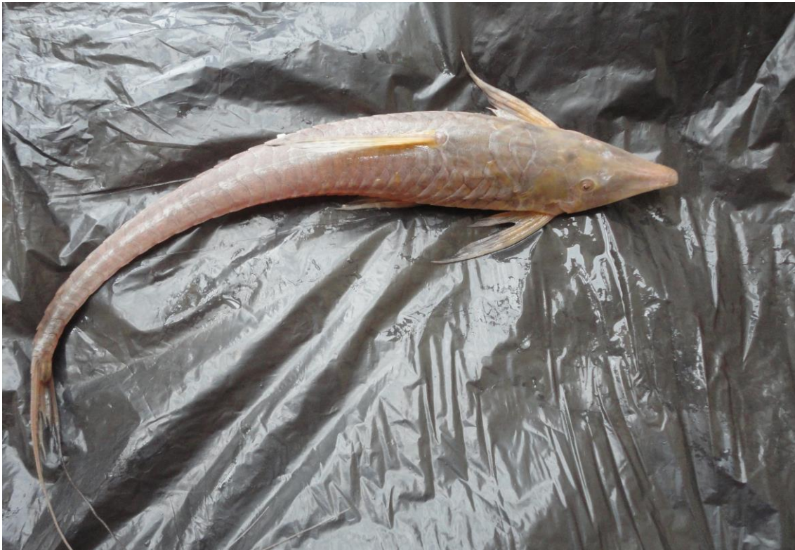
1.6: “carachama” Sturisoma sp., río Apurímac