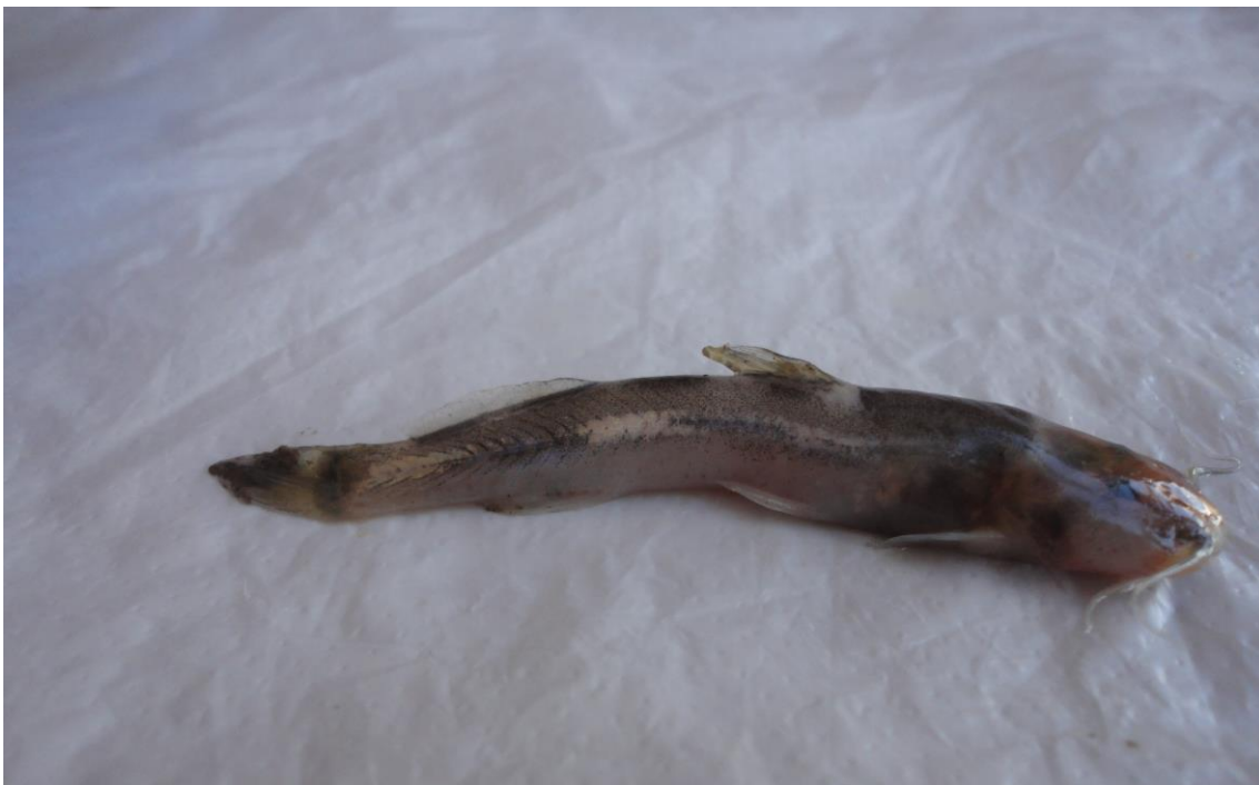
1.10: Especie indeterminada, río Apurímac