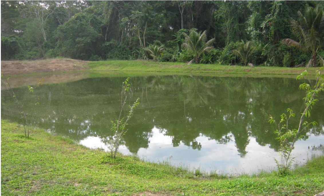
Foto 12: Piscigranja construido a tajo abierto con sembrío de camucamu en la orilla

plátano, uburuqui, pucho, etc., muchas veces se emplea cuando escasea el alimento balanceado o cuando no hay dinero para comprarlo. Las densidades de siembras varían de acuerdo a la especie, en el caso de las truchas las densidades fluctúan entre 30 a 35 individuos/m 2 ; en el caso del paco y la gamitana entre de 1 a 3 individuos/m 2 (Tabla 8).