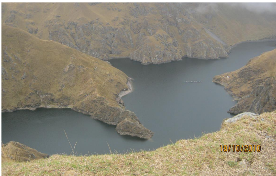
Foto 9: Laguna altoandina “aquilli”-San Marcos de Rocchac-Tayacaja