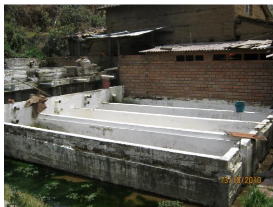
Foto 15. Estanque rectangular para el cultivo de trucha