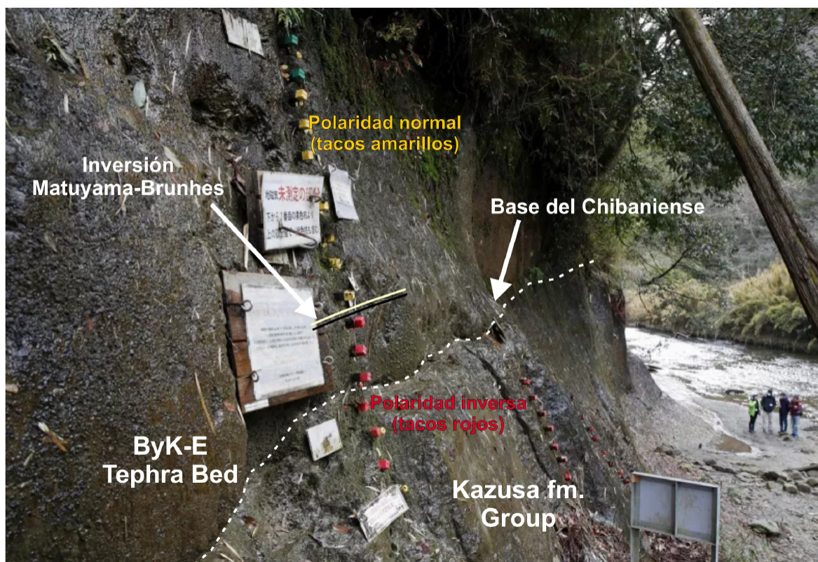
Figura 2. Fotografía del acantilado de la prefectura de Chiba (Tokio) donde se ha situado el GSSP para la base del Chibaniense (Pleistoceno medio) siguiendo el límite entre la capa regional de tefra ByK-E y la formación sedimentaria del Grupo Kazusa (línea discontinua blanca). Nótese que la inversión paleomagnética Matuyama-Brunhes (tacos rojos y amarillos) se sitúa 1,1 m por encima de la base del Chibaniense.

sistema de yacimientos de Atapuerca en Burgos (Parés et al. , 2017) o Cueva Negra en Murcia (Walker et al. , 2020). Según estos últimos autores, en Cueva Negra (río Quípar) se documenta el primer uso del fuego en la península asociado a industria lítica achelense con una edad poco superior a la inversión Matuyama-Brunhes (780 ka). En lo que se refiere a yacimientos kársticos, es TD8 el que inaugura el Chibaniense en España. En este yacimiento se documenta ya la fauna típicamente pleistocena que aparece profusamente en la península, como es el caballo Equus altidens , el rinoceronte Stephanorhinus etruscus , el jabalí Sus scrofa , el gamo Dama vallonnetensis , el