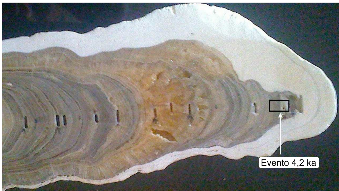
Figura 3. Estratigrafía visual de la sección del espeleotema KM-A (Cueva Mawmluh, India) en la que se sitúa el GSSP correspondiente a la base del Meghalayense). Modificada de la IUGS webpage (Walker et al. , 2018)

Su nombre hace referencia al sondeo NGRIP1, que es donde se localiza la sección tipo para el GSSP de su base. Este GSSP se ha definido a una profundidad de 1.228,67 m en el mencionado sondeo, coincidente con un intervalo que muestra un brusco enfriamiento tras un periodo de progresivo incremento de temperaturas a lo largo del Holoceno inferior (Walker et al. , 2009). Este enfriamiento ocurre a los 8.320 años b2k en el sondeo NGRIP1 y se correlaciona con el evento frío de 8,2kyr identificado a escala global (Evento Bond 5).