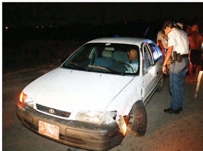
a topa cu e accidente cu ta uno e Tercel a ranca dal riba e wiel semi frontal y a constata cu e banda di e Swift cora biniendo for di noord bayendo zuid y a topa cune riba e subida. E impacto tabata fuerte ora cu ambos a dal den otro banda di e wiel dilanti e Tercel a ranca dal riba e wiel banda di chauffeur di e Swift kibra y e Tercel mes su wiel a ranca. Ambulance a presenta y atende cu e personanan wak si por tin herida. Polis a bay cu e homber di e Tercel ya cu e tabata bou influencia di alcohol.