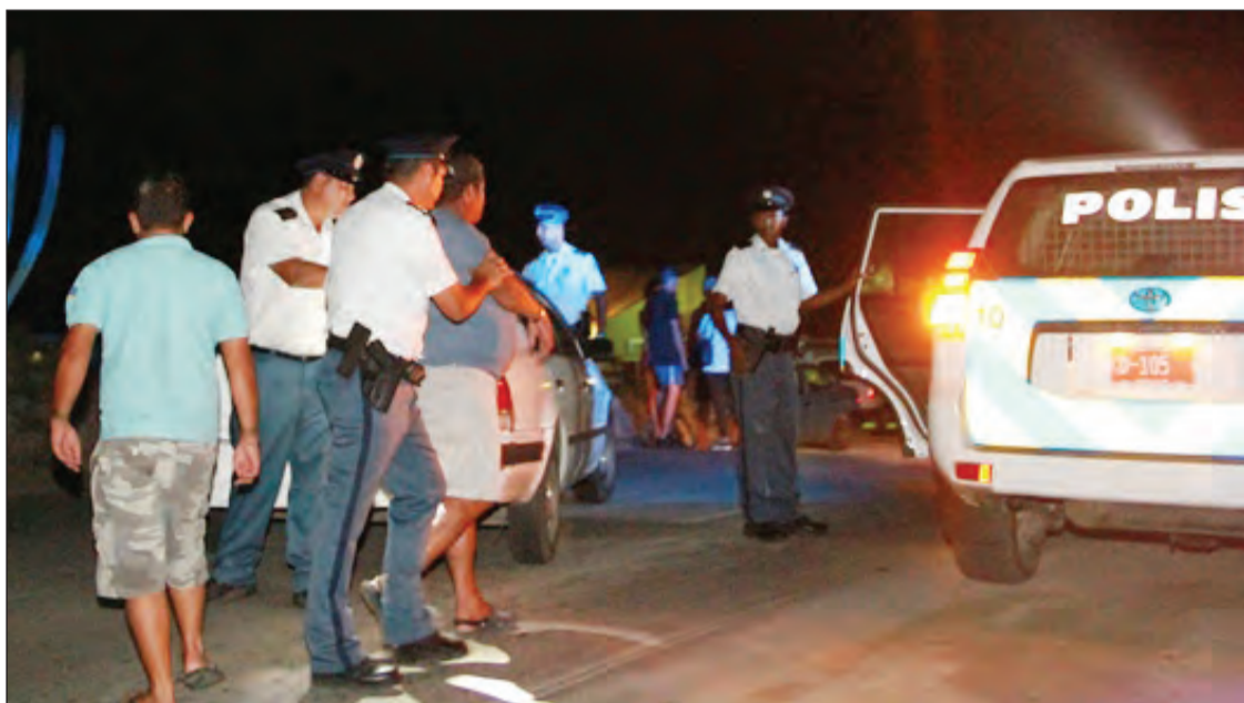
Diaranson anochi un accidente cu e lorada skerpi di Monserat a dal contra un Swift. Polis di a tuma luga na e subida prome altura di e veld unda un Tercel biaha a presenta na e sitio y aki