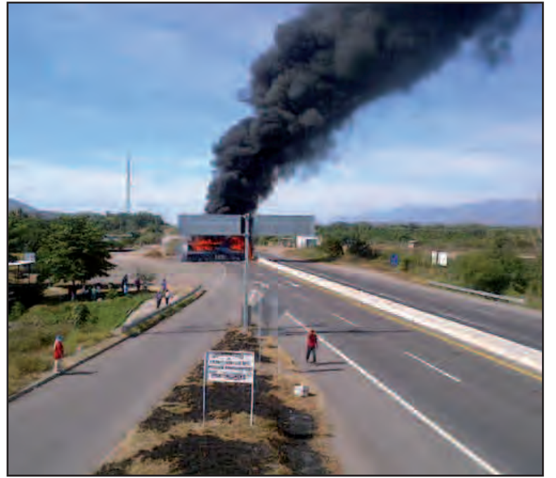
La carretera Cuatro Caminos-Apatzingán fue bloqueada nuevamente, a la altura del municipio de Parácuaro, donde fueron atravesados dos autobuses de pasajeros con la finalidad de impedir el paso vehicular.

En tanto, ante los bloqueos carreteros que iniciaron en distintos puntos de la Tierra Caliente, la Terminal de Autobuses de Morelia suspendió sus corridas hacia esta región.