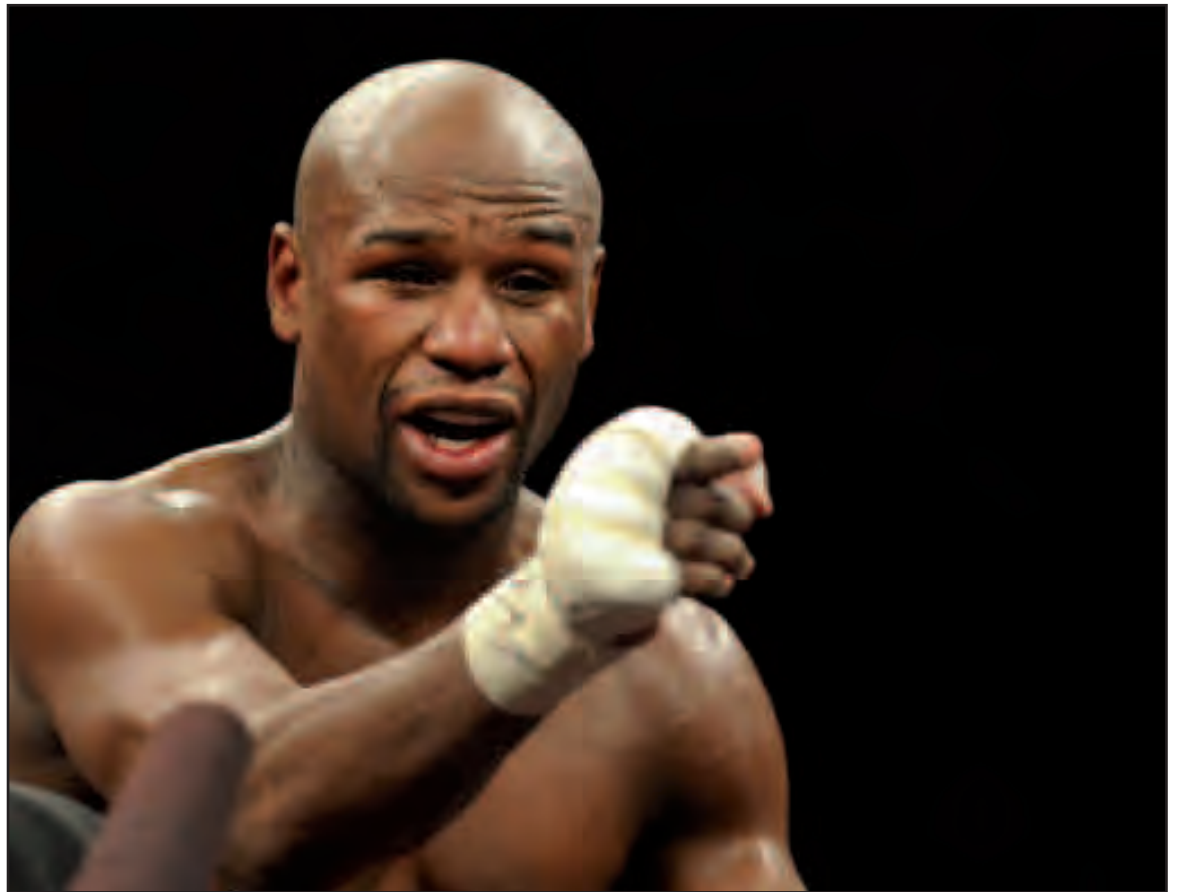
El boxeador estadounidense, Floyd Mayweather Jr., volvió a rechazar un combate contra el filipino Manny Pacquiao, pues considera que "tuvo su oportunidad" y ahora lo vuelve a buscar sólo por los problemas de impuestos que tiene.

Mayweather dijo que se negará a pelear contra Pacquiao mientras siga con Bob Arum como promotor.