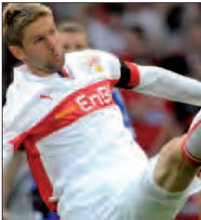
El ex internacional alemán Thomas Hitzlperger se declaró homosexual en una entrevista que publicará este jueves el semanario alemán "Die Zeit".

Hitzlperger dijo que nunca se había avergonzado de su homosexualidad pero admitió que muchos chistes sobre homosexuales que se hacen en los vestuarios no habían sido para él fáciles de soportar.