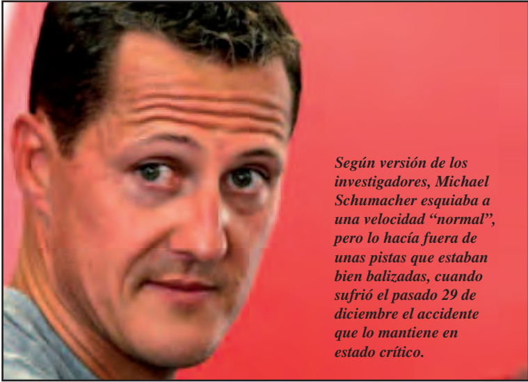
Según versión de los investigadores, Michael Schumacher esquiaba a una velocidad "normal", pero lo hacía fuera de unas pistas que estaban bien balizadas, cuando sufrió el pasado 29 de diciembre el accidente que lo mantiene en estado crítico.

PARÍS, 8 de enero.— El ex campeón de Fórmula 1, Michael Schumacher esquiaba a una velocidad "normal", pero lo hacía fuera de unas pistas que estaban bien balizadas, cuando sufrió el pasado 29 de diciembre el accidente que lo mantiene en estado crítico, según la versión de los investigadores.