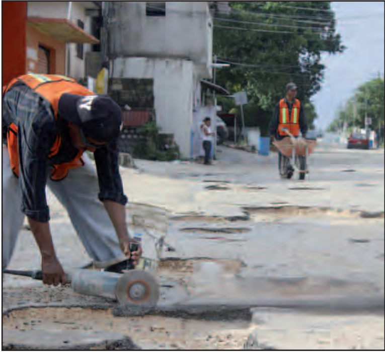
Con el propósito de mantener en condiciones óptimas las calles y avenidas del municipio, el Ayuntamiento de Solidaridad aplicará una mezcla asfáltica predosificada en frío resistente al agua, de tal manera que a pesar de los cambios climáticos se continuará con los trabajos de bacheo.

PLAYA DEL CARMEN. — Como parte de los trabajos encaminados a mejorar las condiciones de las vialidades con el propósito de mantener en condiciones óptimas las calles y avenidas del municipio, el gobierno del presidente municipal de Solidaridad, Mauricio Góngora Escalante, aplicará una mezcla asfáltica predosificada en frío resistente al agua, de tal manera que a pesar de los cambios climáticos se continuará con los trabajos de bacheo.