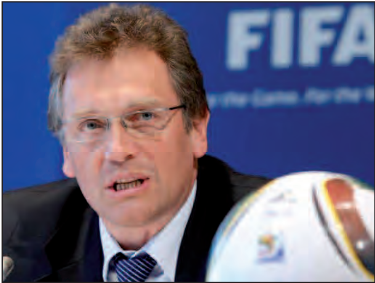
El Mundial de Fútbol de Qatar 2022 no se celebrará en los meses de junio y julio debido a las altas temperaturas, sino "probablemente" entre noviembre y enero, declaró el secretario general de la FIFA, Jérôme Valcke.

PARÍS, 8 de enero.— El Mundial de Fútbol de Qatar 2022 no se celebrará en los meses de junio y julio debido a las altas temperaturas, sino "probablemente" entre noviembre y enero, como muy tarde, según declaró el secretario general de la Federación Internacional de Fútbol (FIFA), Jérôme Valcke. "El Mundial de Qatar no se disputará en verano. Creo que se jugará entre el 15 de noviembre y el 15 de enero, como muy tarde", declaró el "número dos" de la FIFA en una entrevista concedida a la emisora 'France Info'.