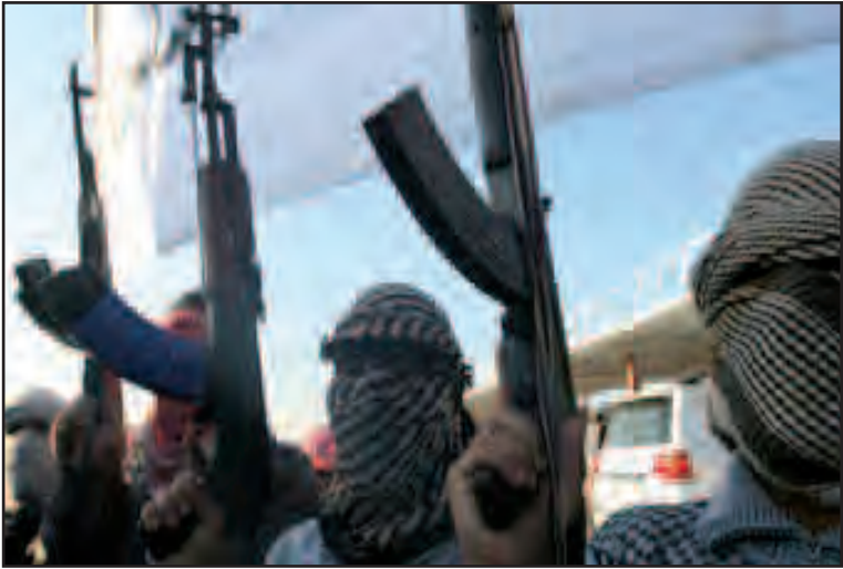
Lucha intestina en Irak

BAGDAD, 8 de enero.— Las fuerzas policiales iraquíes y tribus locales lograron expulsar del centro de la ciudad de Ramadi a los yihadistas del Estado Islámico de Irak y el Levante y retomar así el control de la ciudad, ocupado por el grupo vinculado a Al Qaeda.