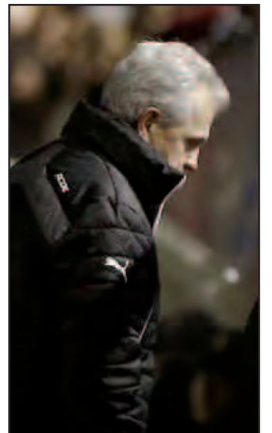
El técnico mexicano Javier Aguirre fue suspendido cuatro partidos por insultar al árbitro en el duelo que disputó el Espanyol ante el Osasuna.