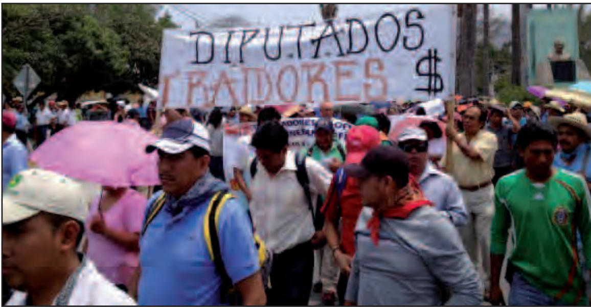
Dirigentes sociales y magisteriales rechazaron cualquier relación con la guerrilla, argumentaron que realizan vida pública y más que impulsar movimientos radicales, son promotores activos de los derechos humanos.

Lamentó que antes de difundir el texto del martes 7 de enero, no se le haya buscado para compulsar la información que se difundió, misma que fue proporcionada por instancias como inteligencia militar o gubernación federal.