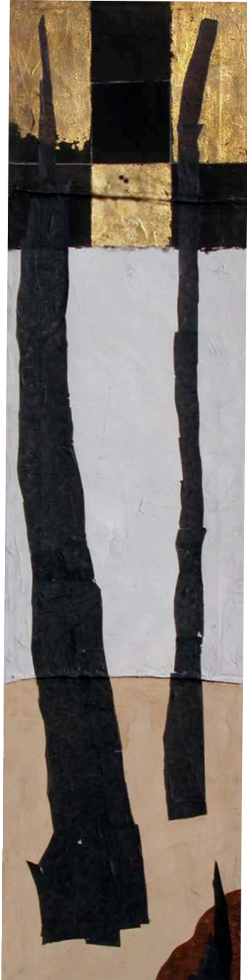
Carlo Montesi, Verticale , 2012.