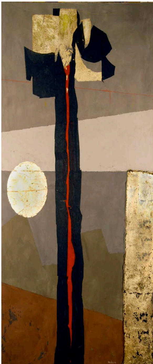
Carlo Montesi, Albero totem , 2008.