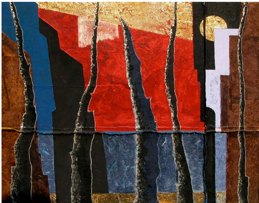
Carlo Montesi, Alberi , 2005.