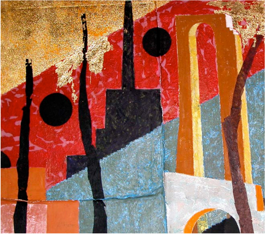
Carlo Montesi, Sere a 300