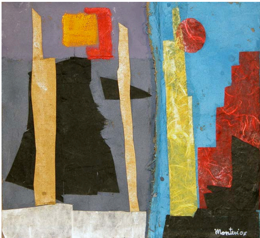
Carlo Montesi, Scale