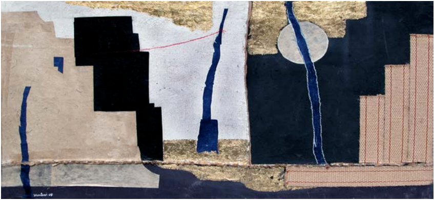
Carlo Montesi, Notturmo , 2011.