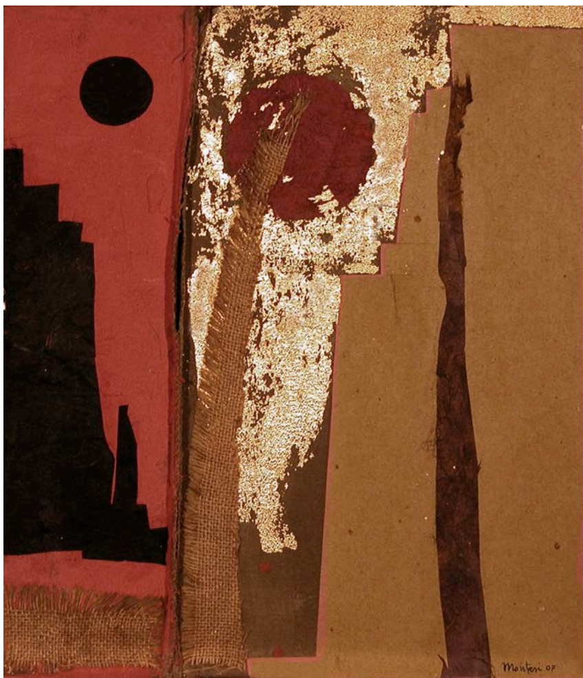
Carlo Montesi, Luna , 2004.