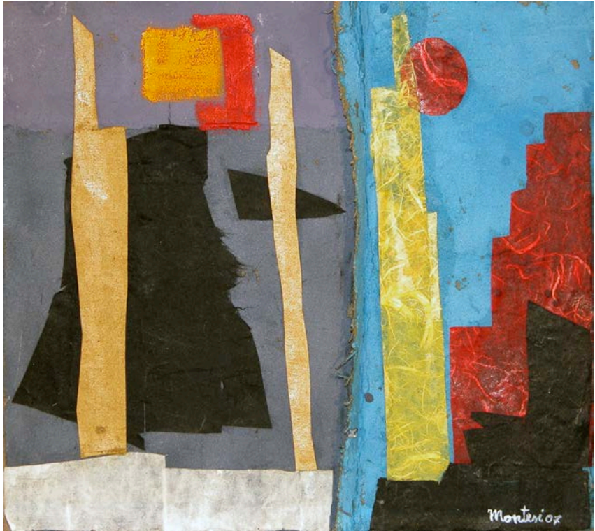
Carlo Montesi, Scale , 2007.