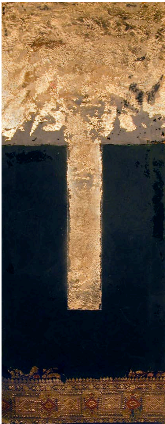
Carlo Montesi, A Oriente , 2006.