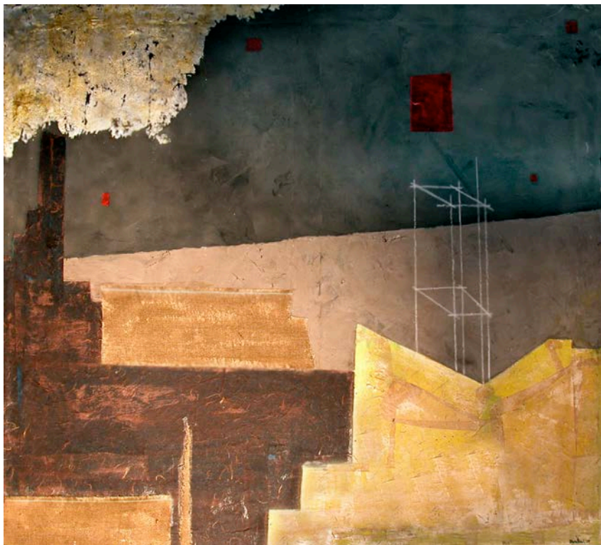
Carlo Montesi, tralicci , 2010.