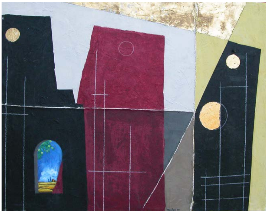
Carlo Montesi, la finestra , 2007.