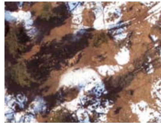
Szarvasok 300 méter magasról

majd ráfagyó pára miatt balesetveszélyessé válhat a repülés.