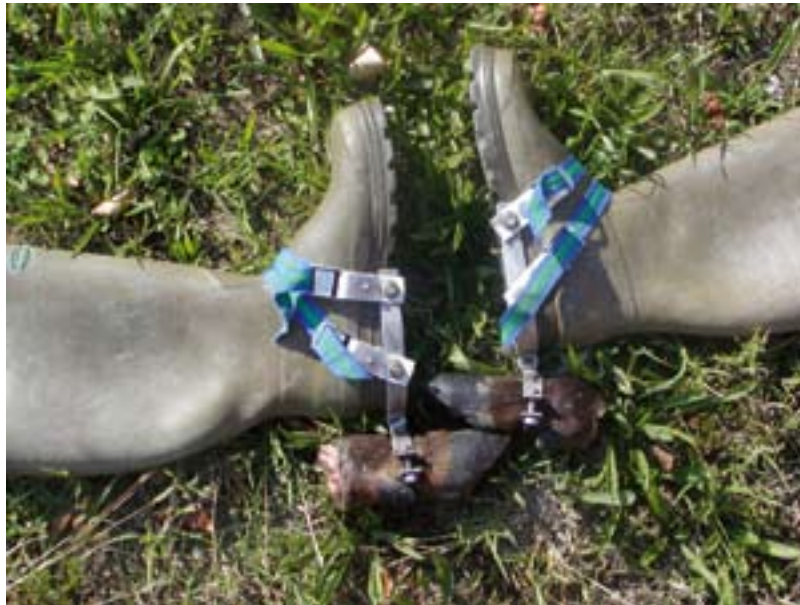
A csapacipő felszerelése.