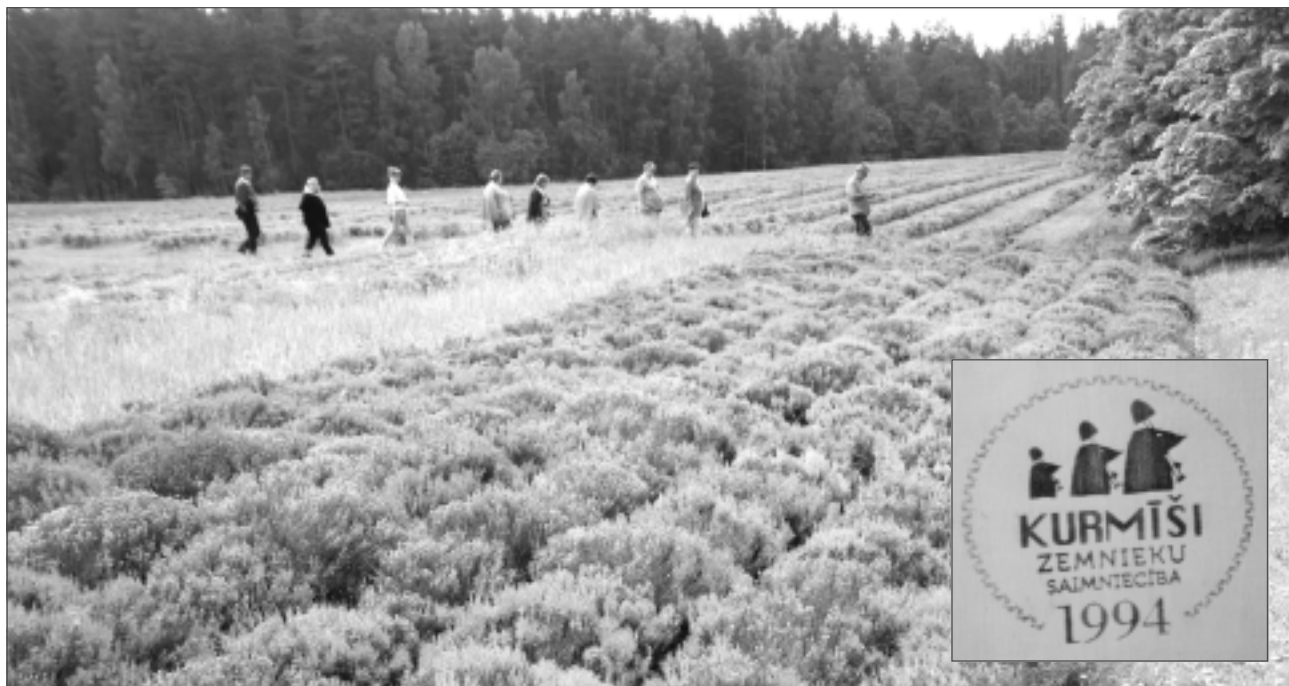
Ārstniecības augu lauki. Ekskursanti nav reta parādība zemnieku saimniecībā “Kurmīši”. Parasti ārstniecības tēju iepazīšanas procesu viņi sāk ar plantāciju apskati, tad dodas uz kalti un nobauda gatavo produkciju.