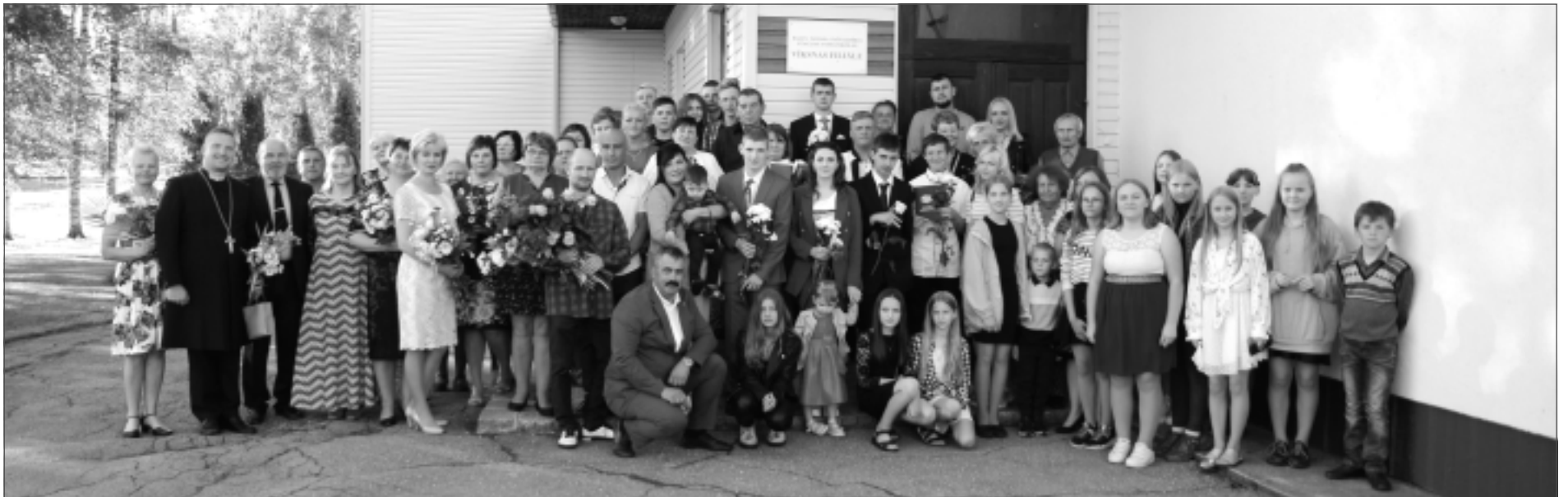
2022.gada 15.jūnijs. Stacijas pamatskolas Viksnas filiāles 9.klases izlaidumā skolas kolektīvs, skolēni un vecāki turējās godam. Neizpalika ne smaidi, ne dziesmas, ne arī asaras...