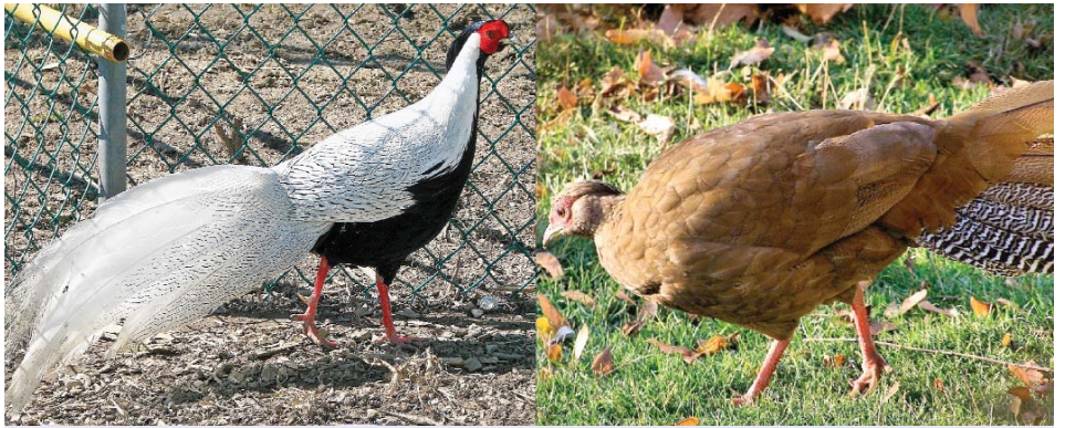
Lophura nycthemera nycthemera - pár - bažant stříbrný

Kohout má modročernou, velmi bohatou chocholku, okolo očí lysou kůži červené barvy, která v toku nabývá značné velikosti a sytosti. Dolní část těla od zobáku přes krk, prsa a břicho má černou barvu s modrým leskem. Krk bílý, zbytek těla je bílý s jem-