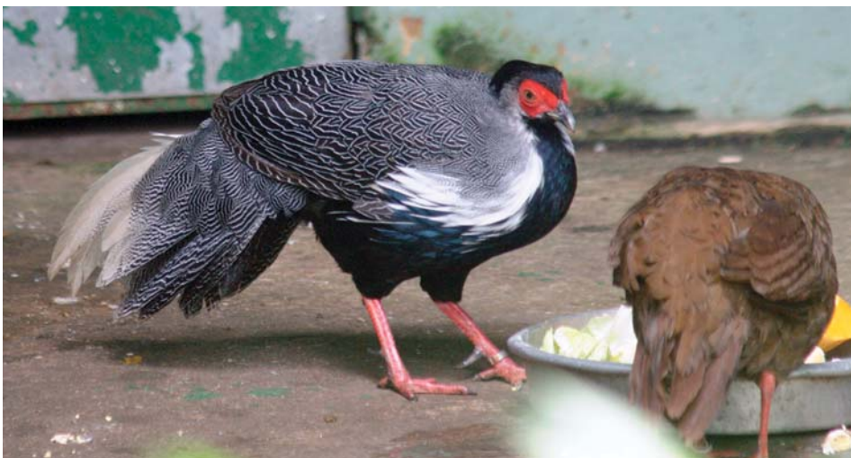
Lophura nycthemera anamensis - pár - bažant annámský