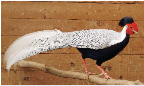
Lophura nycthemera berliozii - pár - bažant Berliozův