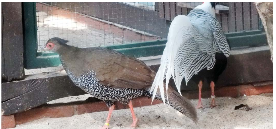
Lophura nycthemera jonesi - pár - bažant Jonesův

Kohout je podobný L. n. jonesi , jen má rovnější kresbu.