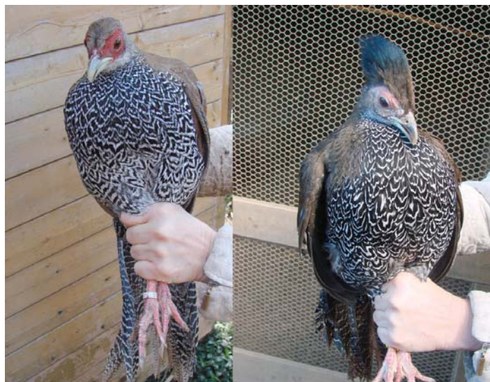
Detail slípky Lophura n. Berliozii a Jonesi

Chovné zařízení by mělo svými rozměry odpovídat počtu a velikosti chovaných ptáků, samozřejmě čím větší, tím lepší. Rozměr pro pár by měl být alespoň 8-10 m 2 . Voliéra by měla mít závětrí a být zčásti zastřešená. Důležité je, aby ve voliére byla