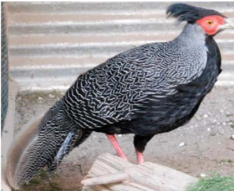
Lophura nycthemera lewisi -pár - bažant Lewisův

Slípka je olivově hnědá, spodek těla má hnědavě skvrnitý.