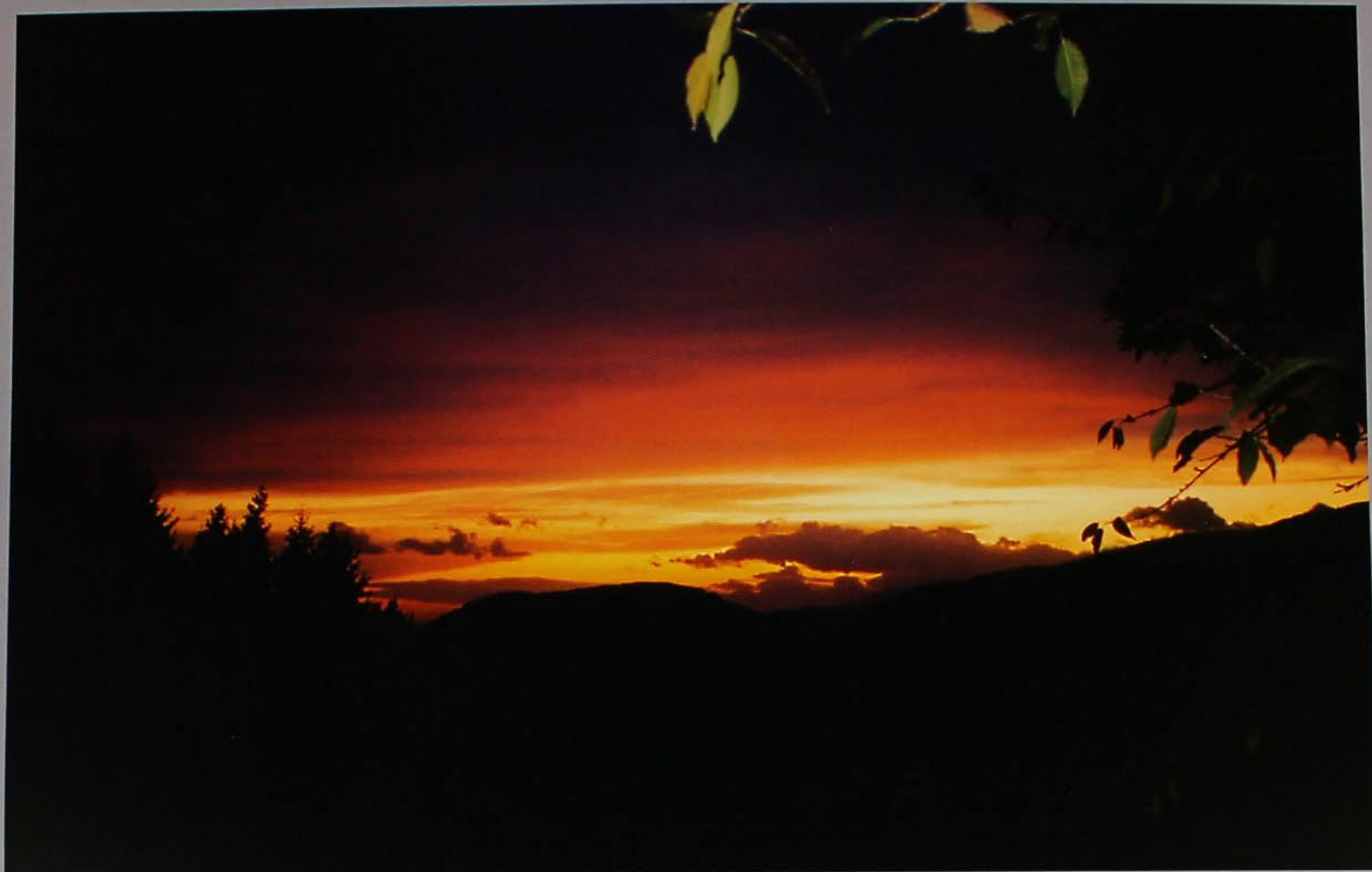
E le foglie stanno a guardare.

sbecare scondaròla sbèssola scopèlo sbiansare scorèda sbòlsa scuri sboraura scùrtolo sbrissiare sècia scagnèlo seciario scàja segnarse scajaròla séja scalpelin sélega scàndole sentòn scansia sequèri scàola seràjo scarsèla sércio scartòsso sèssola scavejara sfèja schissare sgàlmare schito sgèva s-ciafa sgevà s-cianta sgiaventare s-ciapo sgnarà s-ciapussi sgrafòn s-ciocaròì sgranfo s-ciòna sgrèbeni s-ciopa sgrensare scòda sguassare scoato simia