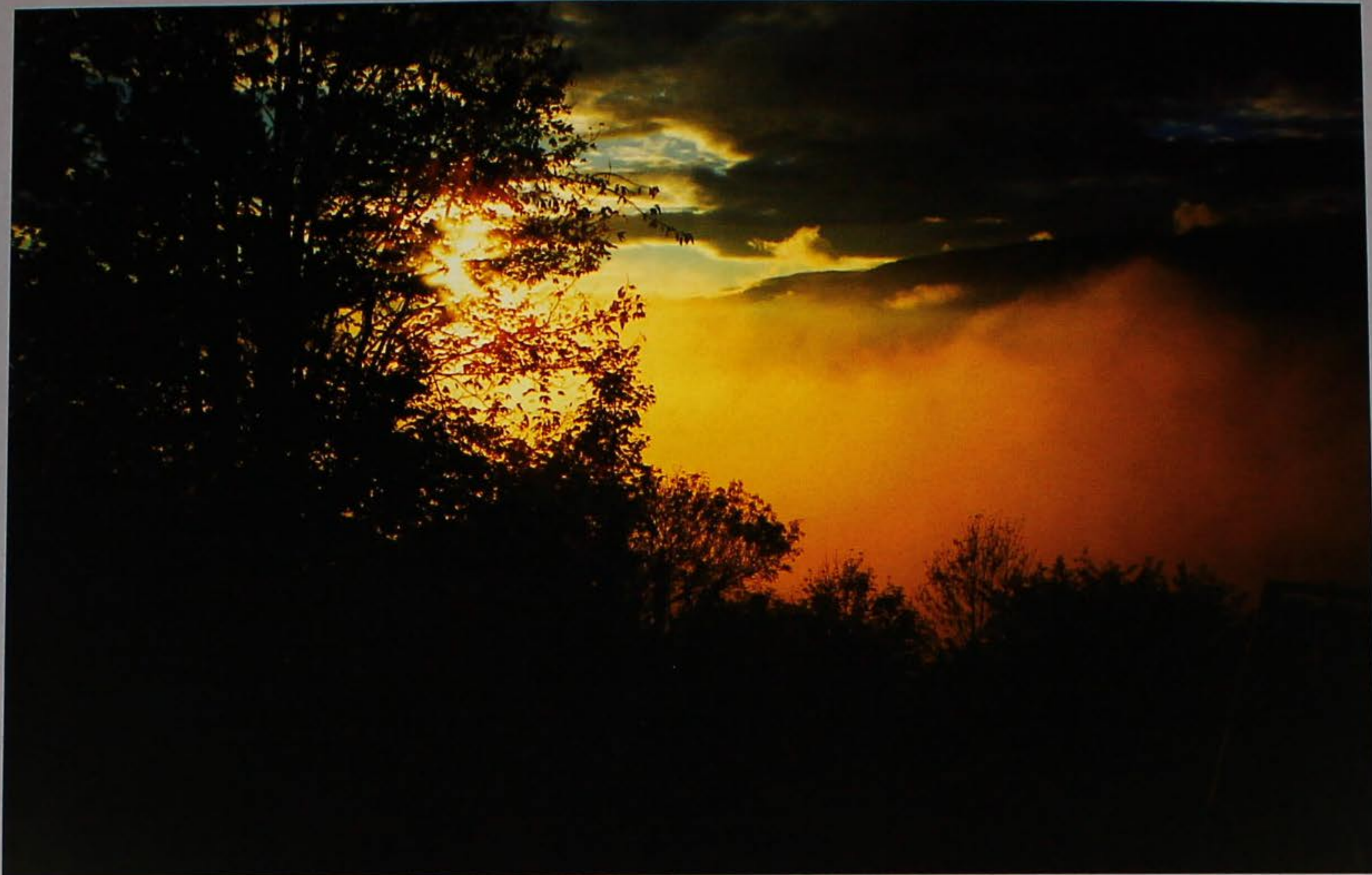
Il sole: ancora un poco e mi vedrete!

polènta pòleje pontara pòro pòrtego pòsso potàcio prèja pria puina punaro punciòto puntaròlo purgare pussièra putèlo quàja