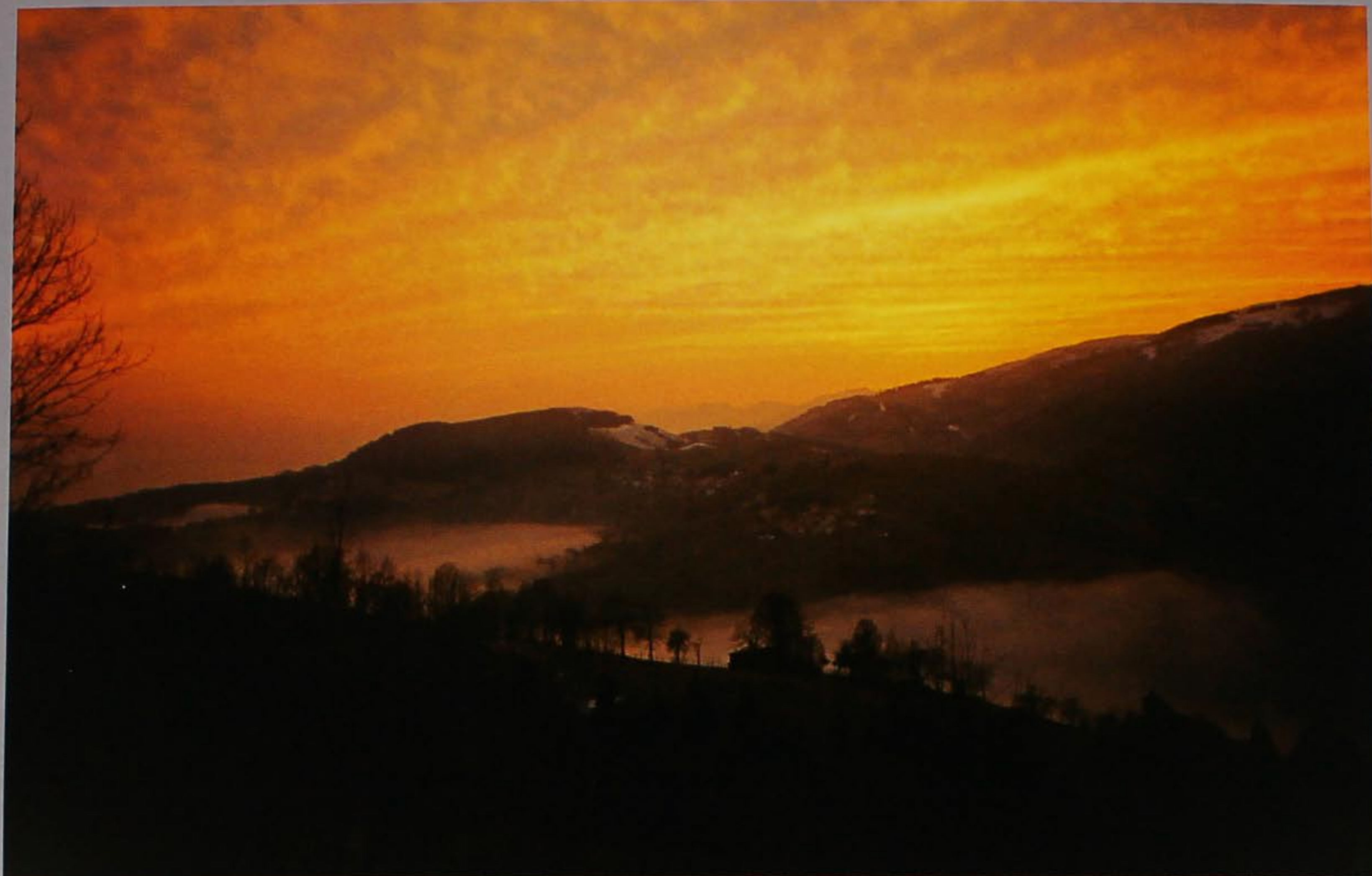
Nebbie o nuvole?

paltàn pèssa pan cuco péso panà pestòn panaro pètene pàndolo pétola panejèlo pevarìn pantegana picàndolo pareciare piegoraro passàja piéto pastèla pignata pastòn pila pastràn pìncia pància patìo pidcio pavejòla piròn pègola pissacàn pèl de òca pissaròla péndola pissigòto penìn pociare pèpola pòja persegaro polde perùssola polegana