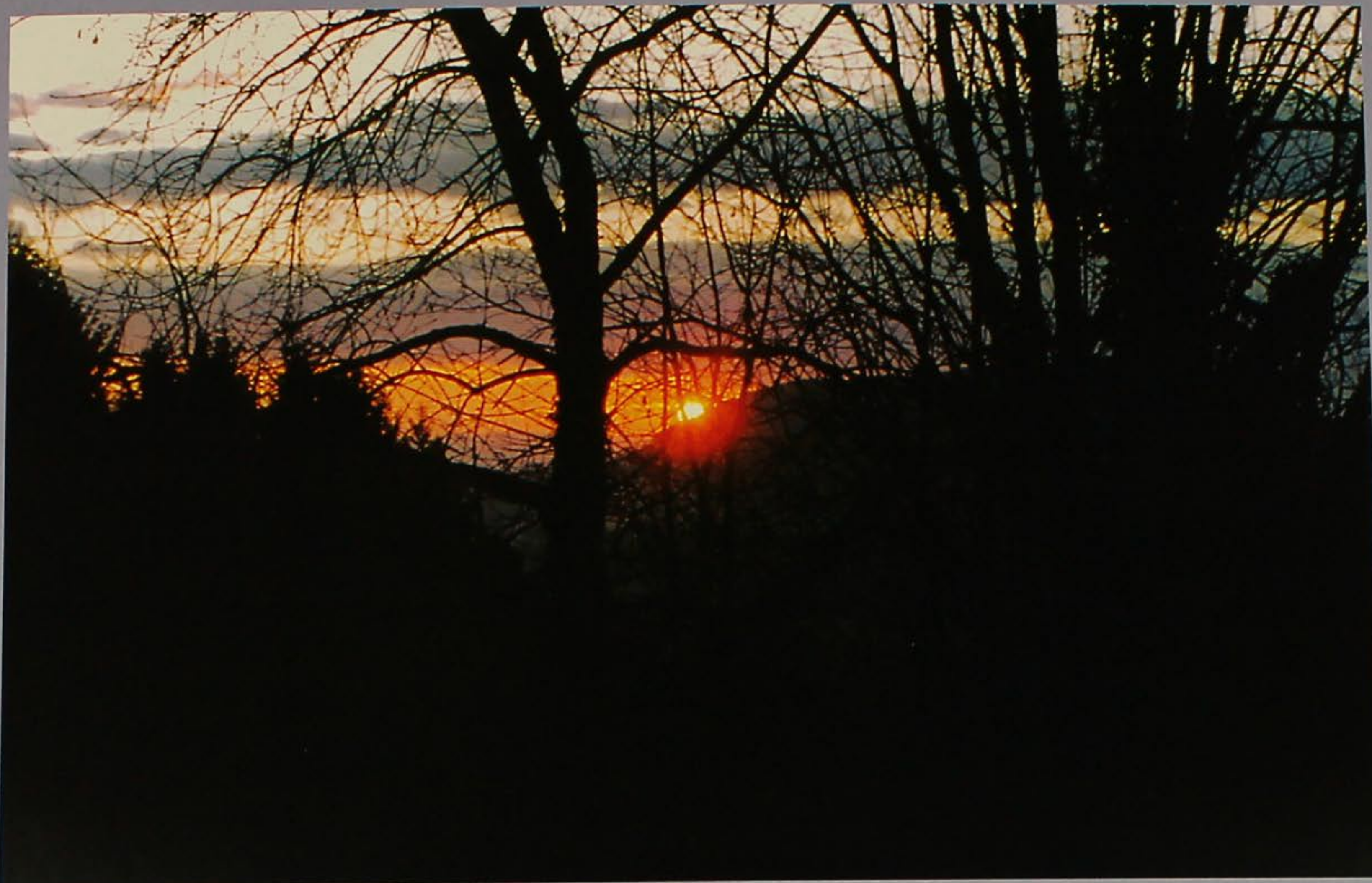
Capolino fra i rami.

siòla spintonare slandròn spissa slavàjo spòrta slijo spotàcio slita spunciòto snaròcio stacagno snoà stagnèta sòcoli stanga socòlo stéco solaro stelin soldame stèrpa sòlfro stopin sopèi strabucarse soranòme strafòjo sorare strangolòn sòrje strapunta sòssoli stravanìo spagnoléta stravénto sparàngola stria spassacujina striòlo spassaòra stropaculi spigasso strossare spenòti struma spéo sucòlo spessegare sugamàn spin supiaòro spinéta svanpio