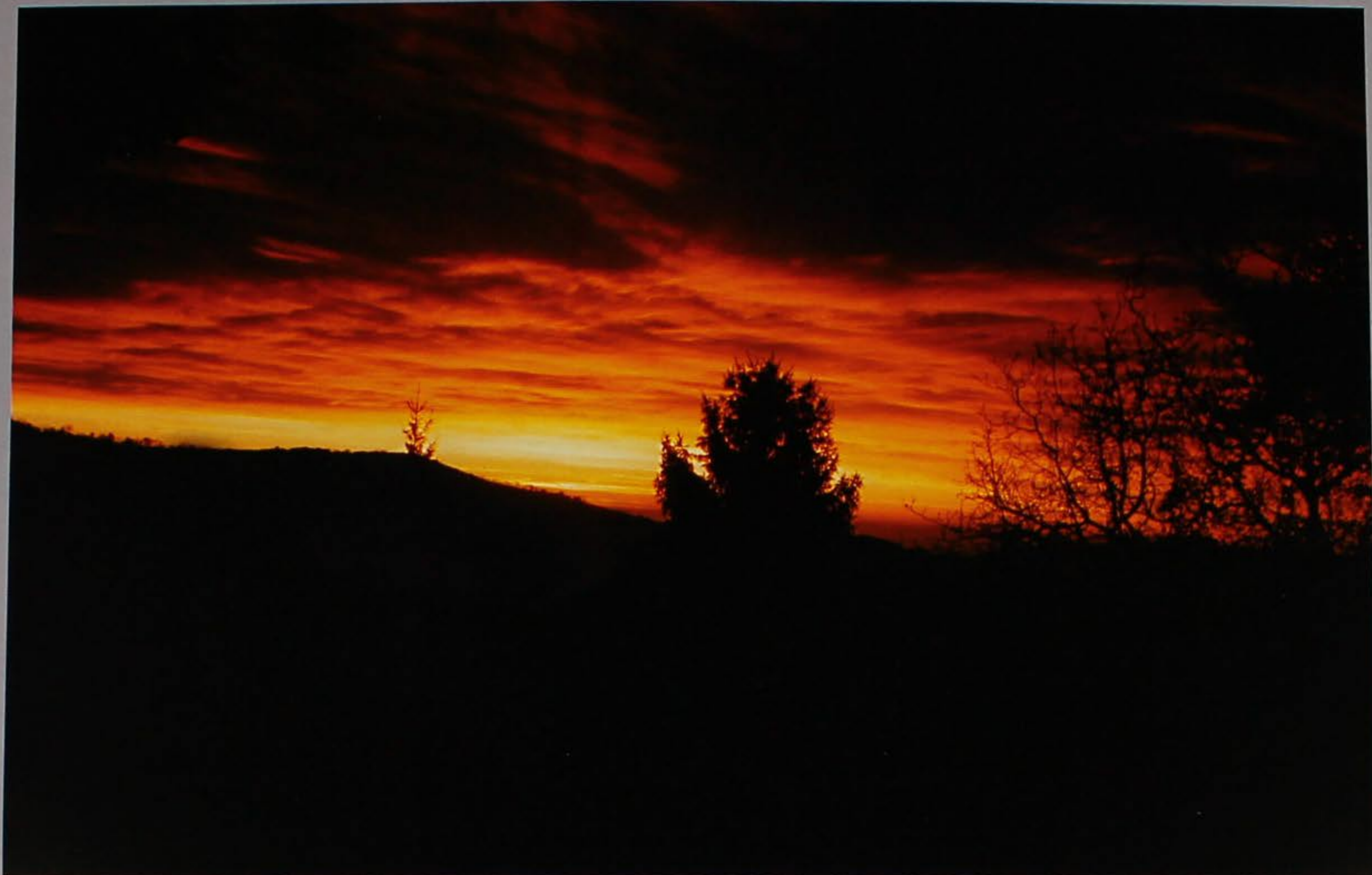
Rosso di sera.

fén forménto ferale fornèla fèri (da calse) forsèlo fèro (da stiro) fortàja fèro (de cavalo) fracà fià fan-fric fiapo fratòn fierume fritole filò fròla fima fruà fiònda fugassa fiòra/e funsiòn (le) (del vin) gàbia fiòsso gadanèla fis-céto galo ('ndare in) fissòlo gate fòdra gavéta fogara gègano fogolare giara fòje giassara foràcio girèlo fòrbeje gnàgnara fòrca gnòca forèta gònbio formajaro gòto formajo gradèla