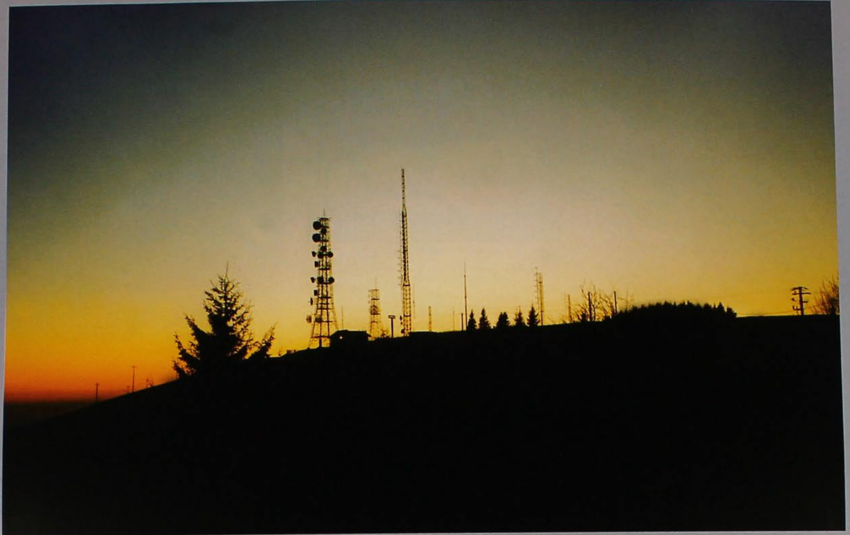
Ultimi messaggi dal sole.

rafeghìn rastèlo rèchie meterna récia reciara recini rejèstola réndete