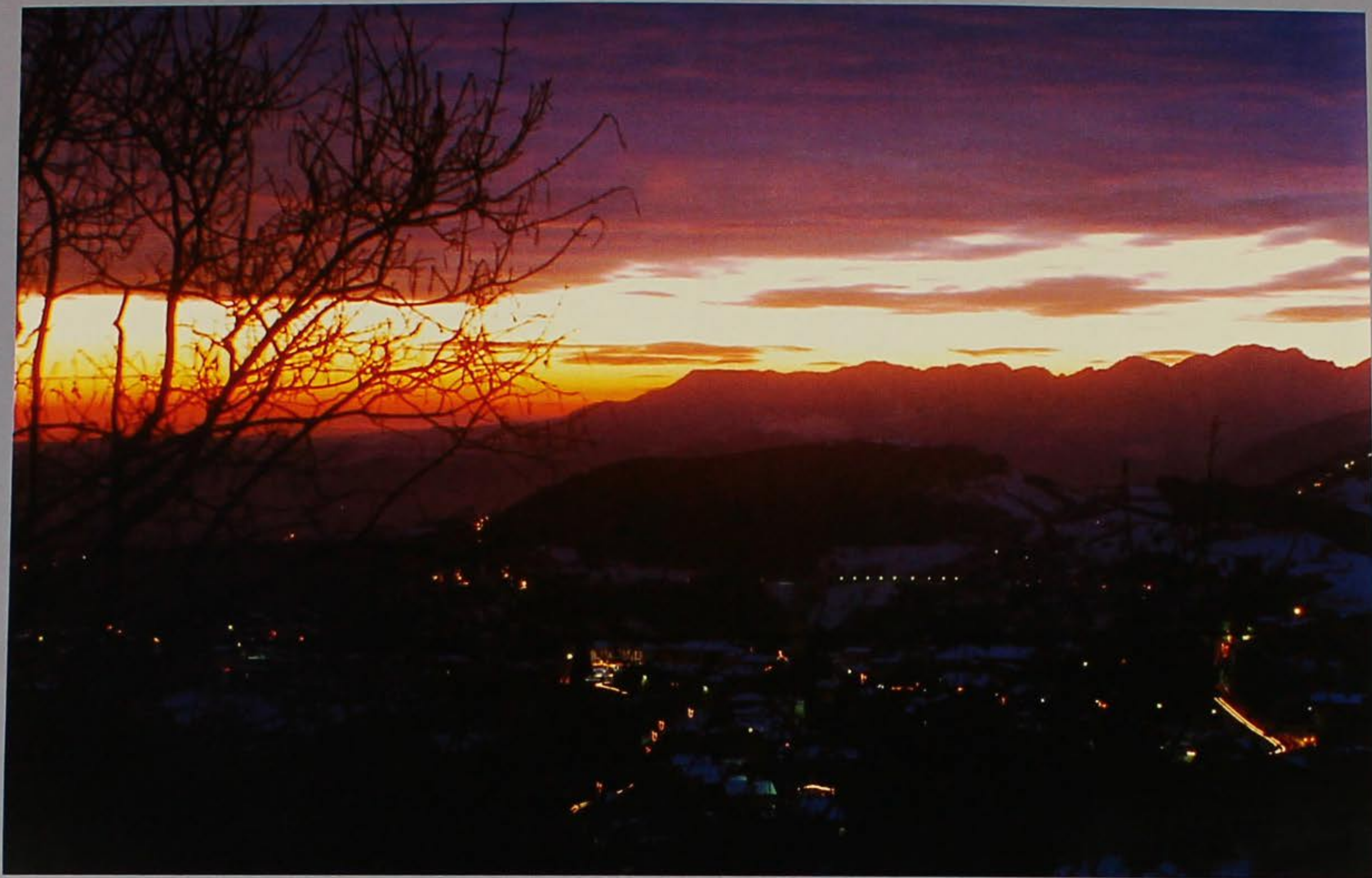
Si accendono le luci.

àmia batòcio anda bauco anta bavaròlo àraje becandòto arfiare becòn armaro bicére armaròn bigòli (i) ardiva bigòlo (el) ava biòto bachéta bissaòrbola bachéto boale bachetèlo boassa bagolina bocale baile bòchene bala bociarda balcuni bòcoli balin bojana banchéto bòjare (bollire) bao boiàre (versare) baraca borasca barba (el) bòrsa barchéssa bòssa barco bòta barèla boton dela pansa baréta braghe bataròla brajòla batelòn brassolaro