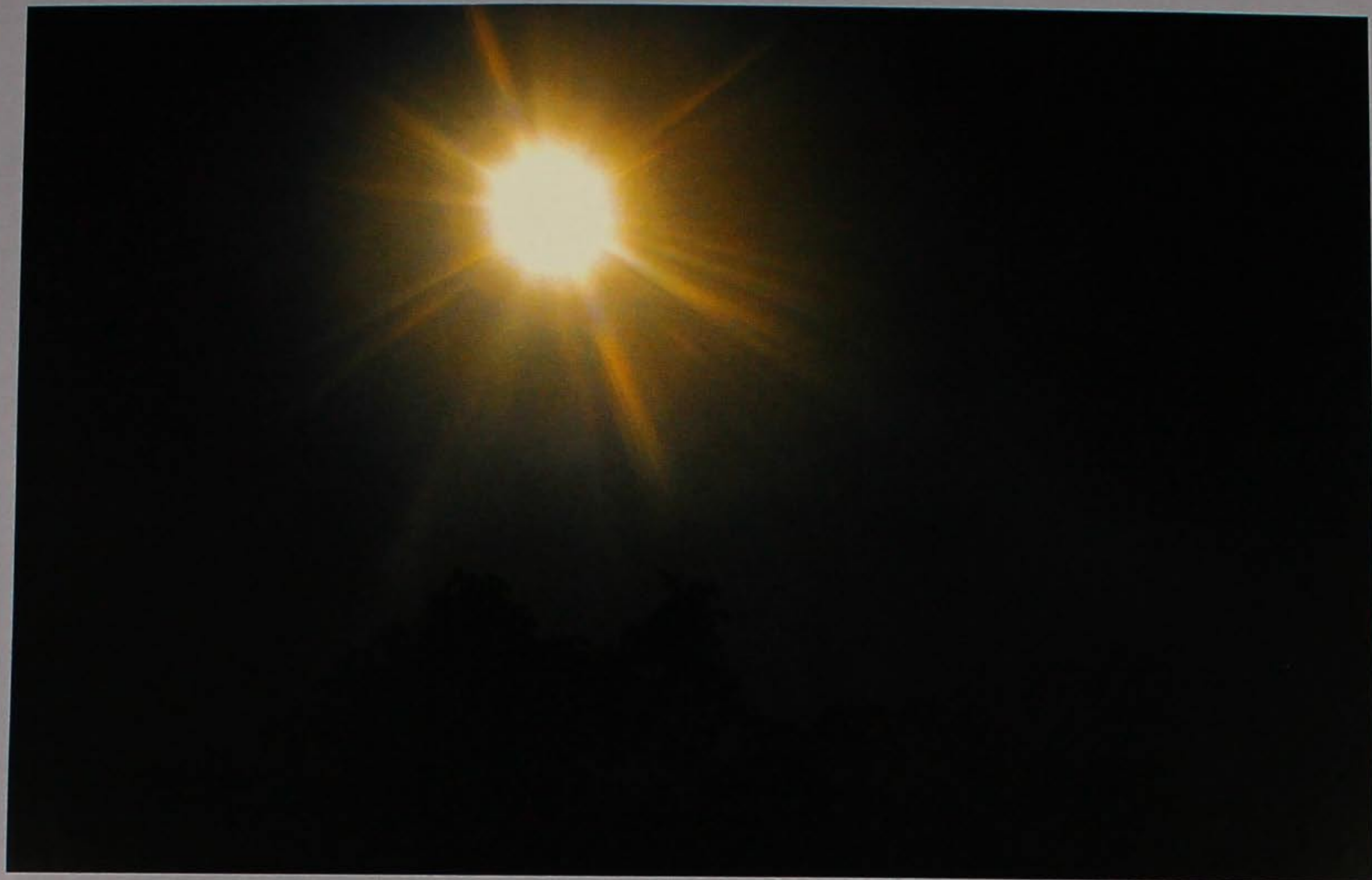
Sole a mezzanotte.

coà cuco coare cugni cocòn cuna coessin danévro cognà de bojo cògoma deale cojonare denòcio colarolo dèrta coltrina desgrassia comàcio desgropare comare despriji comò dessavio comodìn doboto conàjo dréssa conéjo dugare conpare duro de rèce (de anèlo) fabrissiére coradèla fada coramèla fagaro corgnui fajàn còrnola falsa cortèlo far su còtola farinèle crestenare farsòra cròto fajolaro crussia (el fredo) fassina cùbia fastugo