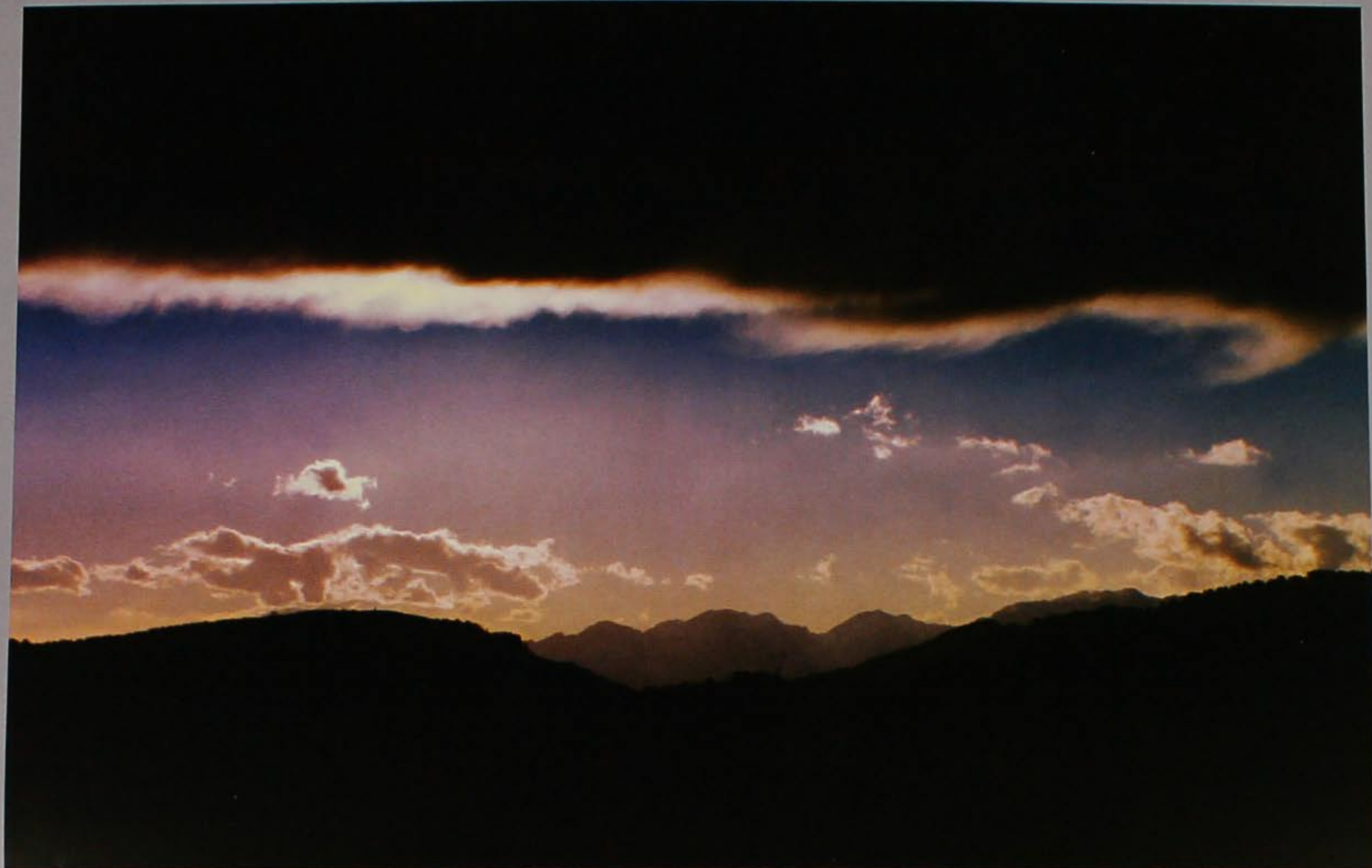
Scende... il buio

ménda novisso mèscola òcio mestèlo òjo minestròn olèga mistro onfegà mòcolo òngia mòja (mètare in) ònto mojéca oraro moléta (el) orassìon mòna orbaròle mònega orinale moréja òrno moscaròla osare muga ofelare mulinèla ossocolo muljaròla ovaròle mùs-cio paca mulina paciarèla napa paco nevegare pai nevodo pàja ninèla pajaro ninsòlo pajèta nogara palanca nòra palèta nojela palpa