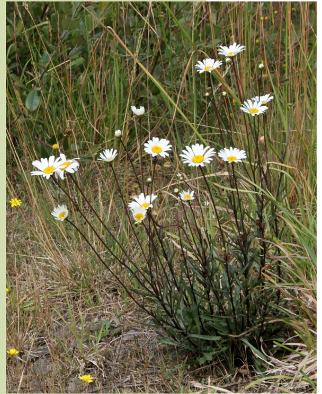
Leucanthemum gallaecicum endémica da metade sur da serra. Florece de xullo a setembro.