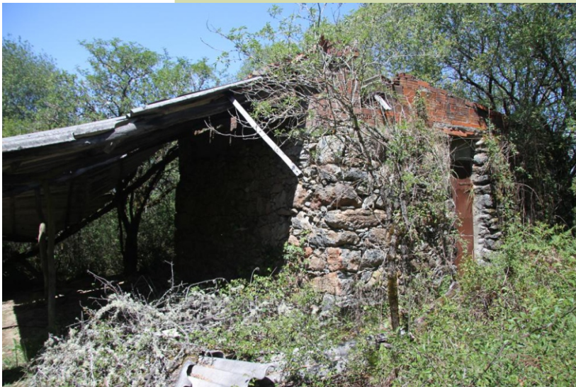
Restos dunha telleira