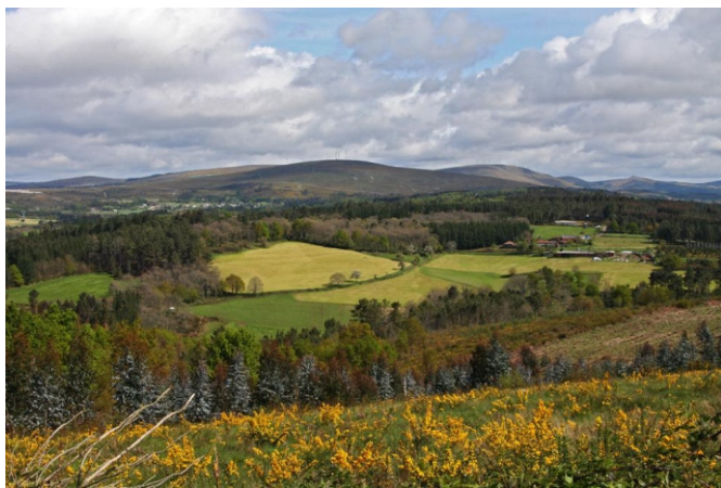
O Careón, vista Sur