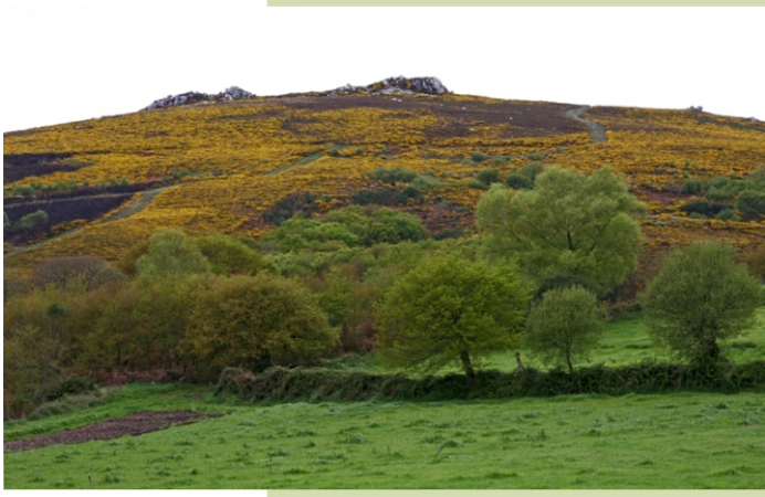
Subida ao Careón pola vertente leste