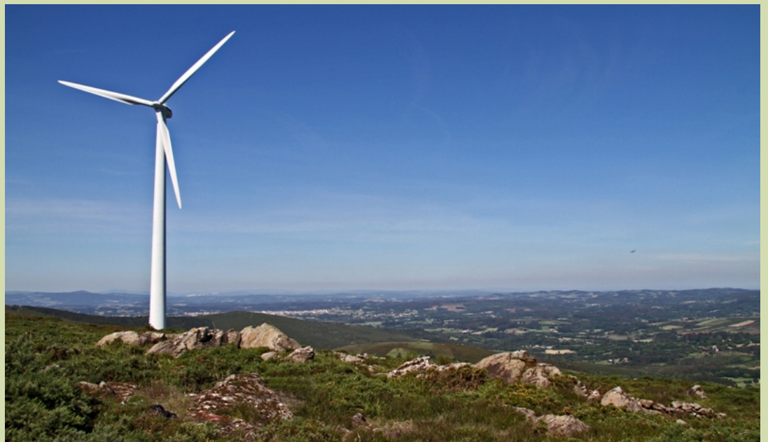
Terra de Melide desde o alto do Careón