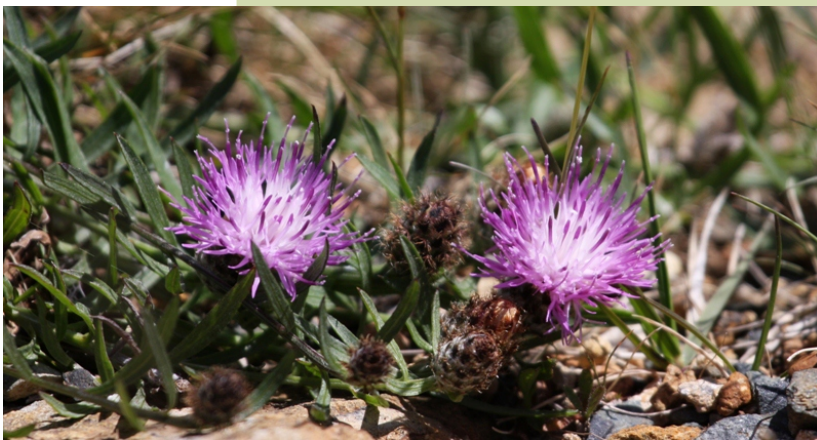
Centaurea janerii subsp. gallaecica .