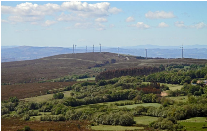
O Castro desde o Careón