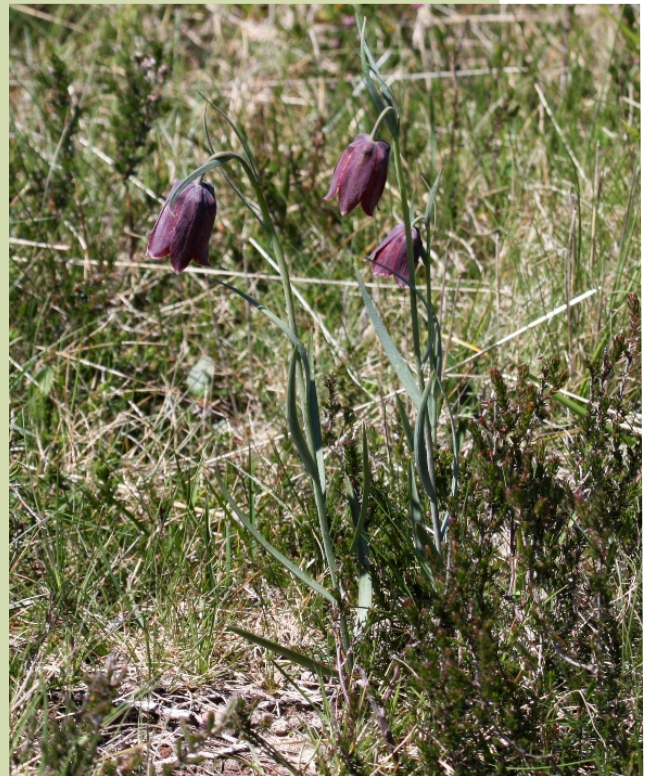
Fritillaria nervosa . En datas temperáns podemos atopar esta planta que é máis común en prados de montaña.