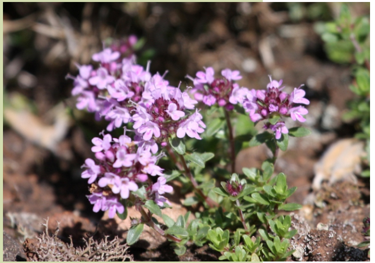
Thymus longicaulis , un tomelo que en Galiza só medra nos terreos ultrabásicos da Capelada e do Careón.