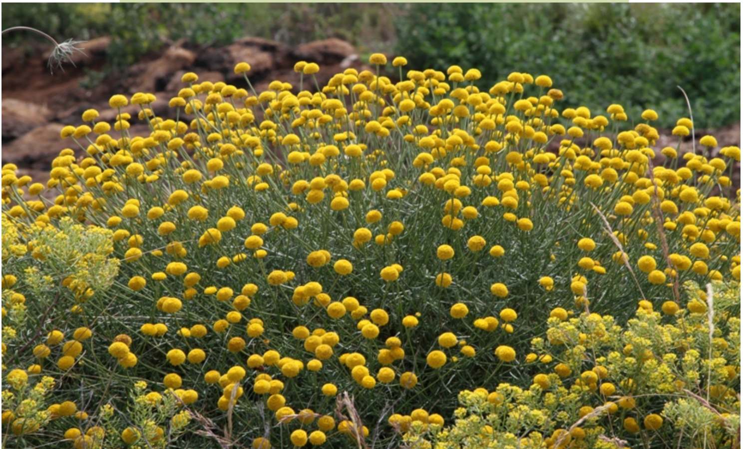
Santolina melidensis é o nome científico desta planta que fai referencia ao lugar no que se atopa. Florece na primeira metade do verán no sur da serra, entre Santiso e Palas de Rei. Está en perigo de extinción por perda do hábitat que está a ser alterado con plantacións forestais e a transformación de grandes superficies de monte en pasteiros.