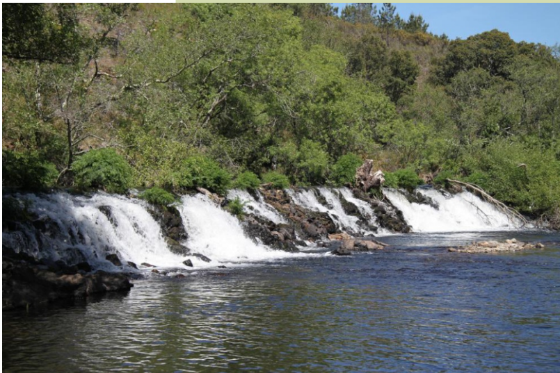
O Ulla en Barazón