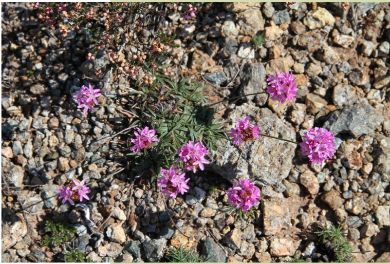
Armeria merinoi é unha especie de herba de namorar de desenvolvemento modesto, asociada ás especiais características do sustrato do Careón que só conta cun pequeno número de exemplares nesta localización.