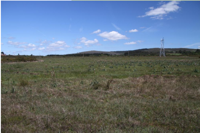
Gándaras de Melide