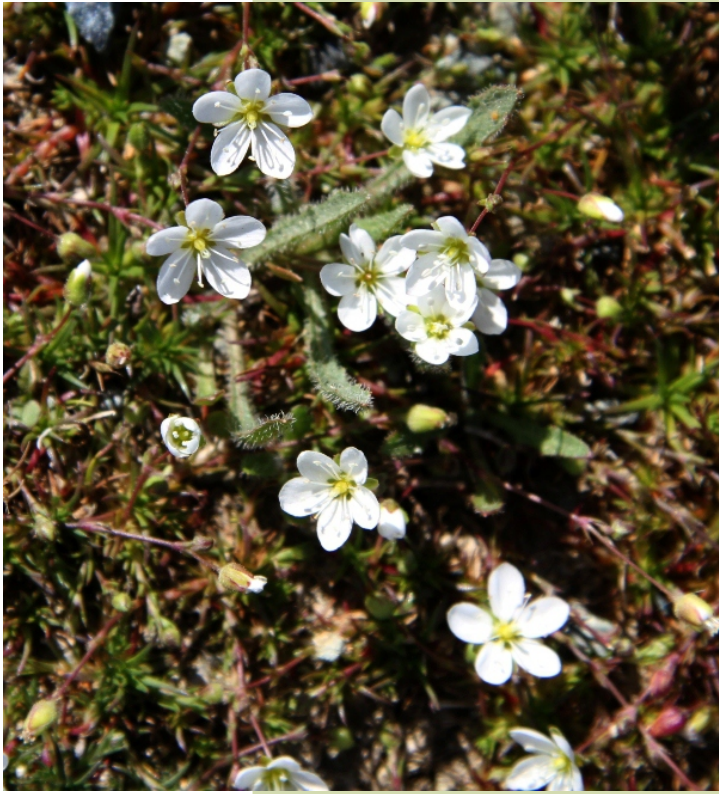
Sagina merinoi esta pequena planta, adicada ao Pai Merino, florece na primeira metade do verán.