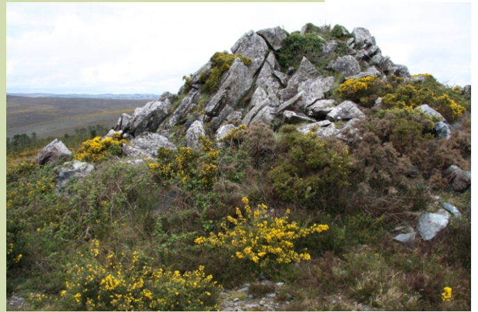
Rochas no cume Careón