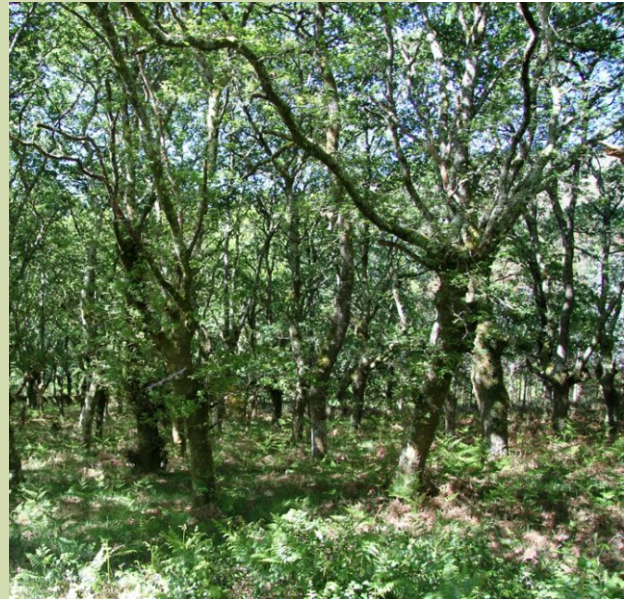
Carballeira en Hospital