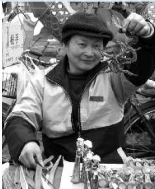
Moltes dones treballen en la venda ambulants.