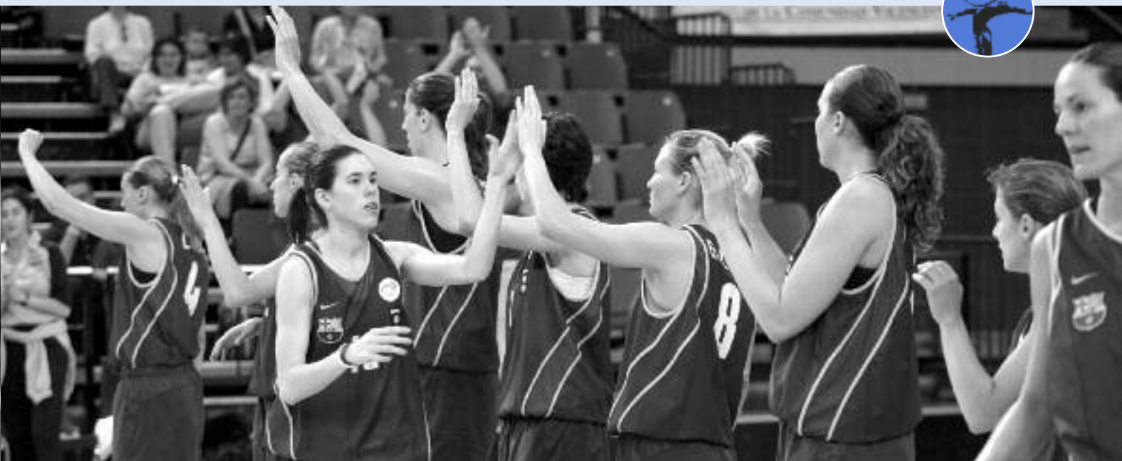
Equip UB Barça