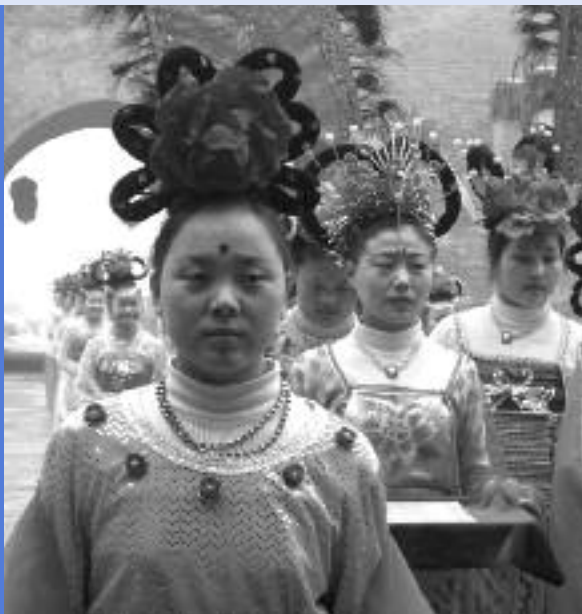
Noies ballant a la muralla de Xian en una recepció.