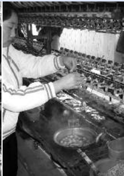
Les dones treballen a les fàbriques de seda.

seccions de la població. El programa inclou importants gratificacions econòmiques per a les famílies que encara que tinguin una nena es sotmeten a la planificació familiar i també als pares i mares que envien a la seva filla a l'escola secundària o a centres d'educació superior.