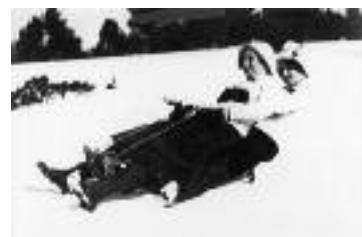
Campionat de luges a La Molina el 1912